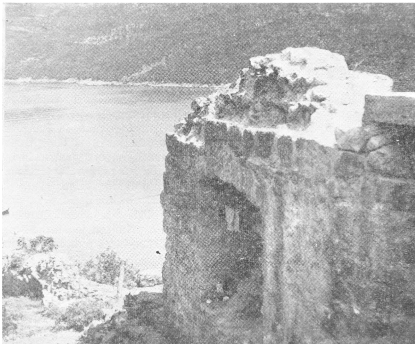
Molunat, građska vrata

s time da među kućama mora biti slobodan prostor širine 4 lakta za općinsku ulicu. U onim pak decenima gdje u roku od 8 dana ne bude izvršena raspodjela, svaki onaj koji ima pravo na to, može izabrati za sebe položaj za kuću i vrt, ali na jednom mjestu. Kuće na preuzetom zemljištu moraju biti izgrađene najkasnije do konca listopada. Nitko ne može zauzeti više od 4 hvata (cca 8 m) u širini istok-zapad i 50 hvata u duljini sjever-jug. Svi oni koji izaberu i prime zemljište, a ne sagrađe kuće do konca listopada gube pravo na zemljište a svi već započeti a nedovršeni radovi na gradnji prelaze u vlasništvo općine. Od tada nadalje nitko nema pravo sam izabrati mjesto već jedino u sporazumu sa svim onima, koji u sporazumu s općinom imaju pravo na dotični decen.