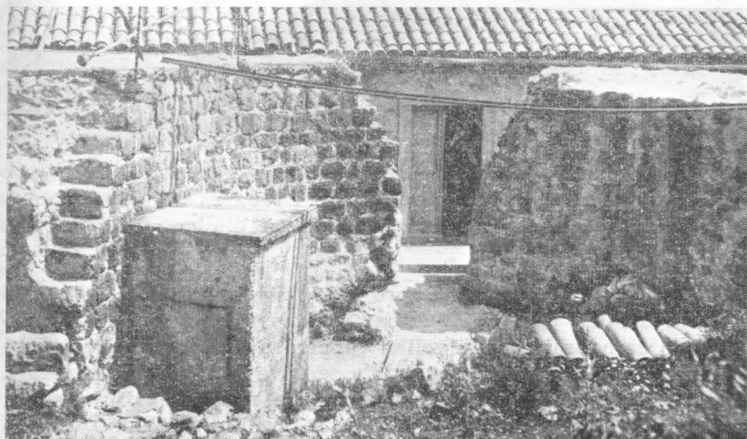
Molunat, unutrašnjost zapadne kule