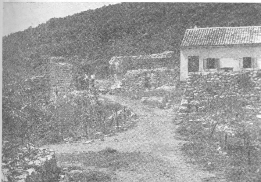
Zidine Molunta s istočnom kulom oštećenom pri gradnji obližnje finansijske stanice u XIX stoljeću