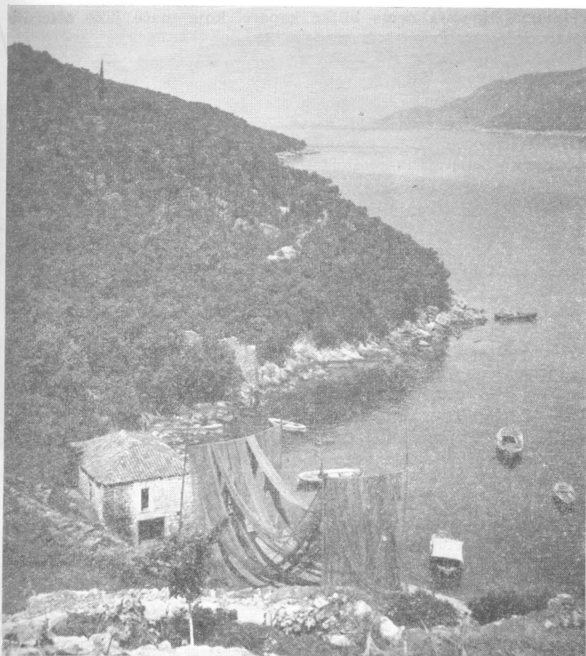
Luka velikog Molunta

iza zida. Najgušće su puškarnice u polukružnim kulama. Na nekim najbolje sačuvanim djelovima vrha zida, prema vani su ostaci, možda nezavršenog prsobrana. Na položaju kod bivših ulaznih vrata naslonjena je na zid s izvanjske strane, bivša austrijska finansijska vojarna, koja je ta vrata zatvorila te je, prolaza radi, srušen zid uz jugo-istočnu kulu. Osim bivše finansijske vojarnje još su neke novije kuće naslonjene na zid s izvanjske strane, a s unutrašnje samo jedna i to novija. Sam zid, osim na mjestima gdje su ga Austrijanci i doseljeni seljaci oštetili prilično je dobro sačuvan. Građen je odličnom žbukom s poznatim moluntskim krečom, koji je vrijedio kao najbolji na našem području. Zanimljivo je da na