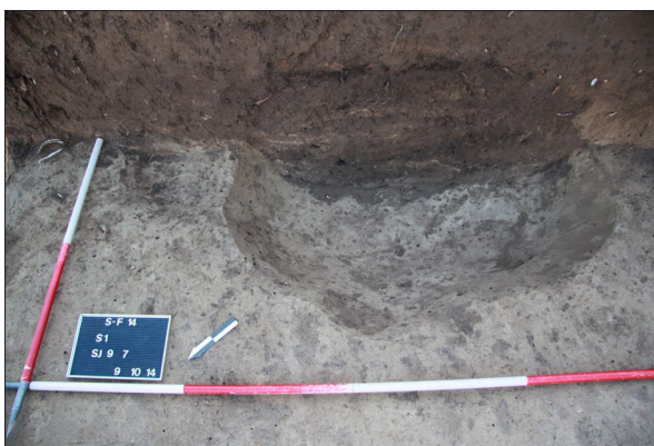
Sl. 5 Sotin Fancage, Ukop jame SJ 7 i stupa SJ 9. Fig. 5 Sotin Fancage, Burials of pit SU 7 and posthole SU 9.