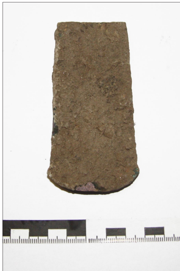
Sl. 3 Sotin Trojstvo, Bakrena sjekira iz SJ 12.

Na položaju Trojstvo prilikom arheoloških istraživanja otkriveni su površinski nalazi ulomaka keramike Belegiš II kulture te spaljene kosti, no nalazi iz kasnoga brončanog doba nisu potvrđeni sondom 1.