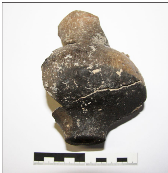
Sl. 7 Sotin Fancage, Ulomak amforice Belegiša I iz SJ 10.