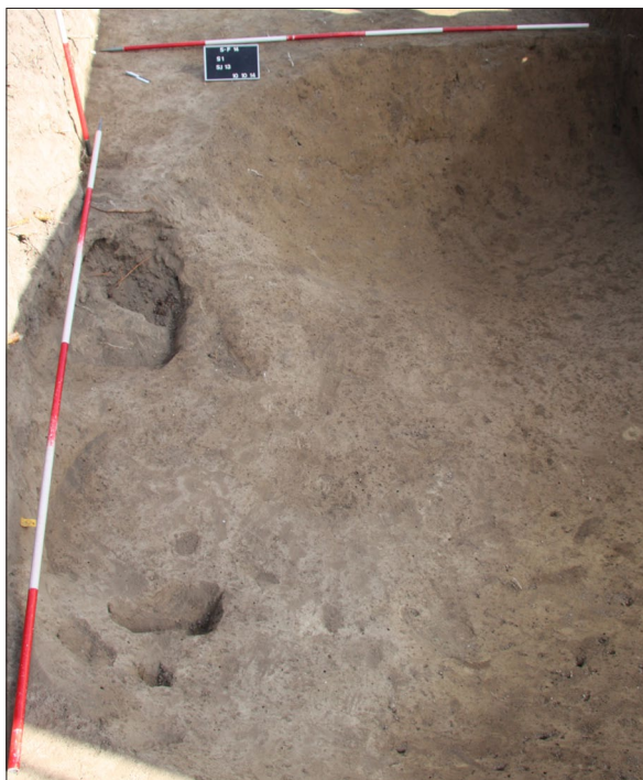
Sl. 8 Sotin Fancage, Istraženi dio zemunice SJ 13.