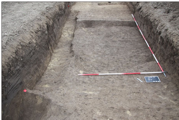
Sl. 2 Sotin Trojstvo, Ukop jame SJ 9 i kanala SJ 13.

Na položaju Trojstvo istraženi su dijelovi naselja sopotske i badenske kulture. U južnom dijelu sonde otkriveni su tragovi novije upotrebe zemljišta (vinograda ili voćnjaka).