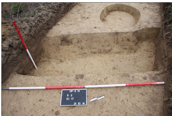
Sl. 13 Opatovac Šanac, Kanal SJ 17. Fig. 13 Opatovac Šanac, Ditch SU 17.