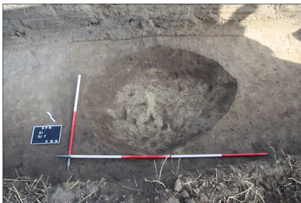
Sl. 10 Sotin Plandište, Ukop jame SJ 7.

položaj naselja ili groblja iz kasnoga brončanog doba i odnos prema obližnjem naselju Belegiš II kulture na Srednjem polju.