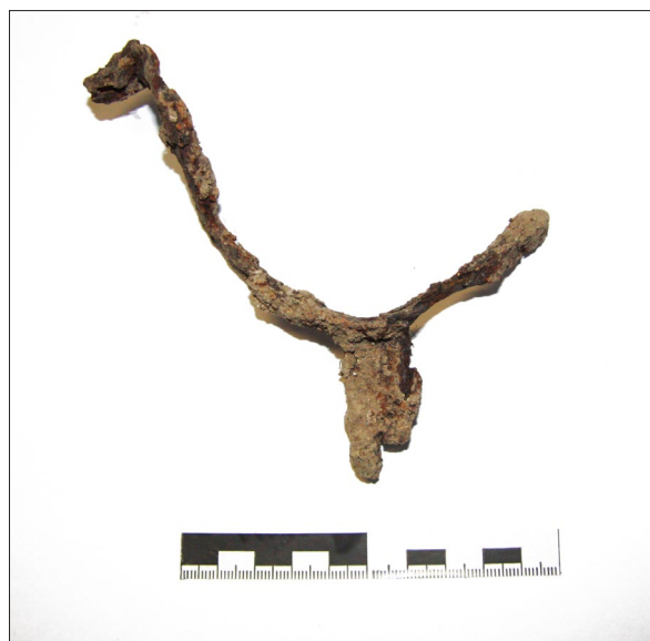
Sl. 12 Sotin Plandište, Ulomak ostruge iz jame SJ 17.

U Sotinu, na položaju Trojstvo, zapadno od sela, bliže Vučedolu, otkriveni su tragovi sopotskog i badenskog naselja.