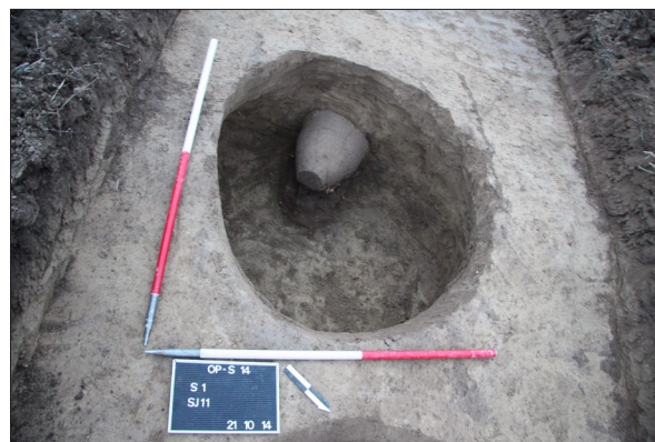
Sl. 15 Opatovac Šanac, Lonac PN 7 in situ u jami SJ 11. Fig. 15 Opatovac Šanac, PN 7 pot in situ in pit SU 11.