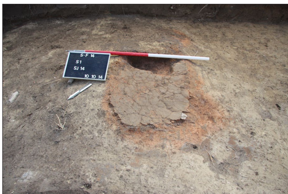
Sl. 9 Sotin Fancage, Ognjište SJ 14.

Fig. 9 Sotin Fancage, Fireplace SU 14.