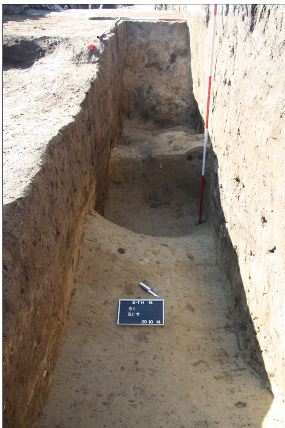
Sl. 4 Sotin Trojstvo, Ukop jarka SJ 11. Fig. 4 Sotin Trojstvo, Burial of ditch SU 11.