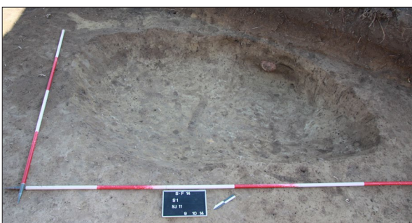
Sl. 6 Sotin Fancage, Ukop jame SJ 11. Fig. 6 Sotin Fancage, SU 11 pit burial.