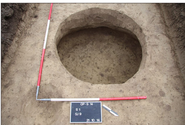
Sl. 14 Opatovac Šanac, Jama SJ 9. Fig. 14 Opatovac Šanac, Pit SU 9.