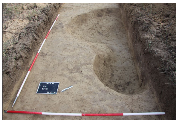
Sl. 16 Opatovac Šanac, Istraženi dio poluzemunice SJ 15. Fig. 16 Opatovac Šanac, Researched part of the SU 15 half-dugout.