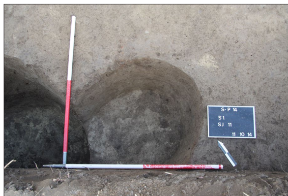
Sl. 11 Sotin Plandište, Ukop jame SJ 11.

Fig. 9 Sotin Fancage, Fireplace SU 14.