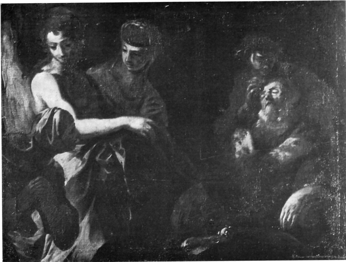
PAUL TROGER (?), Liječenje slijepog Tobije — Muzej Brukenthal, Sibiu