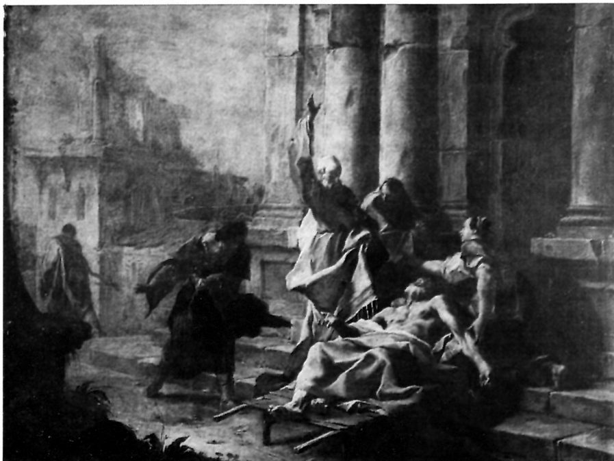
PAUL TROGER, Sv. Petar liječi bolesnika — Muzej Brukenthal, Sibiu