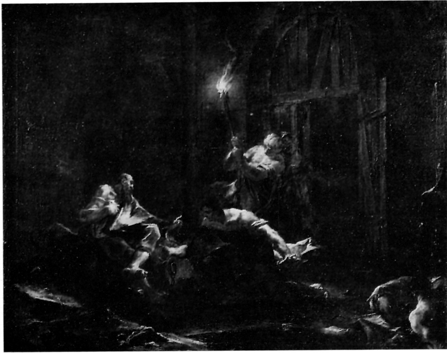
PAUL TROGER, Nagovaranje Sokrata na bijeg iz zatvora — Muzej Brukenthal, Sibiu