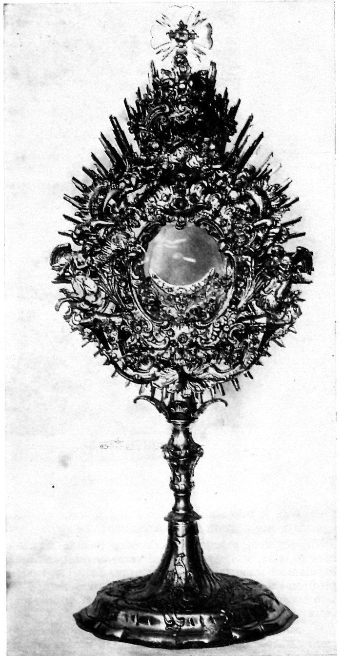
ANTONIUS TÖRÖK, Monstranca (1773) Varaždin, Župna crkva sv. Nikole

Najistaknutija središta zlatarske i srebrnarske umjetnosti u kontinentalnoj Hrvatskoj predstavljaju od 14. stoljeća nadalje grad Zagreb (zlatar Blaž iz Zagreba radio je međutim već krajem 13. stoljeća u Zadru) 1 , a od 15. stoljeća nadalje Varaždin. 2