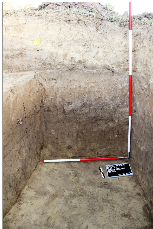
Sl. 2 Nasipi tumula 1.

U sondi 10 pronađena su tri rimska paljevinska groba od kojih dva pripadaju tipu bustum . Po količini i kvaliteti prona-