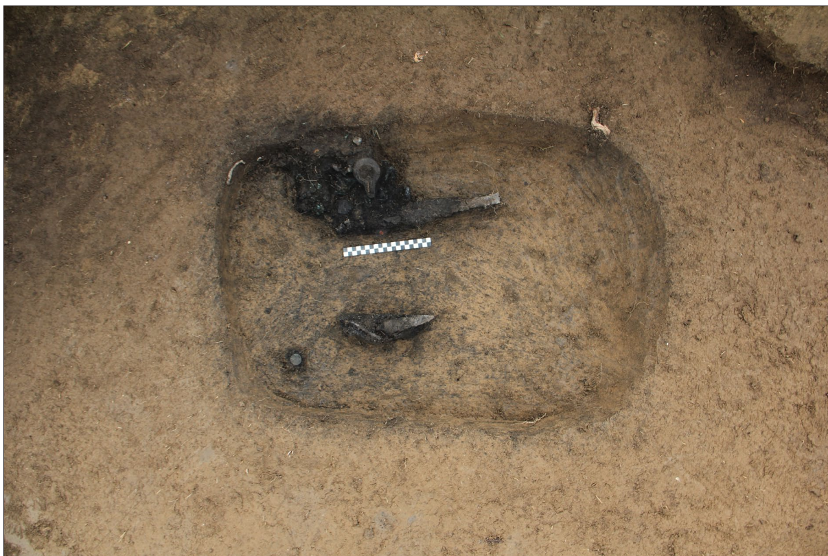
Sl. 6 Grob 95.