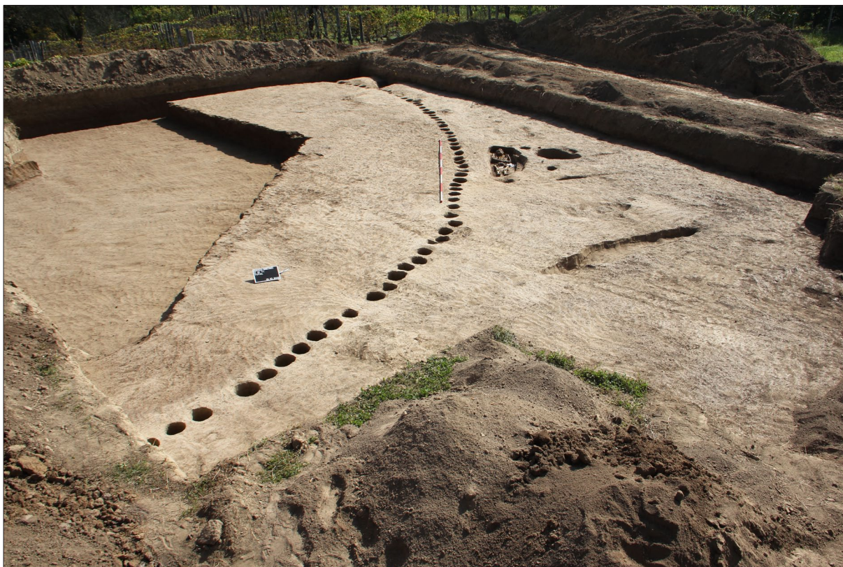
Sl. 4 Konstrukcija ograde tumula 1.