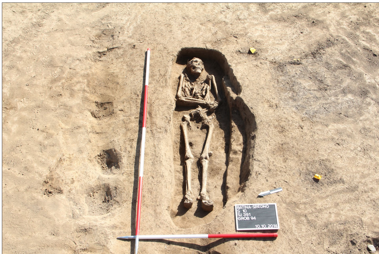
Sl. 5 Grob 94.