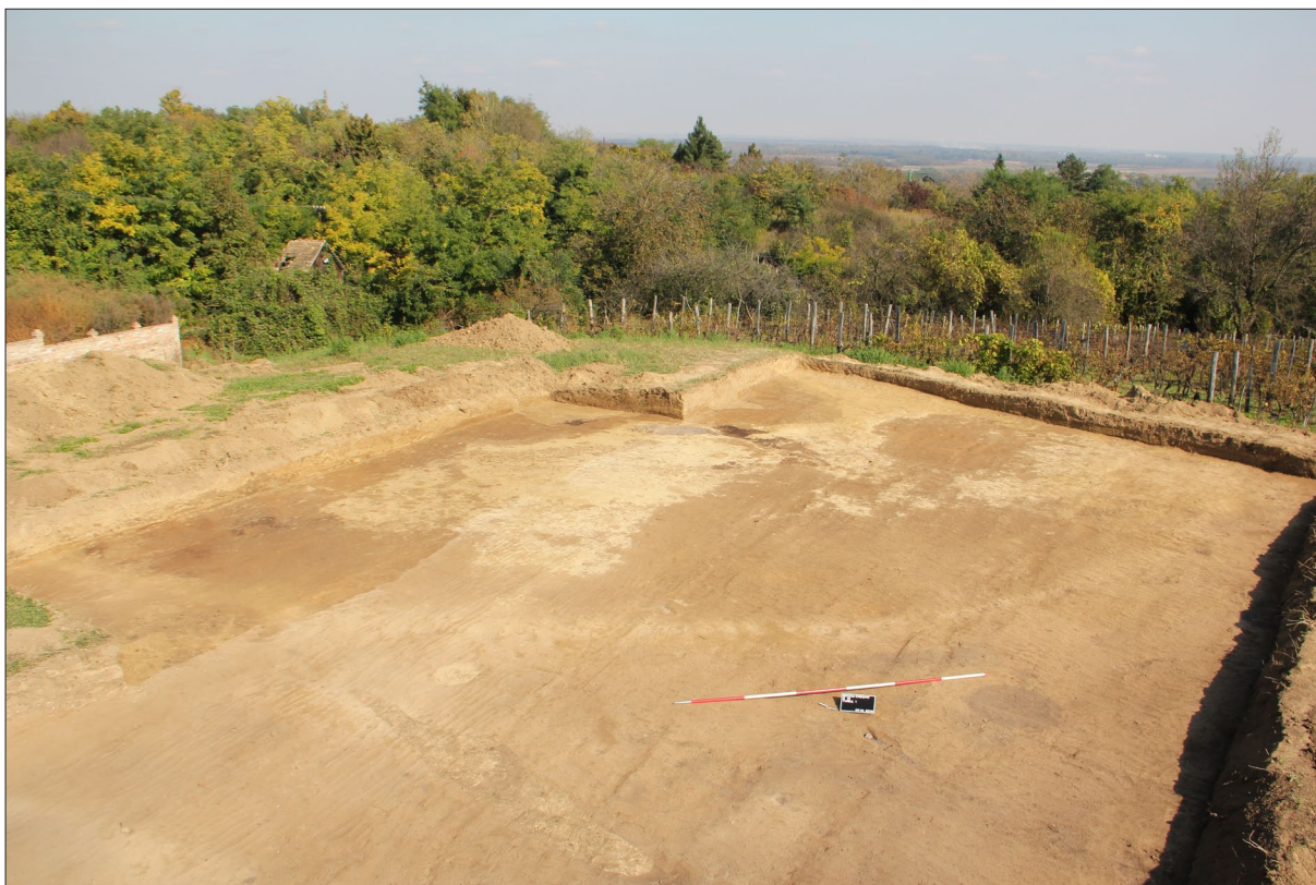
Sl. 1 Pogled na tumul 1.

Fig. 1 View of tumulus 1.