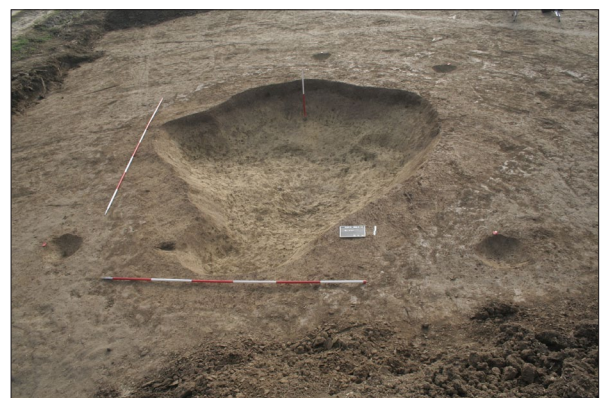
Sl. 3 Poluukopani objekt SJ 234 s okolnim stupovima od nadzemne konstrukcije.

Istražena infrastruktura naselja dopunjava dosadašnje