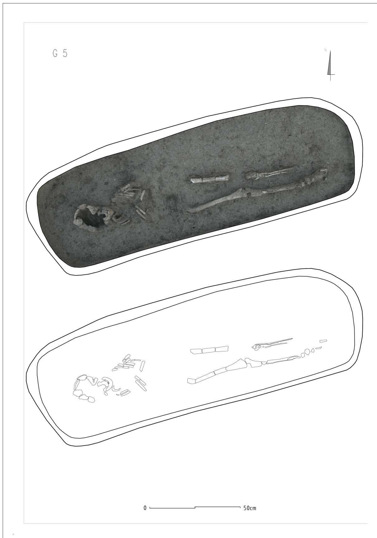
Sl. 10 Srednjovjekovni grob (za Institut za arheologiju izradio: Arheoplan d. o. o.).