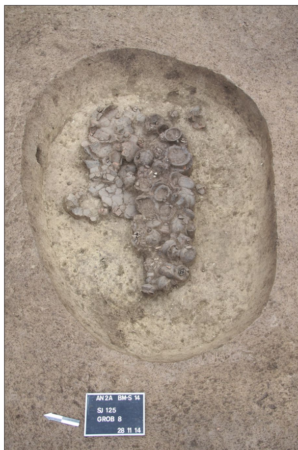
Sl. 7 Grob 8.

Fig. 6 Double burial in grave 17 with two urns.