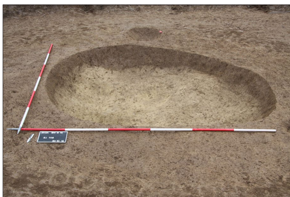
Sl. 2 Jama SJ 108.

Njihov položaj također sugerira da je istraživanjima na trasi zahvaćen samo južni periferni rub lasinjskog naselja. Dosad su na području Baranje nalazišta lasinjske kulture zabilježena terenskim pregledima (Bojčić et al. 2010: 83, tab. 1). Prema širim kartama rasprostranjenosti na području zapadne Baranje mogao bi se očekivati istočni rub rasprostiranja čime bi nalazi iz Belog Manastira – Širine dopunili podatke o njezinoj rasprostranjenosti i istočnoj granici (Banffy 1994: Fig. 2).