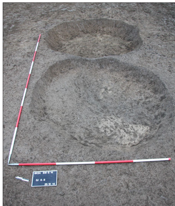
Sl. 9 Jame SJ 6 i 8.

Zaštitna istraživanja uputila su i na činjenicu da su doline velikih rijeka poput Dunava i Drave činile prirodne komunikacije i danas vidljive u prostoru, ali da su između njih postojale manje komunikacije koje su također imale iznimnu važnost u komunikaciji prapovijesnih i srednjovjekovnih zajednica koje su nastanjivale ovaj prostor, a koje je bez ovakvih istraživanja teže iščitavati i proučavati.