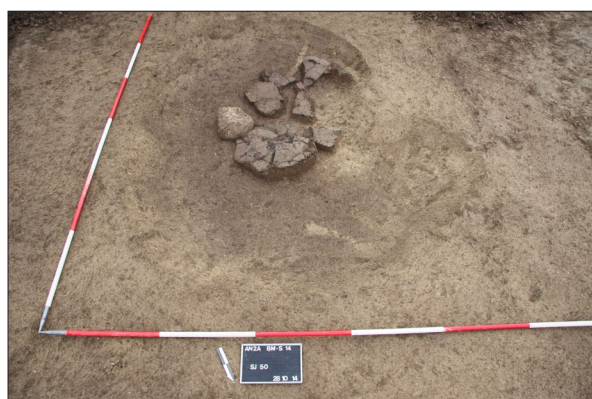
Sl. 5 Jama SJ 51 s posudama i kamenim žrvnjem in situ.

Fig. 4 Workspace SU 76 dug in.