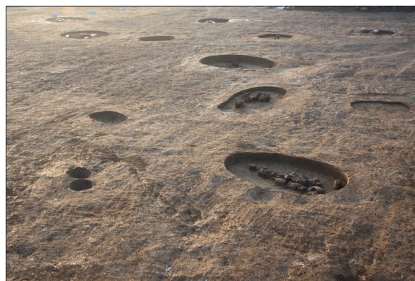
Sl. 8 Pogled na istraženi dio groblja kulture inkrustirane keramike.

Fig. 7 Grave 8.