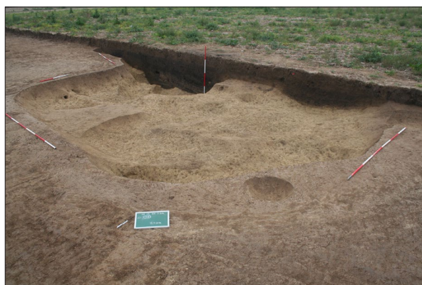
Sl. 4 Ukopani radni prostor SJ 76.

Rezultati zaštitnih istraživanja pružaju mnoge mogućnosti u daljnjem proučavanju života u naselju i poimanja smrti kroz pogrebne običaje zabilježene prilikom istraživanja groblja krajem ranoga brončanog doba.