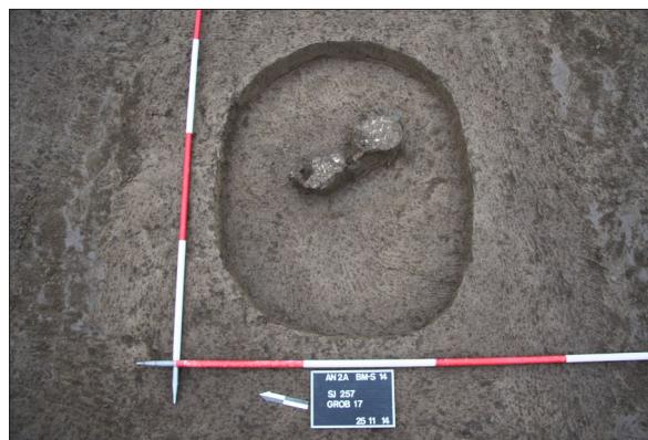
Sl. 6 Dvojni grob 17 s dvije urne.

Fig. 5 Pit SU 51 with pots and a grindstone in situ.