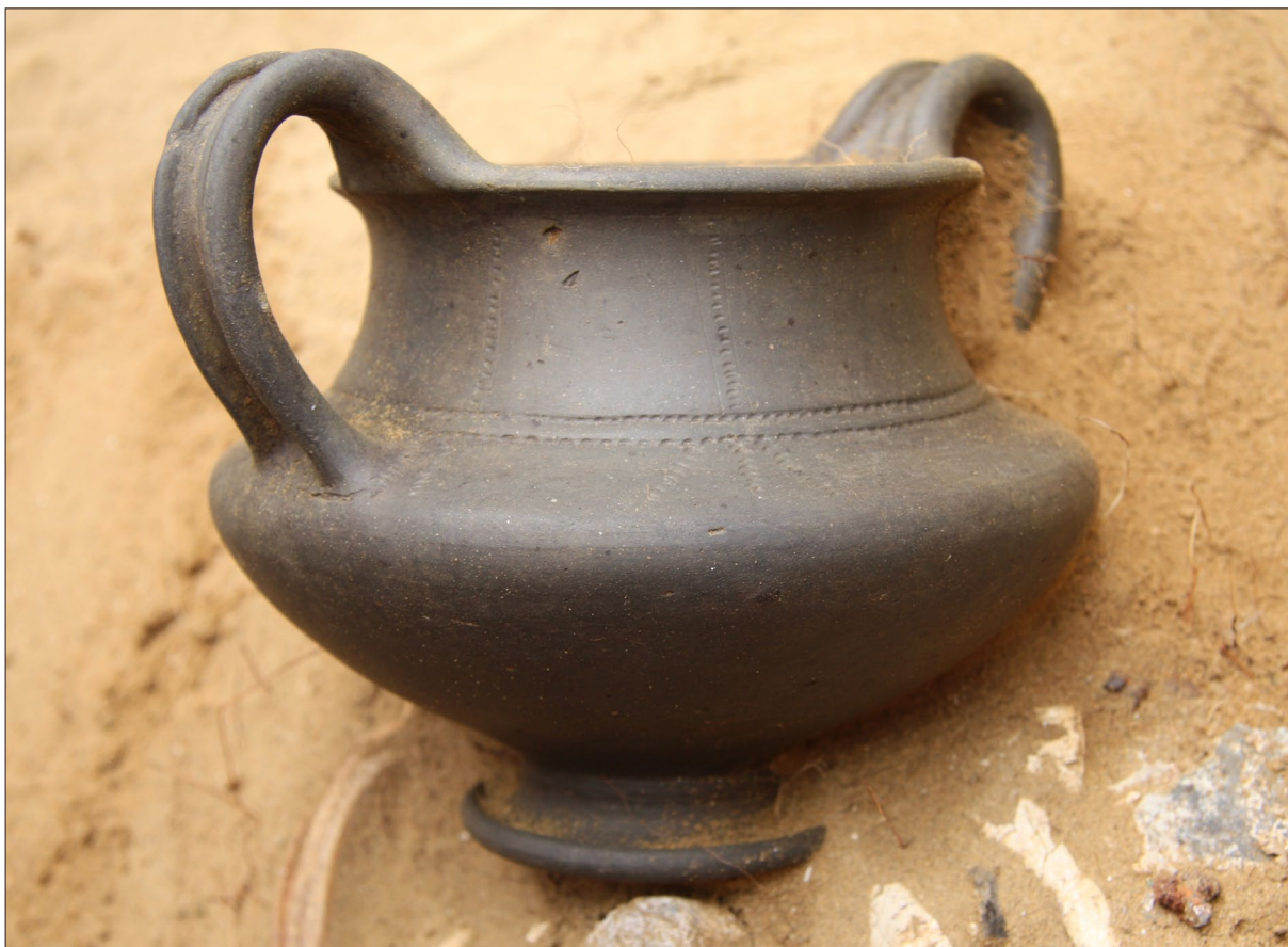
Sl. 2 Kantharos iz groba LT 104.