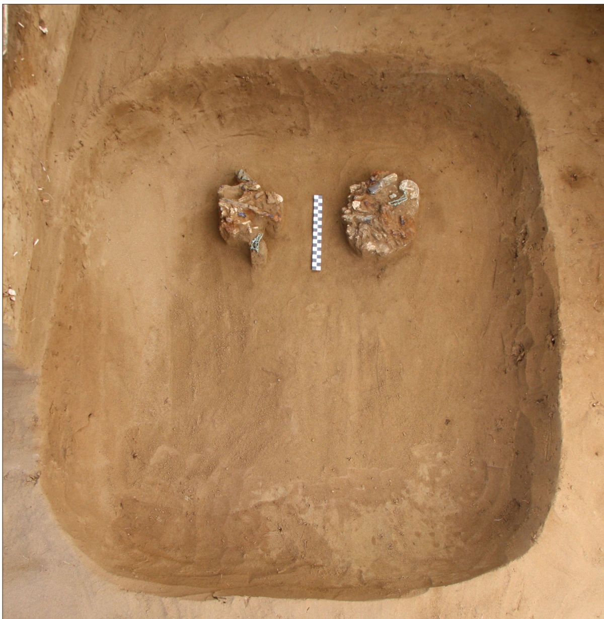
Sl. 1 Grob LT 103.