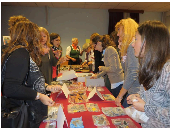
Sl. 5 Show and tell – pregledavanje i upoznavanje s keramikom Pannonische Glanztonware tijekom kolokvija (snimio: L. Modrić).