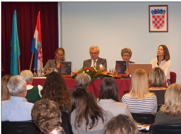
Sl. 4 Predstavljanje Zbornika II. međunarodnog kolokvija.