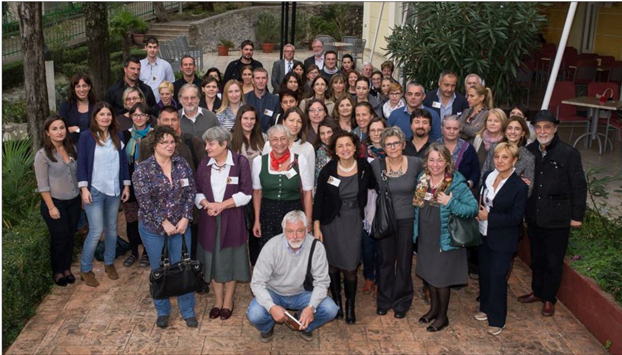
Sl. 3 Sudionici III. međunarodnog kolokvija u Crikvenici.