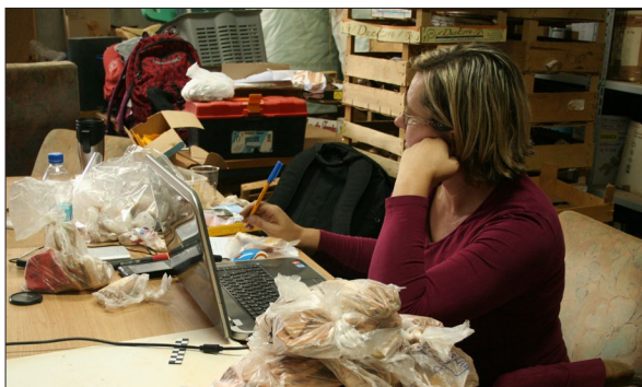
Sl. 1 Rad na pripremi baze podataka: analiza primjene tipologije crikveničke keramike.