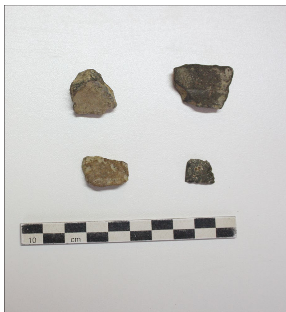
Sl. 9. Bocanjevci-Suvar (4) – Prapovijesna keramika