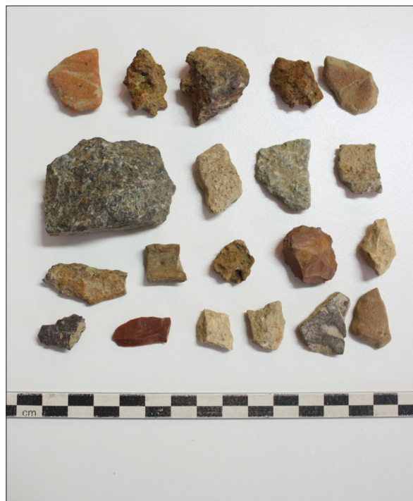
Sl. 8. Bocanjevci-Pašnik (2) – Prapovijesna keramika i litički artefakti