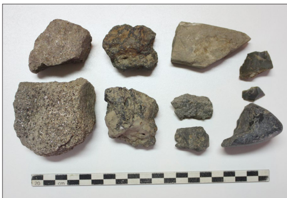
Sl. 5. Marjanski Ivanovci-Žagrovac – Šljaka i kamen s lokaliteta