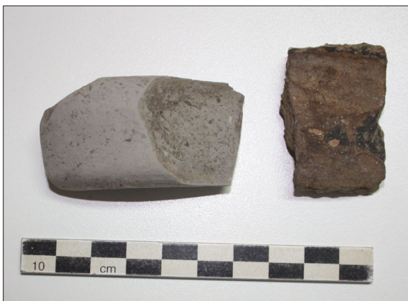
Sl. 7. Bocanjevci-Otok (1) – Fragment glačane kamene sjekire i fragment prapovijesne keramike