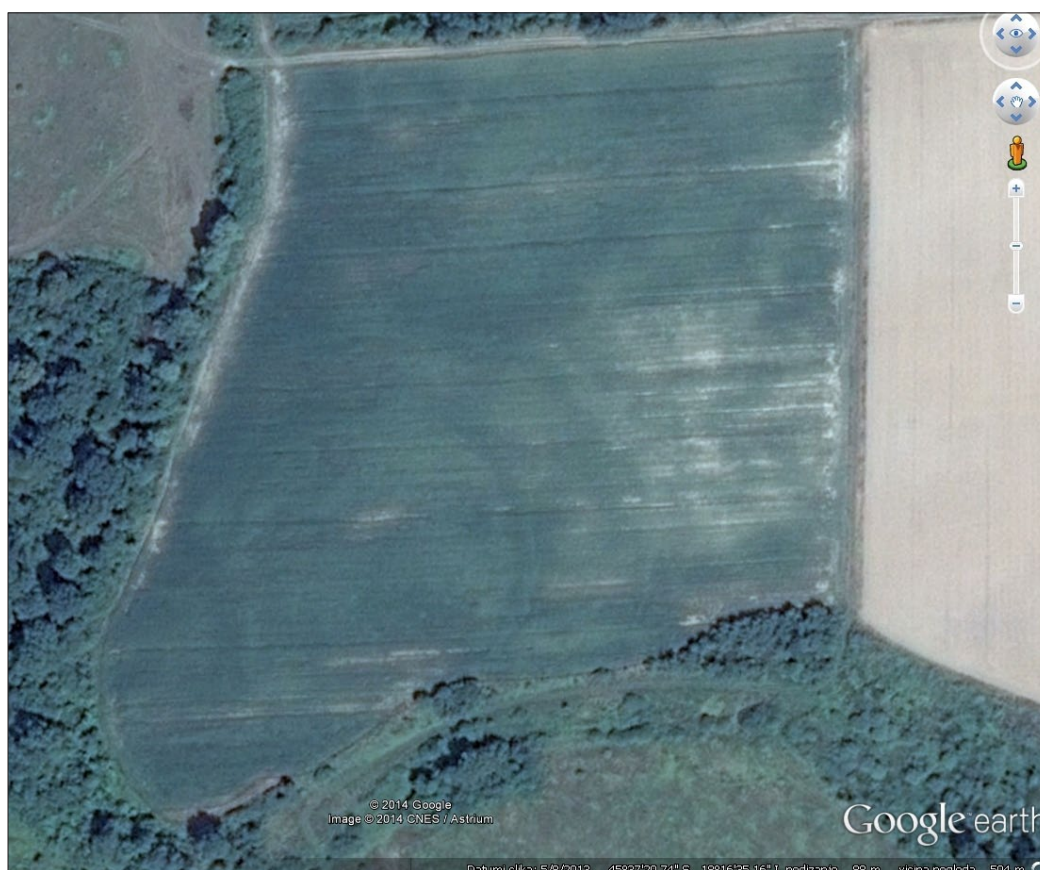
Sl. 13. Lokalitet Marjanski Ivanovci-Zagrovac s vidljivim položajem kružnog jarka oko lokaliteta i mogućim dvostrukim jarkom.

Fig. 12 Bocanjevi-Suvar (3) (according to Google Earth).