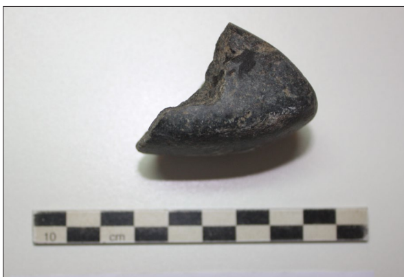
Sl. 6. Marjanski Ivanovci-Žagrovac – Fragment glačane kamene sjekire