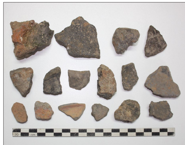
Sl. 4. Marjanski Ivanovci-Žagrovac – Prapovijesna keramika

Fig. 2 Marjanski Ivanovci-Žagrovac – Medieval pottery