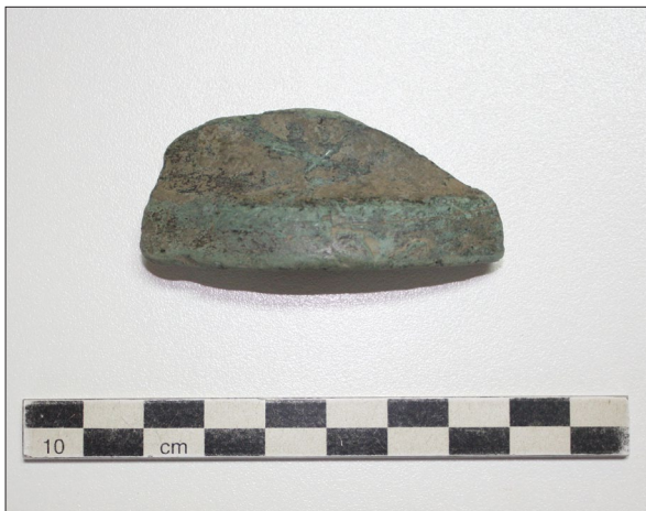
Sl. 1. Marjanski Ivanovci-Žagrovac – Fragment brončanog predmeta

In 2014 the Institute of Archaeology from Zagreb started a project of systematic archaeological field survey of Donji Miholjac and surrounding municipalities. The project's objective is to give better insight into the settlement pattern of that area through archaeological periods, in order to create a micro-topography of this part of River Drava Basin.