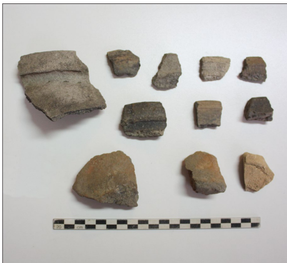
Sl. 2. Marjanski Ivanovci-Žagrovac – Srednjovjekovna keramika

Fig. 3 Marjanski Ivanovci-Žagrovac – Roman pottery