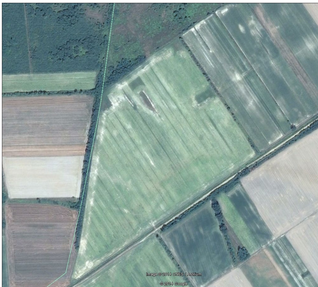
Sl. 12. Bocanjevi-Suvar (3) (prema Google Earth).

Fig. 12 Bocanjevi-Suvar (3) (according to Google Earth).