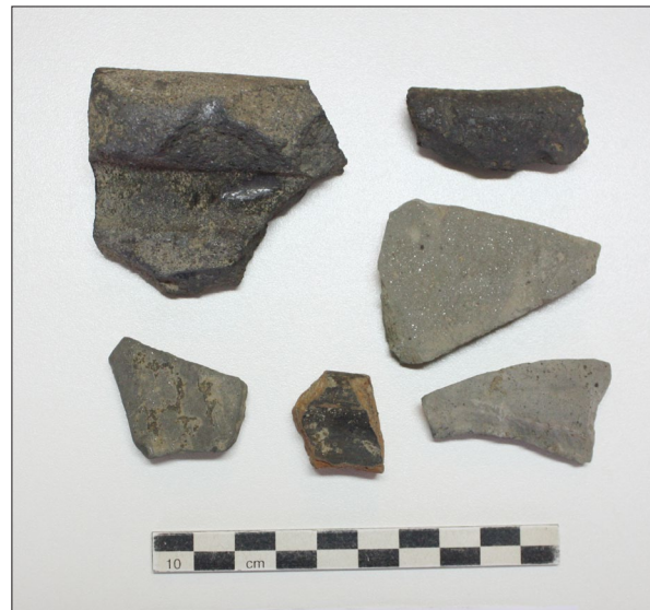
Sl. 3. Marjanski Ivanovci-Žagrovac – Rimska keramika

Fig. 1 Marjanski Ivanovci-Žagrovac – The fragment of bronze artefact