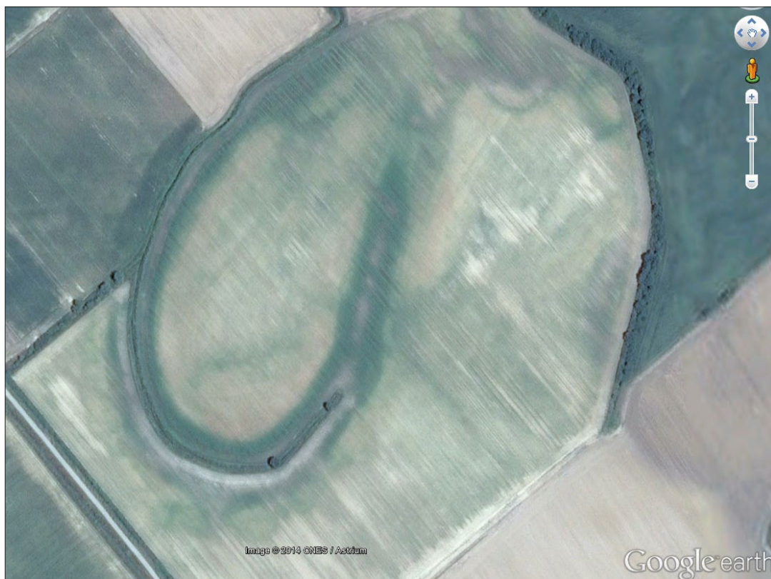
Sl. 11. Bocanjevci-Pašnik (2) (prema Google Earth).