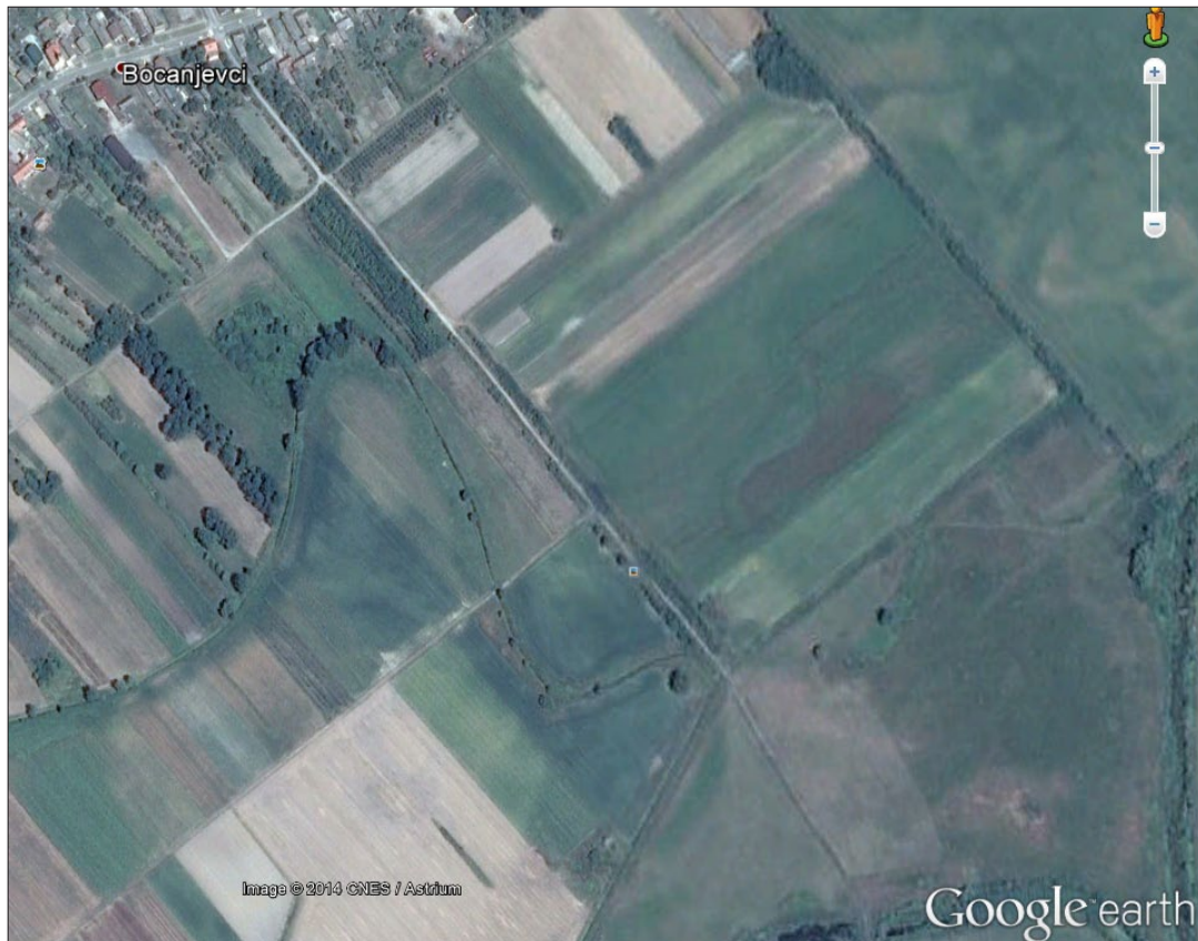
Sl. 10. Bocanjevci-Otok (1).