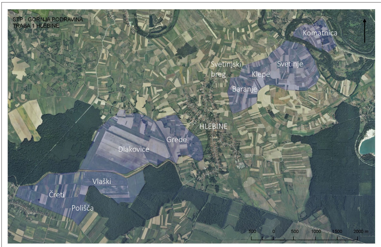
Sl. 1 Prikaz Trase 1 – HLEBINE (izradila: F. Sirovica).