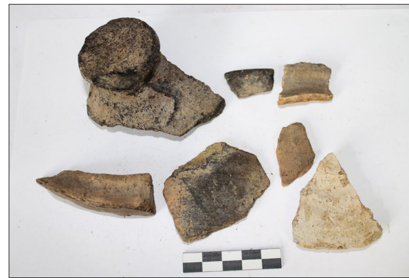
Sl. 13 Ulomci ranonovovjekovne keramike s nalazišta Festinec Dolovje.

Fig. 10 Fragments of late medieval and early modern age pottery from Špiranec Lovasovica 1.