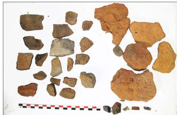
Sl. 7 Ulomci lasinjske keramike s nalazišta Špiranec Lovasovica 1.

Fig. 4 Fragments of Late Bronze Age pottery from Špiranec Žitište 1.