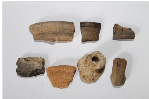
Sl. 12 Ulomci novovjekovne keramike s nalazišta Pokasin Lovrentovica.

Fig. 9 Fragments of medieval pottery from Špiranec Lovasovica 2.