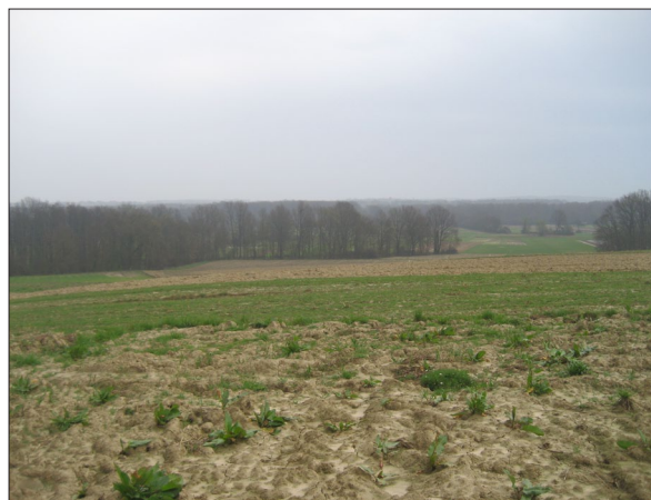
Sl. 2 Položaj Špiranec Žitište, pogled prema dolini Glogovnice.

U dolini uz potok Petrovinec i nizini koja se pruža uz Glogovnicu otkriveni su novovjekovni lokaliteti Pokasin – Tornjine te Festinec Topolje i Festinec Dolovje na području Zagre-