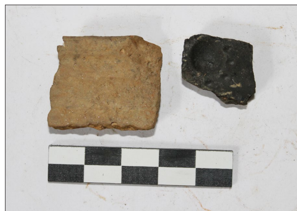
Sl. 8 Ulomci stariježeleznodobne keramike s nalazišta Špiranec Lovasovica 2.

Fig. 5 Fragments of late medieval and early modern age pottery from Špiranec Žitište 3.