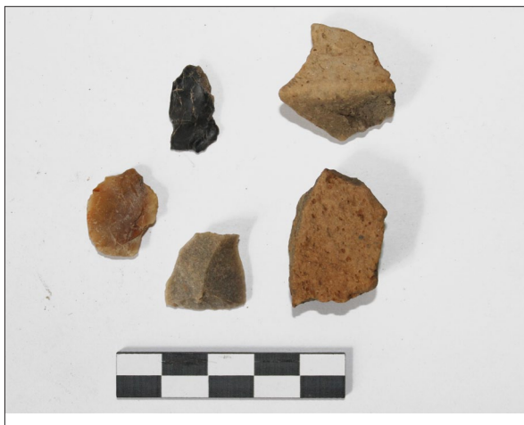
Sl. 11 Ulomci lasinjske keramike i litike s nalazišta Pokasin Lovrentovica.

Fig. 13 Fragments of early modern age pottery from Festinec Dolovje.