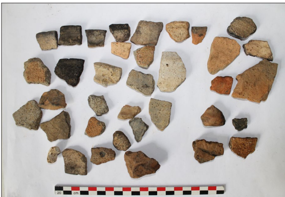
Sl. 10 Ulomci kasnosrednjovjekovne i ranonovovjekovne keramike s nalazišta Špiranec Lovasovica 1.

Fig. 12 Fragments of modern age pottery from Pokasin-Lovrentovica.