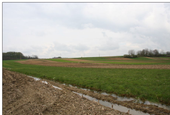
Sl. 6 Položaj Špiranec Lovasovica.

Fig. 3 Fragments of Sopot pottery from Špiranec Žitište 2.