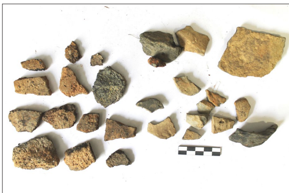
Sl. 3 Ulomci sopotske keramike s nalazišta Špiranec Žitište 2.

Fig. 3 Fragments of Sopot pottery from Špiranec Žitište 2.