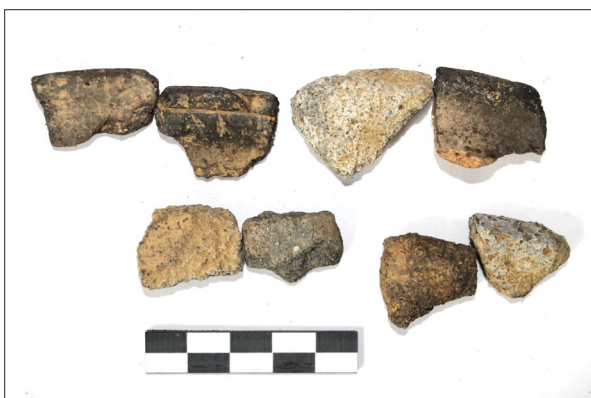
Sl. 5 Ulomci kasnosrednjovjekovne i ranonovovjekovne keramike s nalazišta Špiranec Žitište 3.

Fig. 7 Fragments of Lasinja pottery from Špiranec Lovasovica 1.