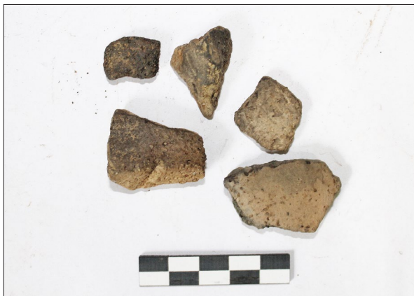
Sl. 4 Ulomci kasnobrončanodobne keramike s nalazišta Špiranec Žitište 1 (snimila: T. Tkalčec).

Fig. 6 Špiranec Lovasovica location (photo by: T. Tkalčec).