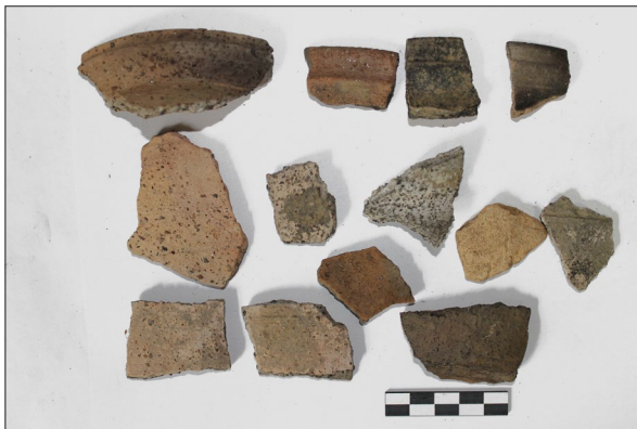
Sl. 9 Ulomci srednjovjekovne keramike s nalazišta Špiranec Lovasovica 2.

Fig. 9 Fragments of medieval pottery from Špiranec Lovasovica 2.