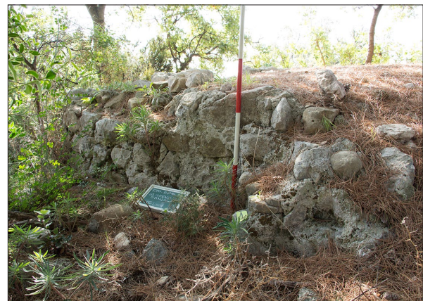
Sl. 4 Lokalitet 75 – apside i sjeverni zid crkve sv. Marka (Banjol).

Dragi (LOK 71), koji se uglavnom tek naziru ispod bujnoga vegetacijskog pokrova (sl. 3), a mogla bi biti riječ o ostacima koje spominje B. Nedved (Nedved 1990: 27). Nedaleko od ruševina crkve sv. Marka u Banjolu (LOK 75), unutar manje gromače, uočeni su ostaci zidane strukture te nalazi koji također