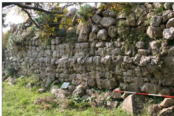
Sl. 1 Lokalitet 70, struktura 1 – elevacija zida od lomljenaca vezanih žbukom na kojeg je „dograđen“ suhozid (snimila: A. Konestra).

Kao novevidentirani lokaliteti svakako se ističu LOK 70 (sv. Anastazije – Za Markovićem) na kojem je utvrđena zidna struktura koja je u svom donjem dijelu građena od lomljenaca