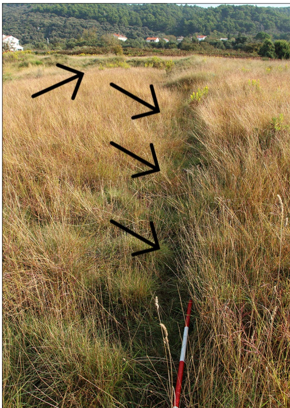
Sl. 3 Lokalitet 71 – obrisi struktura koje se naziru ispod vegetacije.