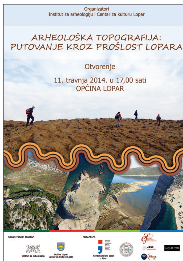
Sl. 6 Plakat izložbe „Arheološka topografija: putovanje kroz prošlost Lopara“ (izradio: E. Matahlija).

Suradnjom Instituta za arheologiju, Centra za kulturu i Općine Lopar, te brojnih vanjskih suradnika, u travnju 2014. godine postavljena je u prostorima Općine i javnosti predstavljena izložba Arheološka topografija: putovanje kroz prošlost Lopara autorica G. Lipovac Vrkljan i A. Konestre (sl. 6). 4 Na više panoa na kojima su tekstom i fotografijama predstavljena prapovijesna i povijesna razdoblja čiji se nalazi javljaju na Loparu, ali i nalazima iz privatnih zbirki te s arheoloških istraživanja, pokušalo se široj javnosti predstaviti prošlost Lopara i senzibilizirati kako lokalno stanovništvo tako i njihove goste za ovaj aspekt kulturne