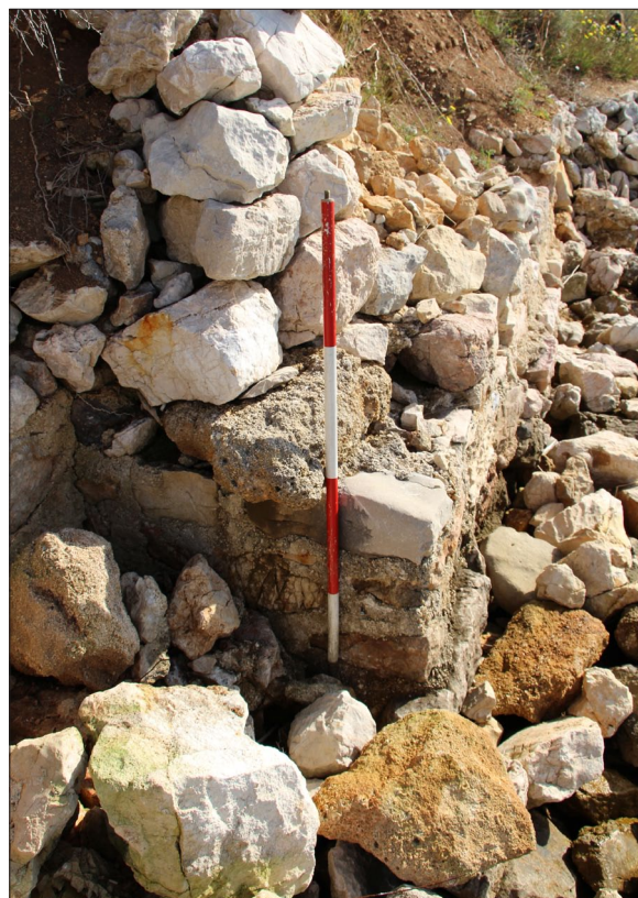
Sl. 2 Lokalitet 76 – antički zid na žalu uvala Valmartine.

Većim gospodarsko-rezidencijalnim kompleksima vjerojatno pripadaju i dva lokaliteta identificirana uz samu morsku obalu na području Barbata: LOK 74 – Mirine, i LOK 76 – Valmartina. Na potonjem su, osim evidentiranja zidanih struktura (sl. 2), prikupljeni i nalazi koji upućuju na kasnoantičku dataciju, a nedaleko od ovih lokaliteta, na lokalitetu Pudarica (LOK 77), zamijećeni su i grobovi istovjetne datacije. Na sličan bismo način mogli interpretirati i tragove arhitekture zamijećene istočno od crkveno-samostanskog kompleksa sv. Petra u Supetarskom