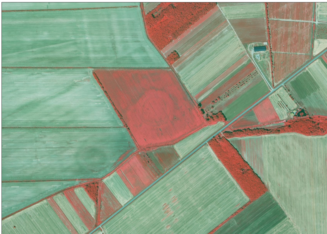
Sl. 8 Vrbica, Drake, vertikalna near-infrared snimka DGU.