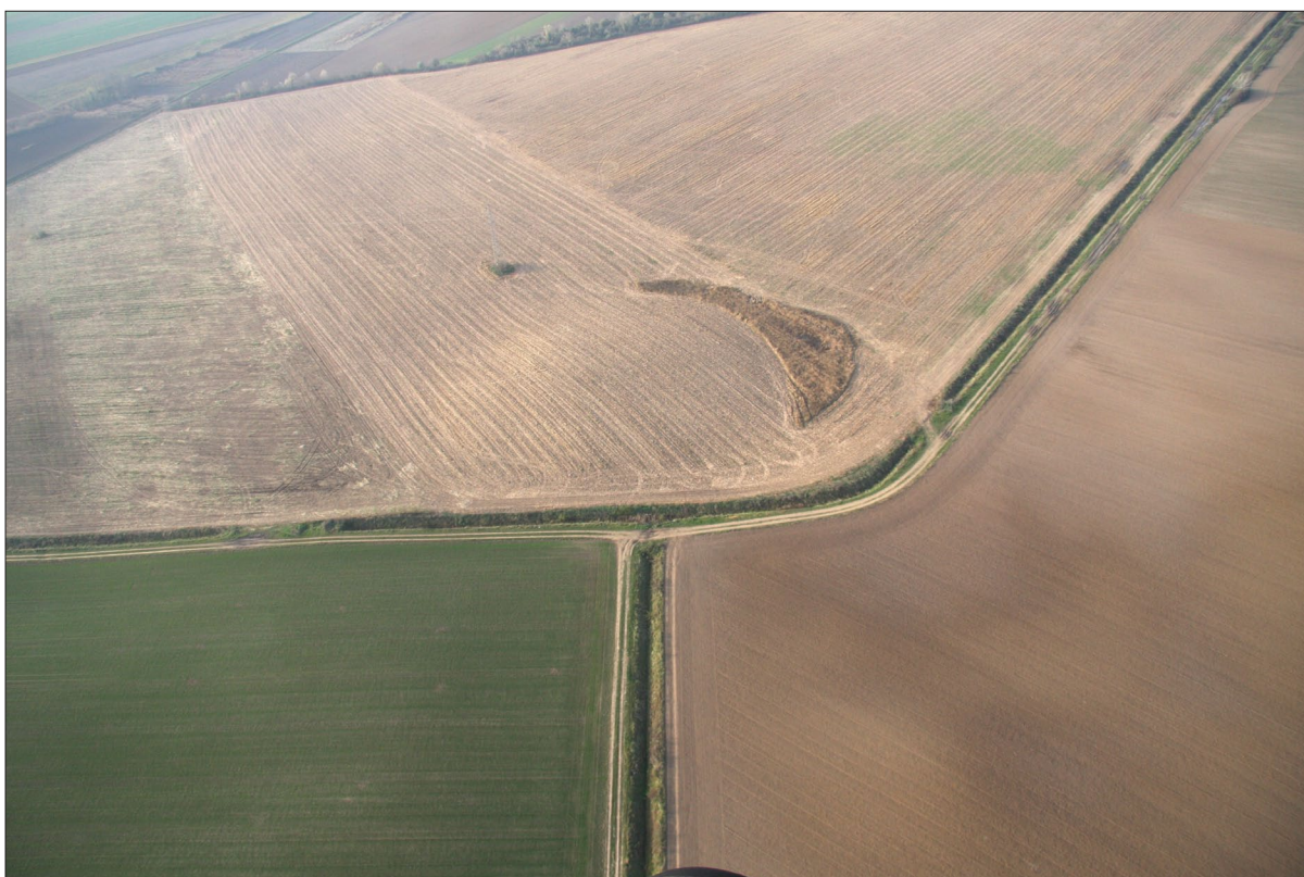
Sl. 4 Vučevci, Lještica.