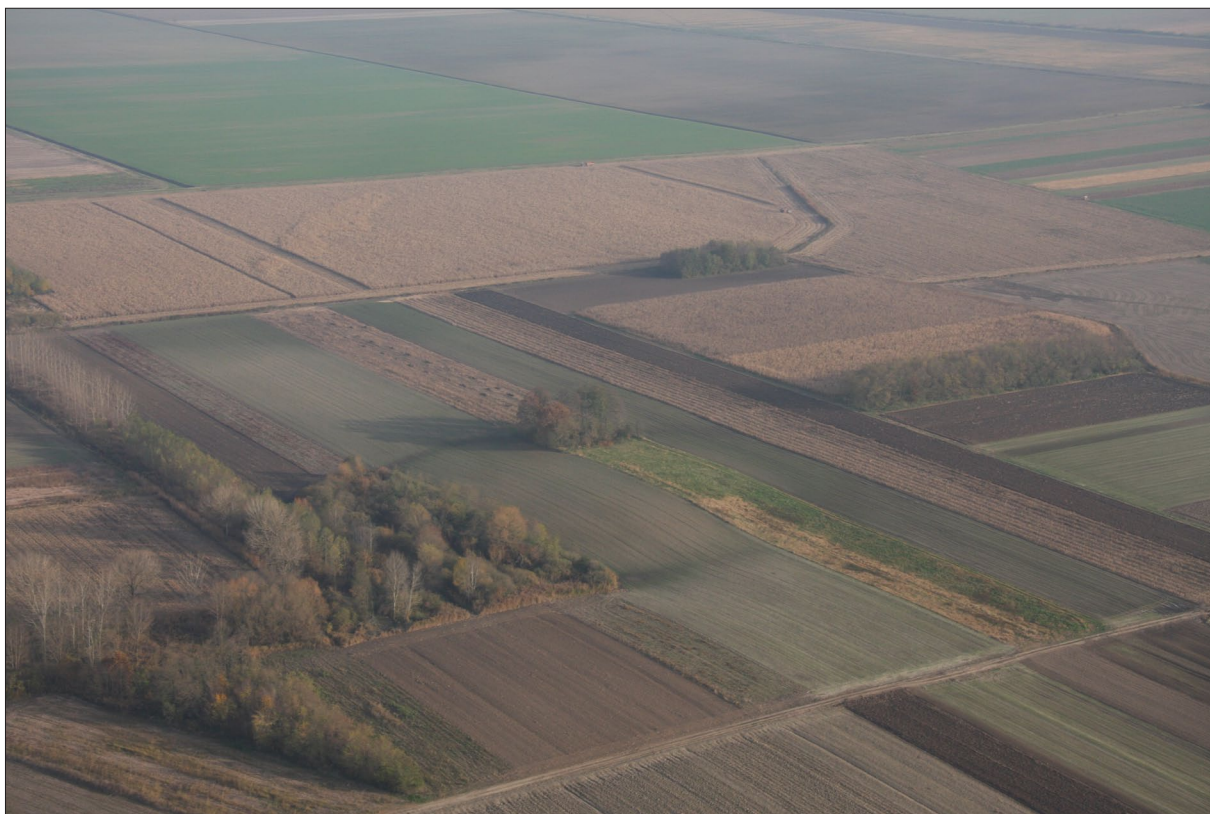
Sl. 9 Kešinci, Glomač – Požarike.

Fig. 9 Kešinci, Glomač – Požarike.