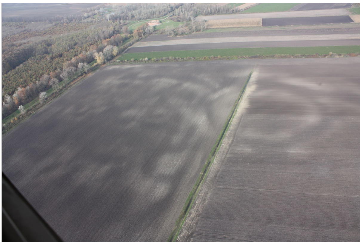
Sl. 2 Ivanovac, Kolodvar, kosa snimka.

Fig. 1 Klisa, zračna luka, Google Earth images, 24. 03. 2006.; 24. 04. 2006.; 31. 07. 2013. and vertical near-infrared image of State Geodetic Administration.