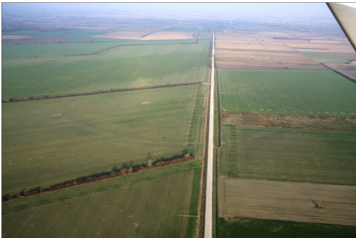
Sl. 10 Markušica, Novoševci.

Fig. 9 Kešinci, Glomač – Požarike.