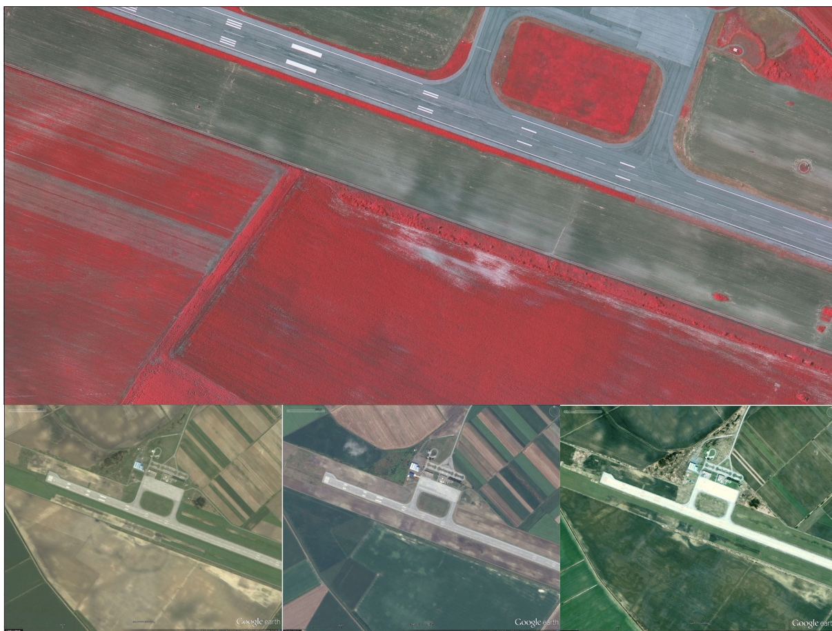
Sl. 1 Klisa, zračna luka, snimke Google Earth, 24. 3. 2006., 24. 4. 2006., 31. 7. 2013. i vertikalna near-infrared snimka DGU.

Fig. 1 Klisa, zračna luka, Google Earth images, 24. 03. 2006.; 24. 04. 2006.; 31. 07. 2013. and vertical near-infrared image of State Geodetic Administration.