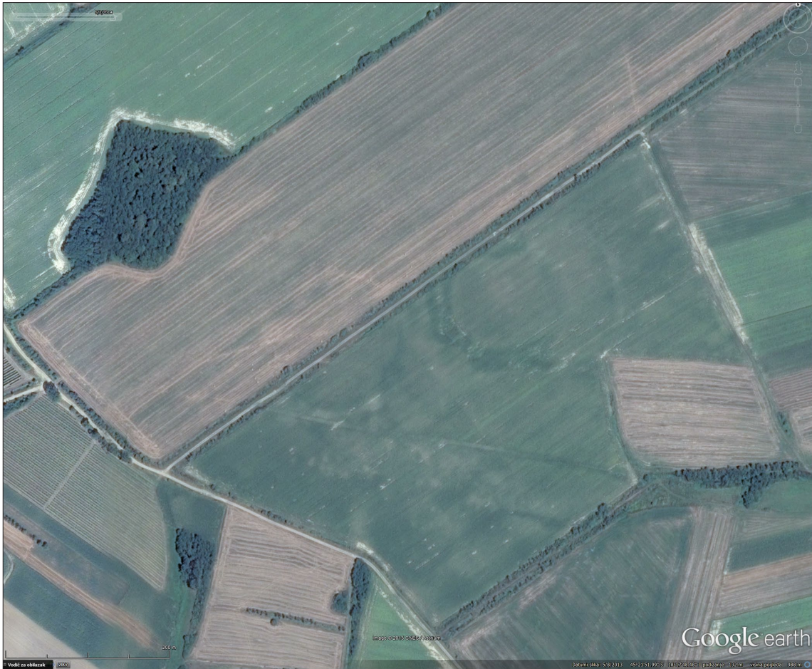
Sl. 7 Preslatinci, Ugljare, 5. 8. 2013.