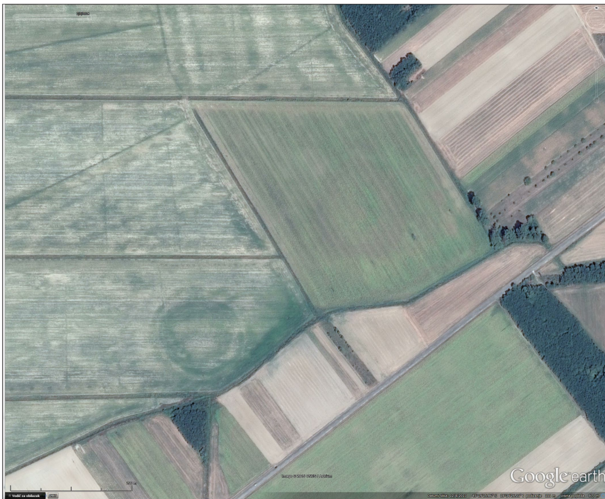
Sl. 3 Vrbica, Drake, snimka Google Earth 12. 8. 2013.