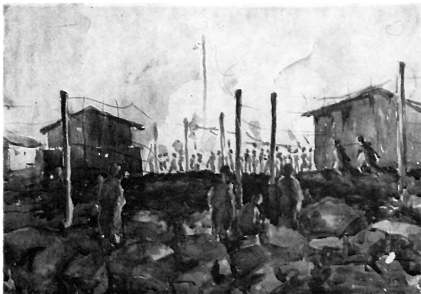
8 Cvetko Radović, Bombardovanje logora u Nürnbergu

Aber nicht wegen einer kleineren Fähigkeit des Autors, sondern wegen der verringerten Möglichkeiten des Bildens sehr breit aufgefasst — vor allem aus psychologischen Gründen, jedenfalls auch wegen der sehr dürftigen Möglichkeiten. In dieser zweiten Hinsicht war die Situation des Kriegsgefangenen etwas besser und von der Technik in Farbe können auch Arbeiten in Öl, neben Tempera und Aquarell,