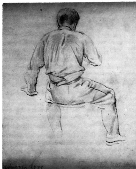
4 Pavle Vasić, Zarobljenik u Aversi