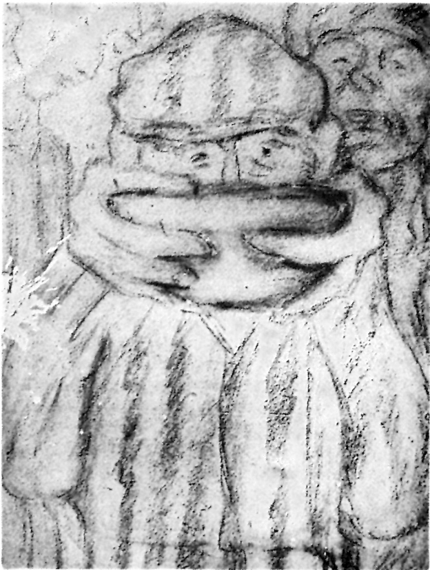
1 Miloš Bajić, Posljednji ručak — logor Mauthausen