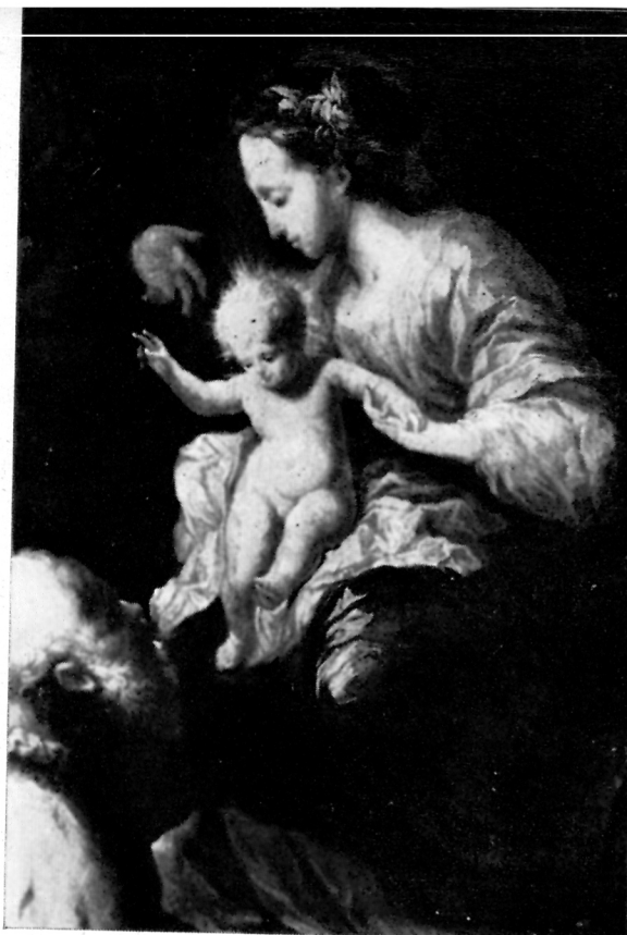
Valerio Castello: Poklonstvo kraljeva , galerija »Benko Horvat«, Zagreb, total i detalji