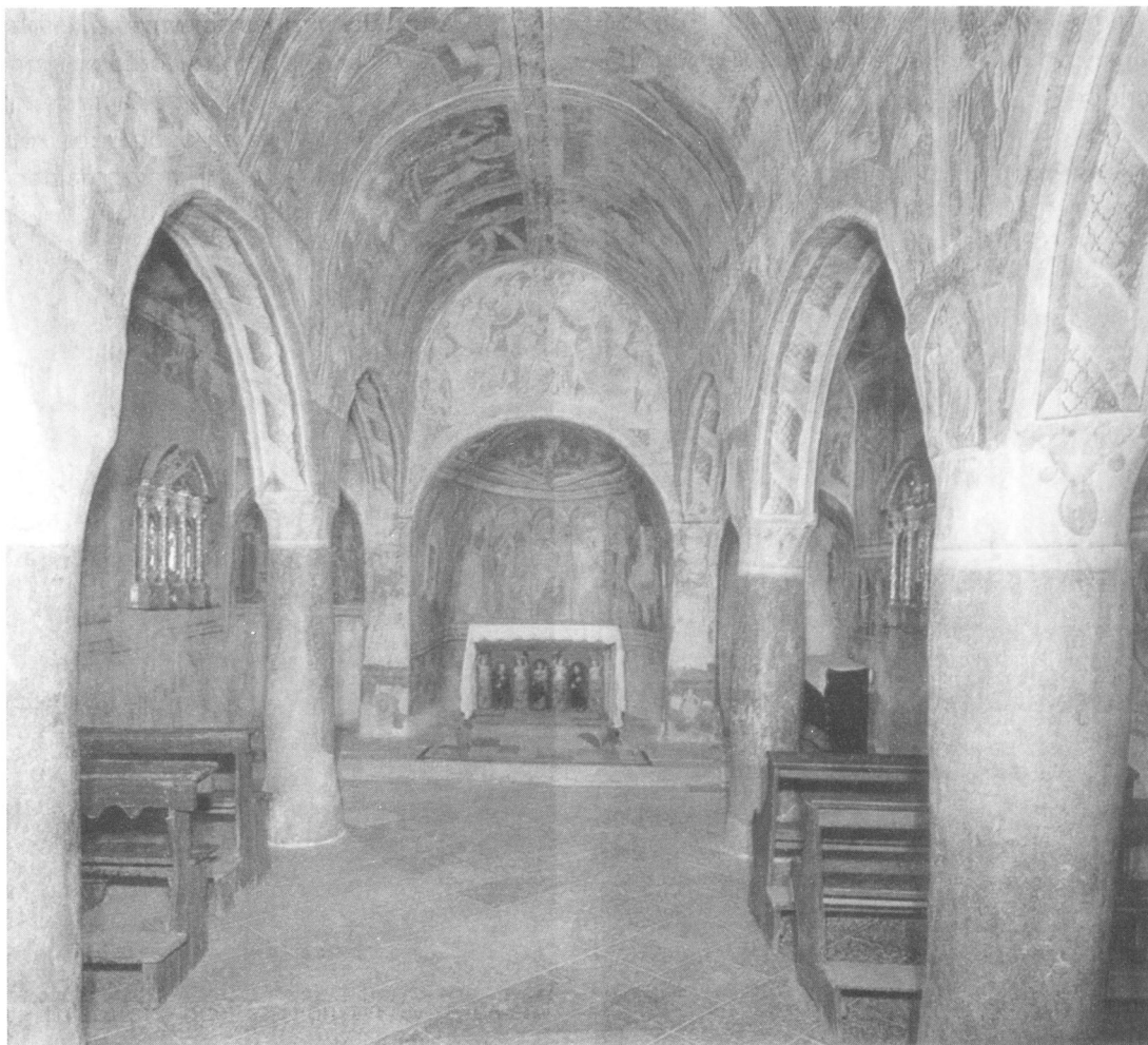
1. Crkva sv. Trojstva, Hrastovlje, 1473/1490., unutrašnjost