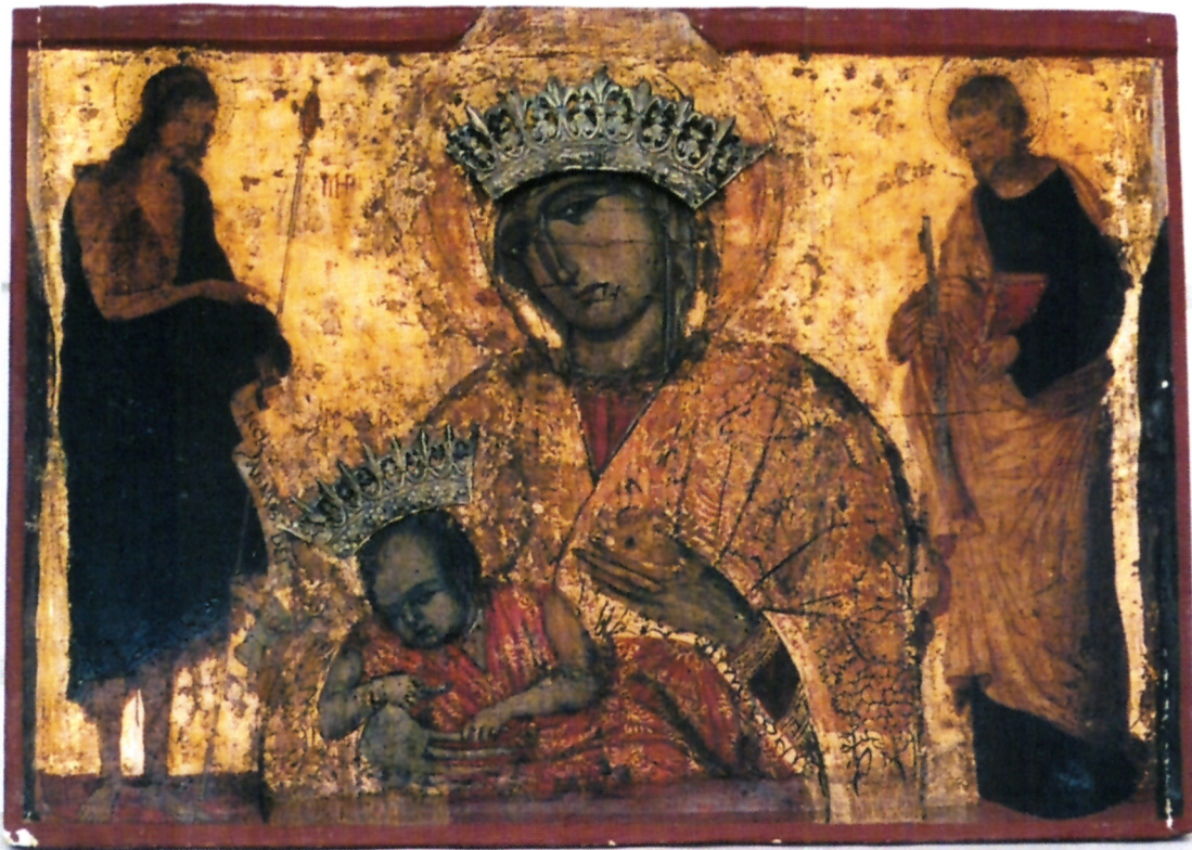
Slika Bogorodice s Kristom, sv. Ivanom Krstiteljom i sv. Petrom (XIV. i 1513.godina) iz Crkve sv. Nikole na Prijekome

se iskucan lik Bogorodice s Kristom u naručju, lošije modelacije od hijeratskog lika sv. Nikole. Matrica po kojoj je iskovana vrpca uokolo ruba okova matrikule vrlo je česta na sačuvanim moćnicima u Dubrovniku i Kotoru. Tako ju na primjer susrećemo na moćnicima 14. stoljeća u dubrovačkom prvostolnom Moćniku – na moćnicima broj: IX (moćnik noge sv. Petilovrijeňa), XXVIII (moćnik ruke sv. Fuske), XXIX (moćnik ruke sv. Domicile), XL (moćnik ruke sv. Julijane), XLVI (moćnik ruke sv. Savina), XLIII (moćnik