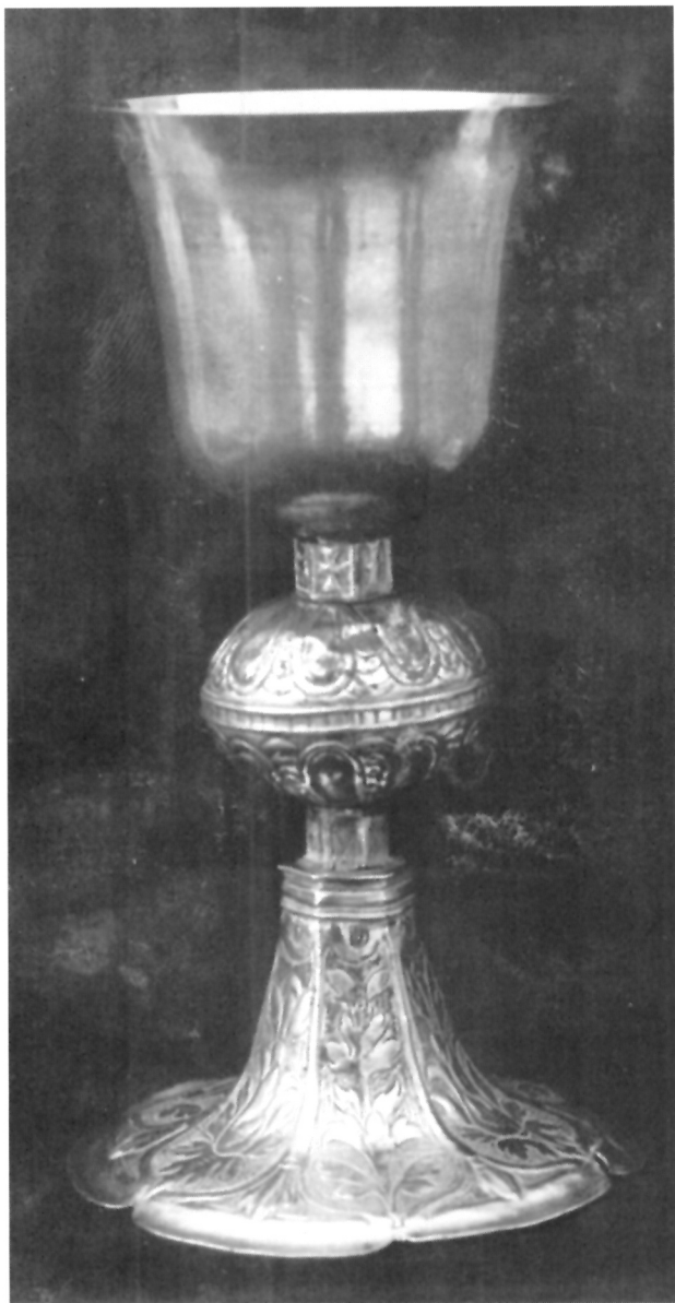
Renesansni kalež iz Crkve Imena Isusova u Stonu, nepoznati dubrovački majstor iz XVI. stoljeća

osnovi arhaizirajućih elemenata i jednostavno tretirane baze približiti nepoznatom dubrovačkom zlataru dva ranije spomenuta kaleža iz Dubrovnika i Stona iz istoga tog vremena. Radilo se o majstoru skromnih mogućnosti, ali koji je raspolagao osnovnim fondom tehničkih i estetskih znanja.