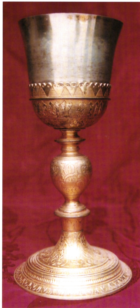
Renesansni kalež iz župne crkve sv. Vlaha u Stonu, XVI. st., nepoznati dubrovački majstor

Dubrovački okov kasniji jedno i pol stoljeće naredna je faza u razvoju ove kategorije liturgijskih predmeta dubrovačkoga zlatarstva. Vremenski blizak (kasno 15. stoljeće) našem dubrovačkom primjeru jedino je okov Gospe od Otoka (Badija), ali mnogo je lošije likovne kakvoće. 23 Dubrovački okov Bogorodice iz Sv. Nikole na Prijekome u kontekstu hrvatskoga renesansnog zlatarstva zauzima posebno mjesto, jer je on znatno stariji od okova Gospe od Varoša (1564.) u Zadru – djelo zadarskih zlatara Mateja i Luke Boričevića – i zasad je najstariji potpisani primjer ove kategorije liturgijskih predmeta izradene od plemenitih