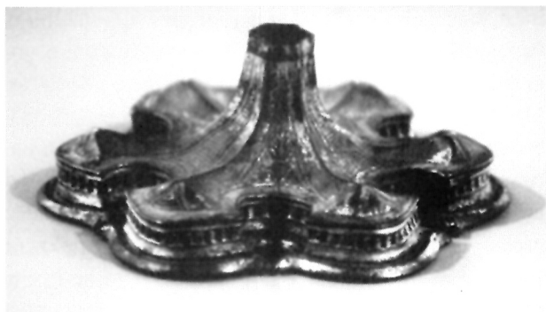
Baza gotičkog kaleža iz Crkve sv. Mihovila u Vignju

baza kasnije barokne pokaznice – djelo dubrovačkoga zlatara iz 18. stoljeća Pava Pecera – iz Crkve Gospe Luncijate u Stonskom Polju. 16 Na kraju možemo utvrditi da je gotička baza propaloga kaleža iz Vignja na Pelješcu zasada najstariji poznati import iz napuljskih zlatarskih radionica gotičkoga stilskog izraza.