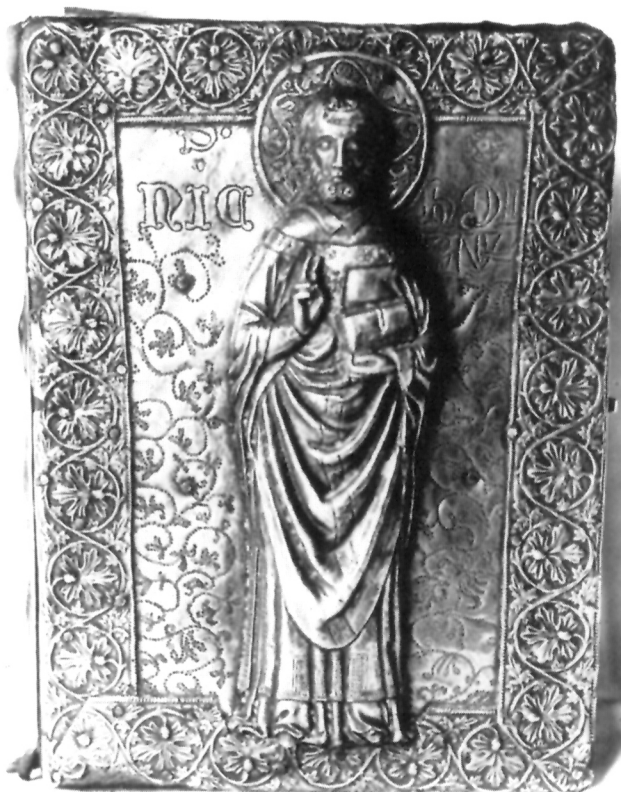
Okov matrikule Bratovštine mesara – sv. Nikole iz crkve sv. Nikole na Prijekome