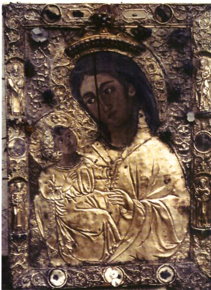
Okov Gospe od Jezera, nepoznati dubrovački majstor, posljednja četvrtina XIV. st.

je 1392.–1393. zlatar Caolo Caorli, koji je radio i u Dubrovniku. 13 Kotorski zlatar Radivoje izradio je 1363. srebrnu ikonu za Baziliku sv. Nikole u Bariju, a dubrovačka plemkinja Ana Lukarević daruje istoj bazilici srebrni ex-voto u obliku jaganjca. 14