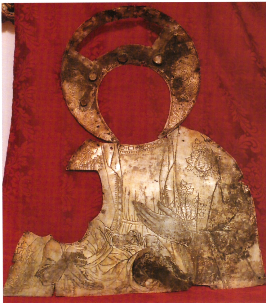
Srebrni okov Bogorodice s Kristom iz crkve sv. Nikole na Prijekome, djelo dubrovačkog zlatara Marka iz 1515. godine

1371. godine ostavio novac, djelo je istoga nepoznatog dubrovačkog zlatara iz vremena najvećeg prosperiteta dubrovačkih zlatarskih radionica, a tu tvrdnju potvrđuju jednake srebrne pozlaćene vrpce na ovom moćniku i na okovu matrikule. Okov matrikule iz Sv. Nikole pomogao nam je u čvršćoj dataciji veće grupe umjetnina iz Dubrovačke prvostolnice.