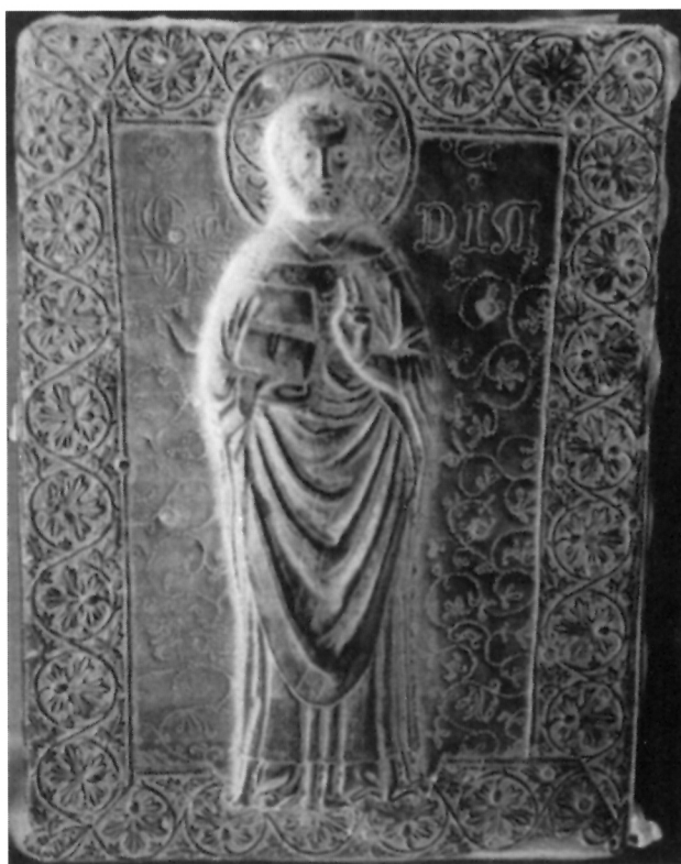
Stakleni negativ XIX./XX. st. matrikule Bratovštine mesara – sv. Nikole iz crkve sv. Nikole na Prijekome

Do danas su na bivšem području Dubrovačke Republike ostala fragmentarno sačuvana svega dva stara okova knjiga od plemenitih kovina iz dubrovačkih radionica, i to: djelomično sačuvan okov prvostolnoga misala iz sredine 16. stoljeća u Stonu i lik sv. Ivana s Lopuda, koji se nalazio kao ukras na jednom knjižnom okovu, a koji se čuva u Kneževu Dvoru. 3 Do 19. stoljeća vjerojatno se na području Dubrovačke Republike nalazio veći broj knjiga okovanih u srebro, pa tako danas na matrikulama Bratovštine sv. Lazara i Bratovštine sv. Antuna, koje se čuvaju u Državnom arhivu u Dubrovniku, nalazimo tragove srebrne opreme. U matrikuli Bratovštine sv. Lazara na stranici 85. nalazi se popis srebra Bratovštine iz 1628. godine, gdje se na prvome mjestu spominje: "(...) Matricola con tavole di argento figurate (...)", a na sljedećoj stranici matrikule nalazi se popis iz ožujka 1652. godine, gdje se spominje: "(...) Una Matricola con Statuete, e piastre di Argento (...)" 4