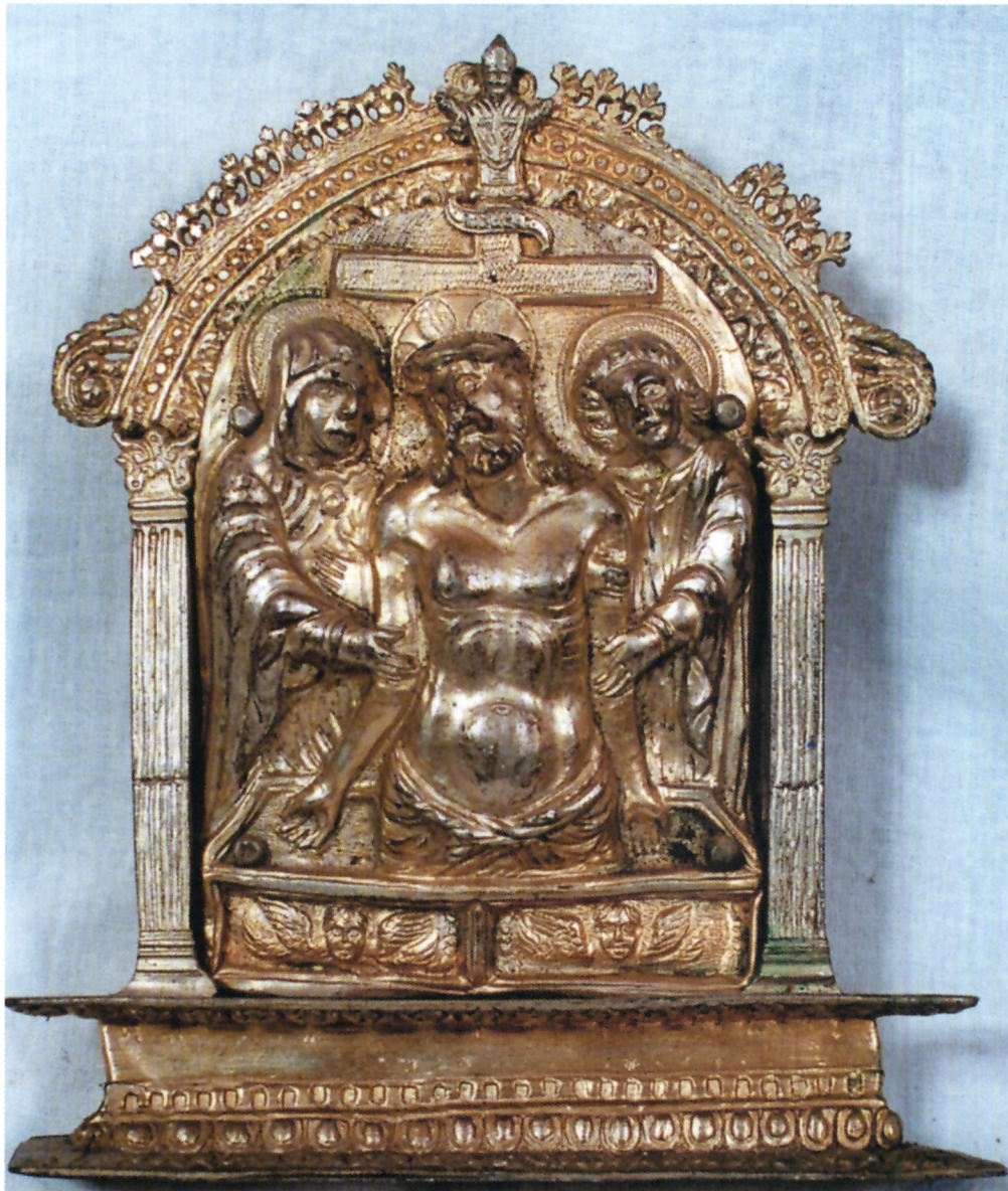
Renesansni pax iz dubrovačke Crkve sv. Vlaha, nepoznati dubrovački majstor XVI. stoljeće

u apostolskoj vizitaciji Giovannija Francesca Sormana 1575. godine: “(...) Item pax tecum argentea (...)”. 39 Autor je u jednom ranijem radu obradio srebrni kotlić za blagoslovljenu vodu iz sakristije Kolegijalne crkve sv. Vlaha. 40