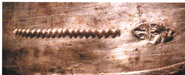
Bris čistoće srebra i državni zlatarski žig Dubrovačke Republike iz XVI. stoljeća na renesansnom kaležu iz Crkve Gospe od Karmena u Dubrovniku