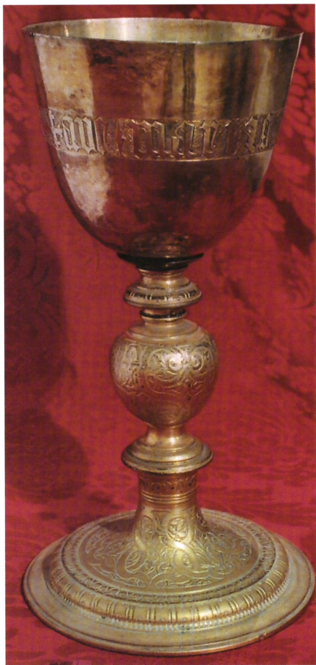
Renesansni kalež iz dubrovačke Crkve Gospe od Karmena, XVI. st., nepoznati dubrovački majstor

Natpis s renesansnog kaleža iz dubrovačke crkve Gospe od Karmena