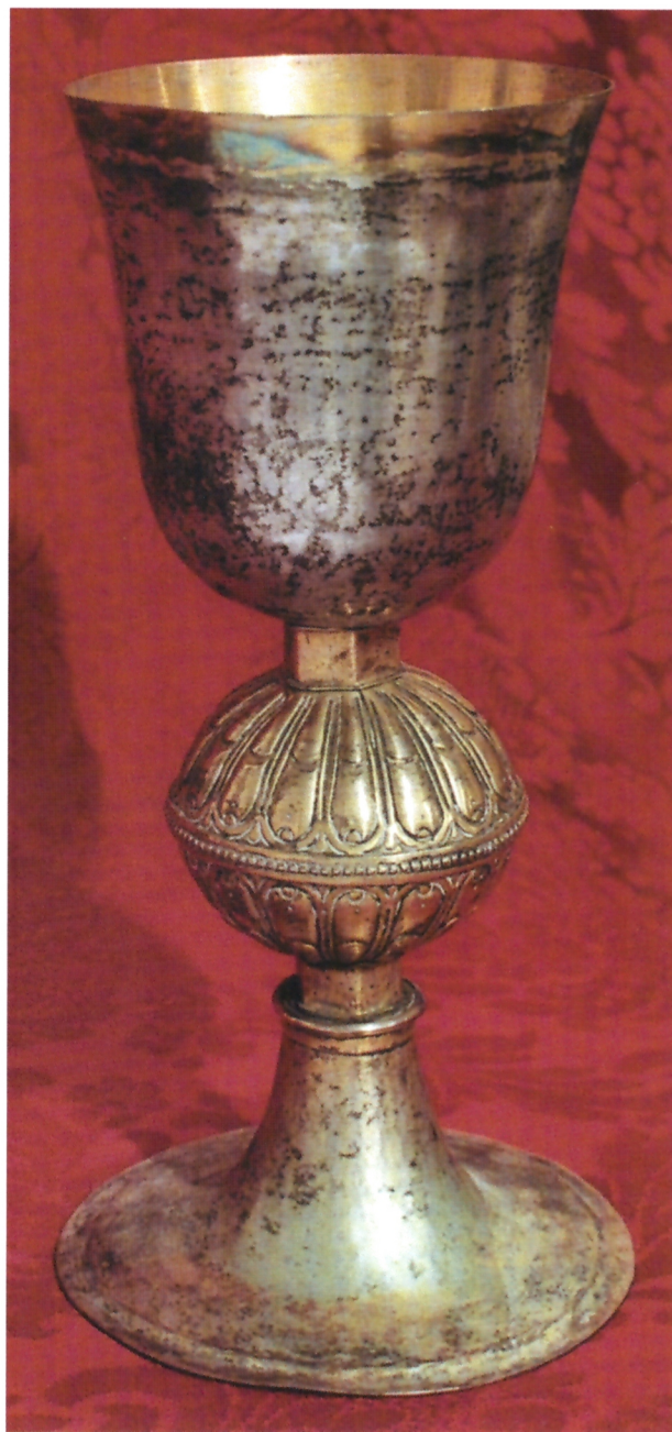
Renesansni kalež iz dubrovačke Crkve Gospe od Karmena, XVI. st, nepoznati dubrovački majstor

U Crkvi Imena Isusova u Stonu čuva se kalež blago svedene baze, ukrašene mekano tretiranim biljnim ornamentom, za razliku od dubrovačkoga primjera posve glatke baze. Na među članovima se nalazi natpis: "JESUS+", pisan gotičkim slovima. Baza kaleža je, poput dubrovačkoga kaleža, providena državnim žigom (stiliziranom zbijenom glavom sv. Vlaha) Dubrovačke Republike iz 16. stoljeća, a novija čaška utisnutim žigom nepoznatoga dubrovačkog zlatara "FO", koji je po Ivi Lentiću djelovao na prijelazu 17. u 18. stoljeće 31 . On je na Pelješcu izradio više kaleža, ali već posve baroknih formi. 32 Ladicica za tamjan stonskog biskupa Tome Crijevića (1541.–1555.), jednostavne renesansne forme s odmjerenim ukrasom, danas je dio izgubljena kompleta iz Stonske prvostolnice. Na osnovi komparacije sa sličnim ladicama iz Franjevačkog samostana Male braće u Dubrovniku, providenima dubrovačkim žigom, valja je pripisati nepoznatom dubrovačkom zlataru koji je djelovao četrdesetih godina 16. stoljeća. 33 Isto tako bi valjalo na