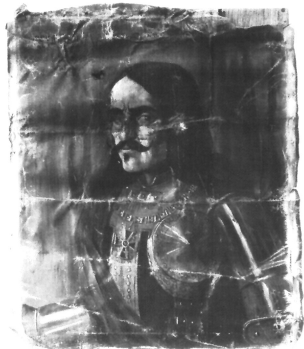
Nepoznati slikar, Portret Marka Sinovčića , Split, privatno vlasništvo(?)