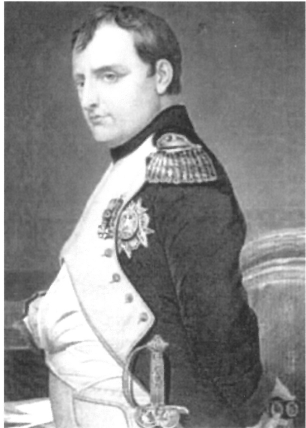
Paul Delaroche (Pariz, 1797.–1856.), Portret Napoleona Bonapartea

Pred nama je capriccio na kojemu slikar proizvoljno kolažira različite povijesne i imaginarne građevine u jedinstvenu cjelinu koja nije realna. Među Zečevićevim zadarskim djelima capriccio i portret kapetana Marka Sinovčića likovno su najmanje vrijedni. Oba djela nisu potpisana, ali u Zečevićevo autorstvo ne bi trebalo sumnjati: ona zapravo potvrđuju činjenicu da slikar nije bio primjereno obrazovan, pa je amaterska crta na tim djelima jače izražena. Na portretima svojih suvremenika i uglednih ličnosti iz dalmatinske prošlosti sačuvanim u Zadru pokazao je talent i vještinu kojom je uspio predočiti ne samo njihove tjelesne odlike nego i psihološke osobine. Ako se Zečević usporedi s djelima njegovih splitskih suvremenika, posebno pak s Jurjem Pavlovićem, onda se mora zaključiti da Zečević