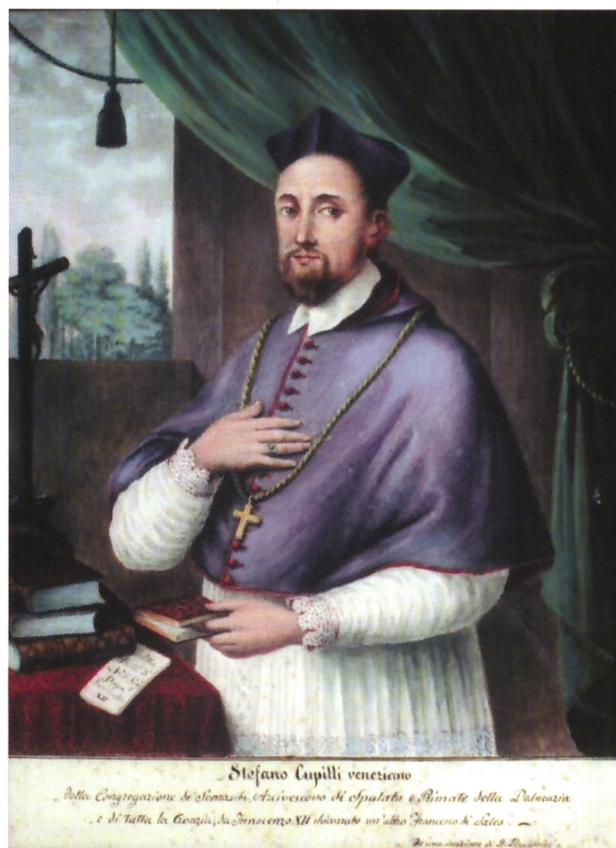
Petar Zečević, Portret splitskog nadbiskupa Stjepana Cupillija , Zadar, Kaptolski arhiv

Razlika je očita i u oblikovanju krajolika: na grafici je to veduta grada (možda simboličan prikaz utvrdenoga Splita), a na Zečevićevu akvarelu to je šumarak zazeljenjelih stabala.