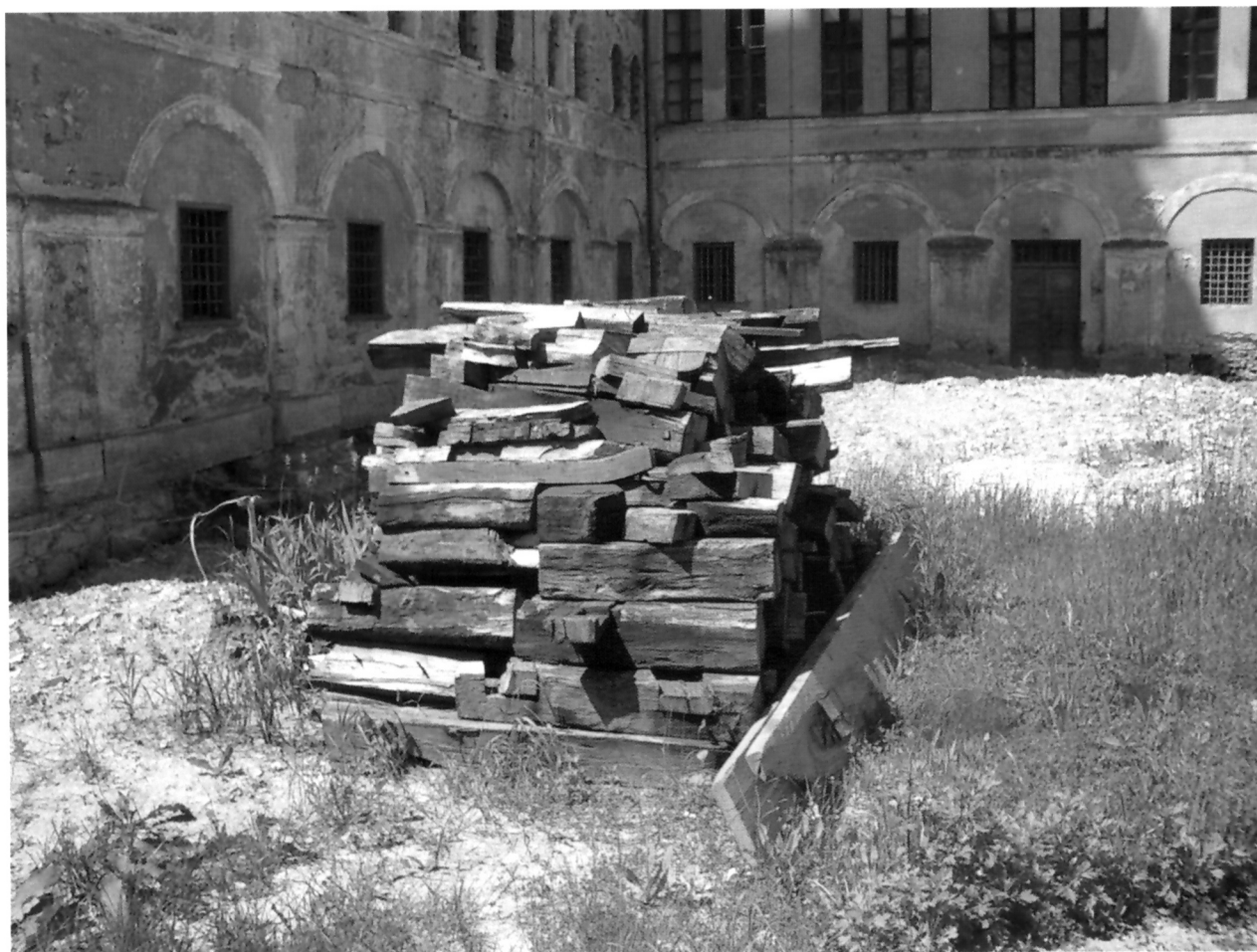
Ispiljena grada satnog mehanizma