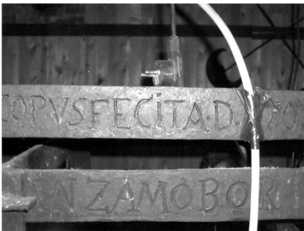
Dijelovi satnog mehanizma