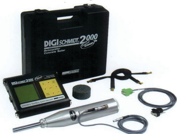
Slika 4. Digitalni sklerometar tipa Digi Schmidt (broj ND -1-2983-1234) proizvođača Proceq iz Švicarske

Jedna od najčešćih nerazornih metoda koja se koristi kod utvrđivanja kvalitete betona u konstrukciji jest sklerometar. Ispitivanje se provodi prema normi HRN EN 12504-2. Sklerometrom (Slika 4) mjeri se indeks odskoka igle sklerometra, a koji ovisi o površinskoj tvrdoći betona. Moguće je ispitivati i vertikalne i horizontalne plohe kao i one nagnute pod nekim kutom.