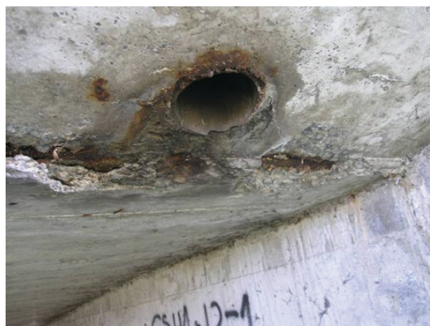
Slika 1. Detalj oko odvodnje sjevernog mosta, prisutna korozija armature i odlamanje zaštitnog sloja betona

Na temelju vizualnog pregleda određuju se mjesta na konstrukciji gdje će se provoditi detaljna ispitivanja betona i armature, a koja uključuju ispitivanja s razaranjem i bez razaranja. Ta detaljna ispitivanja, pogotovo nerazorna u pravilu se ne rade na površinama betona koja su svrstana u 3, 4 i 5 kategoriju oštećenja jer su to mjesta gdje je vizualnim pregledom utvrđeno da je potreban popravak konstrukcije na tim mjestima. Na Slikama 1 i 2 prikazana su tipična oštećenja AB - konstrukcije mosta koja se prepoznaju u vizualnom pregledu.