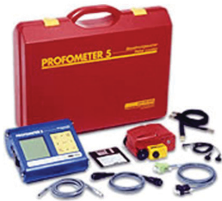
Slika 5. Tragač armature tipa Profometer 5, proizvođača Proceq

Za određivanje položaja armature u betonu, kao i debljine zaštitnog sloja betona do armature koristi se uređaj tragač armature (slika 5). Tragačem armature moguće je odrediti razmak između šipki armature te međusobni položaj horizontalne i vertikalne armature u elementu betonske konstrukcije.