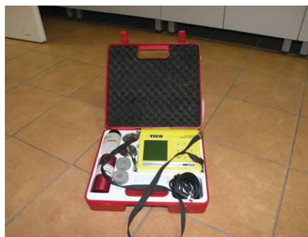
Slika 4. Ultrazvučni uređaj tipa Tico

Određivanje homogenosti ugrađenog betona i određivanje dubine pukotina u betonu provodi se mjerenjem brzine prolaska ultrazvučnog vala kroz beton sukladno normi HRN EN 12504-4:2004. Na Slici 5 prikazan je ultrazvučni uređaj tipa Tico proizvođača Proceq iz Švicarske za mjerenje vremena prolaska vala kroz beton