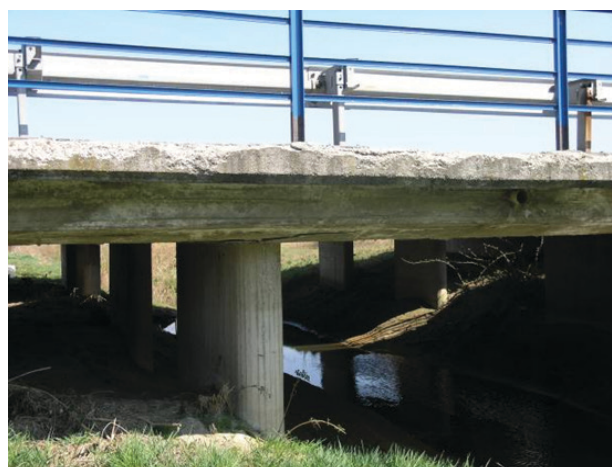
Slika 2. Oštećenja pješačke staze i vijenca na mostu

Za obavljanje vizualnog pregleda konstrukcija često je potrebno koristiti različite dizalice, pomične platforme ili specijalna vozila kojima bi se omogućio pristup svim mjestima na konstrukciji. Na Slici 3 prikazano je specijalno vozilo Barin kakvo imaju Hrvatske ceste d.o.o. za potrebe pregleda mostova. Faze u provedbi vizualnog pregleda: zahtjev za provedbu vizualnog pregleda, definiranje radnog zadatka, priređivanje podloga za provedbu pregleda, provedba pregleda, obrada rezultata vizualnog pregleda, izrada izvješća s ocjenom stanja objekta, arhiviranje dokumentacije i predaja izvještaja naručitelju.