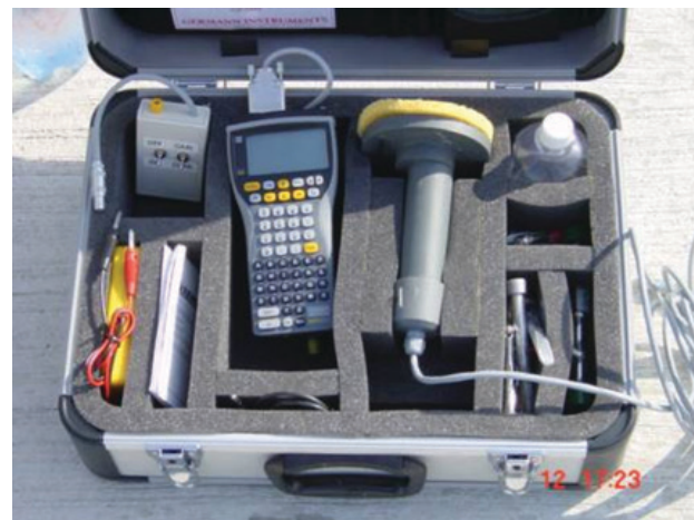
Slika 6. Uređaj GalvaPulse

U sklopu korozijskog monitoringa i ispitivanja stanja armature provode se ispitivanja polučelijastog potencijala ( E , mV), gustoće korozijske struje ( i_{\text{corr}} , \mu\text{A}/\text{cm}^2 ) i električnog otpora betona ( R , \text{k}\Omega ). Uređaj za provođenje galvanostatičke impulsne metode je GalvaPulse, proizvođača Germann Instruments iz Danske (Slika 6).