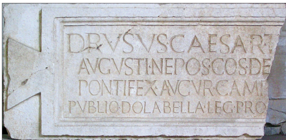
SLIKA 4. Natpis o munificijenci Druza Mladeg s Visa (Arheološki muzej u Splitu, snimio Ž. Miletić).