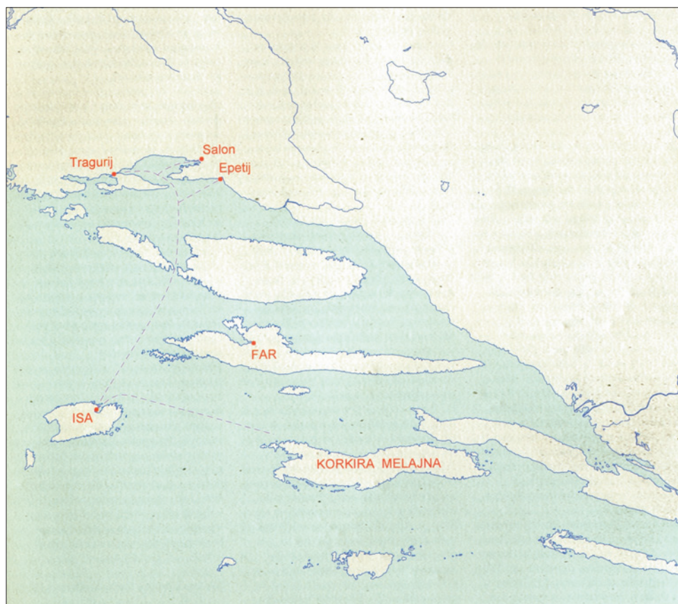
SLIKA 1. Položaj i veze Ise u odnosu na druge otoke i kopno na istočnoj obali Jadrana (preuzeto iz S. Čače – B. Kuntić-Makvić, 2010.).