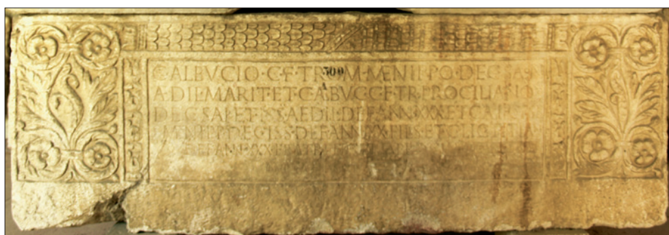
SLIKA 5. Natpis na sarkofagu obitelji Albucija pronađen u Saloni (Arheološki muzej u Splitu).