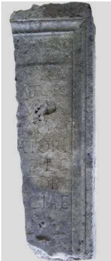
Slika 6 Juniorov spomenik

kasnije razdoblje principata (2.-3. stoljeće) s obzirom da tada kuratori dobivaju sve veću ulogu na štetu lokalnih municipalnih magistrata. Ostale kuratele su se ticale brige o javnim i sakralnim građevinama, vodovodu, igrama, zalihama ulja i žita i drugoga nužnog za funkcioniranje grada. 180 Precizniju dataciju pruža druga služba koju je Junior obavljao, a to je curator aquae et Minuciae , to jest službenik (povjerenik) koji je u Rimu nadgledao opskrbu vodom i distribuciju besplatnoga žita. Ovu zadnju službu je obavljao u kompleksu imenom Porticus Minucia na