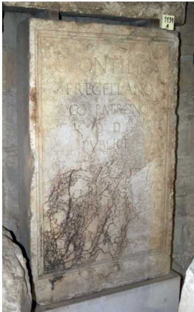
Slika 1 Spomenik Gaja Pontilija Fregelana u lapidariju splitskoga Arheološkog muzeja

godina konzulata je nesigurna te za dotičnoga nije utvrđeno točno vrijeme obnašanja funkcije konzula. 45 U pokušaju identificiranja ove osobe treba u analizu uključiti Tacita i poznatu urotu protiv cara Tiberija u posljednjoj godini njegova vladanja. O tom događaju kaže Tacit,