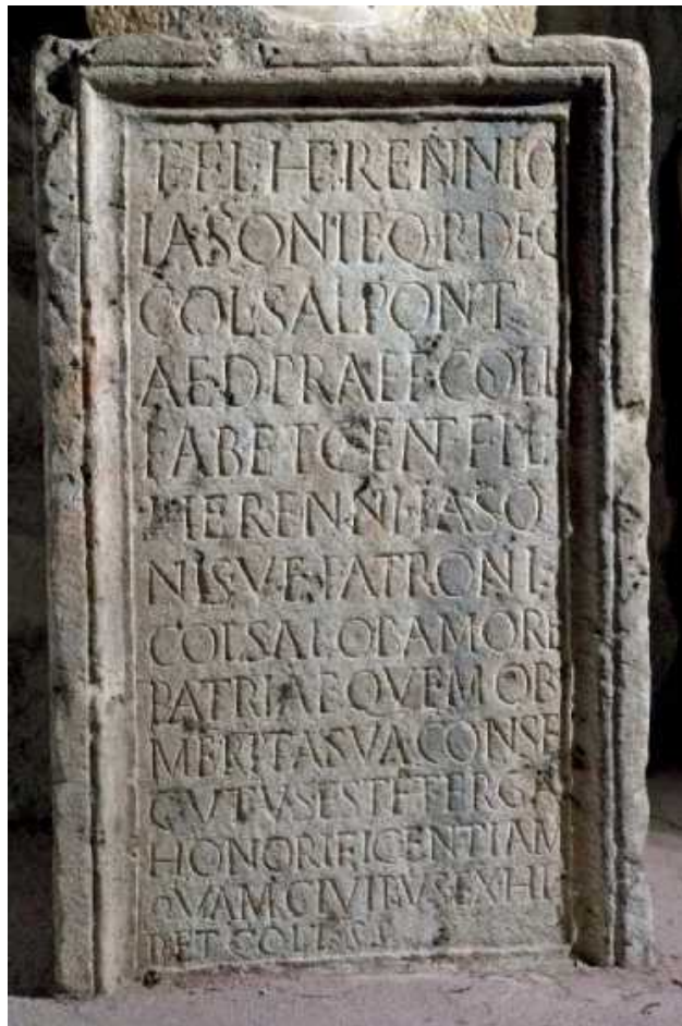
Slika 5 Spomenik Tita Flavija Herenija Jasona

Ova baza spomenika (sl. 5), izrađena od vapnenca, čuva se u Arheološkom muzeju u Splitu, inventarni broj A 5373, a nađena je u istočnom dijelu Salone nakon savezničkoga bombardiranja godine 1944. Objavio ju je Duje Rendić-Miočević nekoliko godina kasnije u VAHD-u. 162 Baza je visine 116 cm, širine 70 cm, a debljine 56 cm, dok je natpisno polje površine 97,5 cm x 51 cm. Slova su različite veličine i smanjuju se od vrha prema dolje, dok su slova NT u ligaturi u petom retku u riječi cent(onariorum) . 163 Spomenik je podignut Titu Flaviju Hereniju Jasonu, uglednom salonitanskom magistratu i svećeniku, koji je obnašao funkcije dekuriona, pontifika, edila te prefekta kolegija kovača i tekstilaca koji su mu i podigli spomenik. Bio je viteškoga ranga ( equus Romanus ). 164 Za ovu temu važan je spomen njegova oca Herenija Jasona, za kojega se kaže da je također imao viteški status ( vir egregius ) te da je bio patron Salone. M. Glavičić smatra da ta titula označava prokuratorski status 165 što bi značilo da bi bio jedan od curatores rei publice o čijim je funkcijama bilo riječi ranije. Kuratori su se birali iz drugih zajednica (kolonija, municipija) ili iz viteškoga i senatorskoga ranga 166 pa bi ova titula i činjenica da je bio patron (i time vjerojatno vršio i druge službe u gradu) upućivala da je Herenije Jason bio takav službenik. To odmah pruža informacije za datiranje. Kuratori se pojavljuju u doba Flavijevaca, no njihova važnost se povećava tijekom 2. stoljeća, a pogotovo