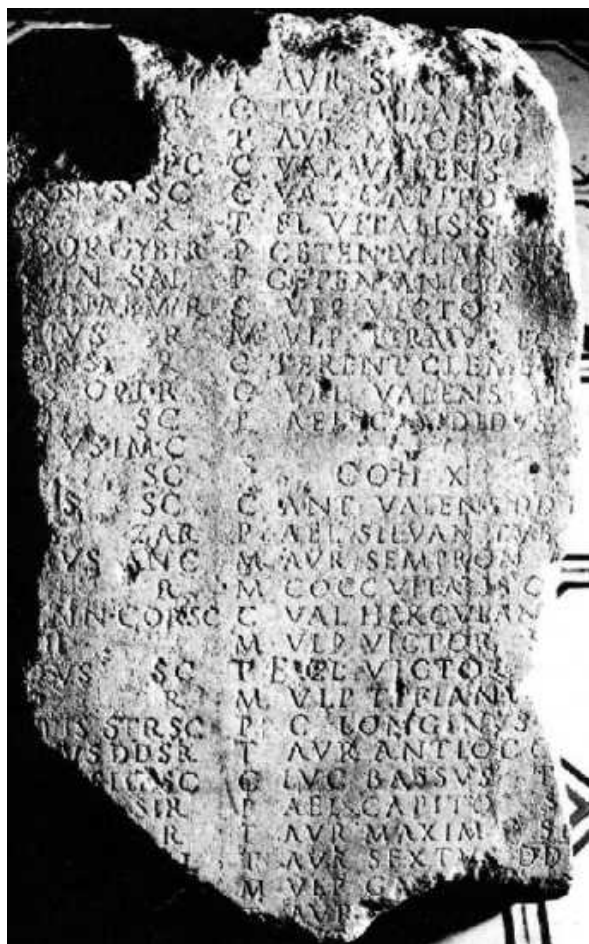
Slika 6 Ulomak natpisa otpuštenih legionara VII. legije 195. godine (M. Mirković 2004)

vojnike. 50 Ne zna se koliko je ukupno otpuštenih vojnika bilo na popisu, kao ni broj unovačenih vojnika 169. godine. Međutim, kako ih je po popisu otpušteno barem 270, ta je generacija unovačenih brojala barem dvostruko veći broj vojnika, što je uistinu mnogo za potrebe jedne legije u samo jednoj godini. To se može objasniti upravo ovim razdobljem u kojem je smrtnost među vojnicima bila dosta visoka kao posljedica kuge koja je harala na ovom području, ali i realnom opasnošću od provale Markomana, Kvada i Jaziga. Ovakvih je popisa otpuštenih legionara na području Carstva osim ovoga sačuvano još samo šest. 51