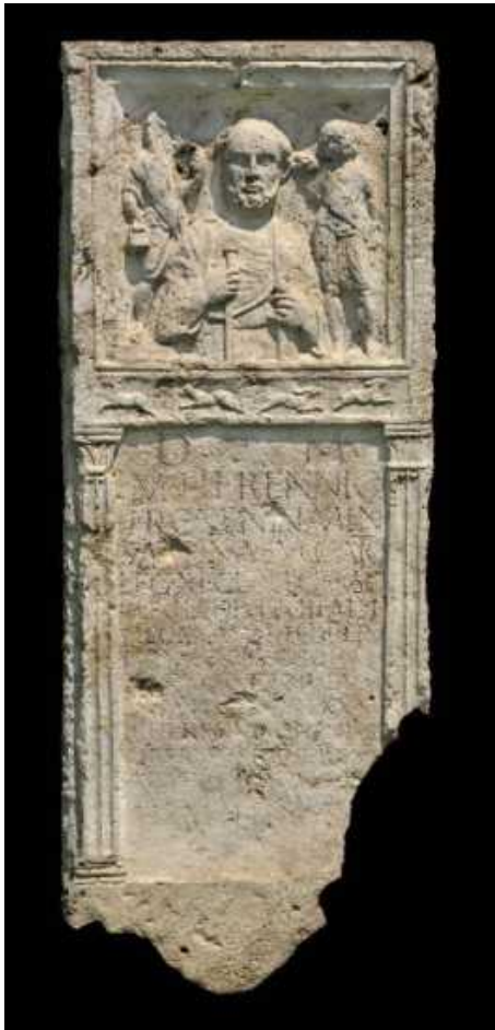
Slika 1 Stela Marka Herenija Valenta

podigao oslobođenik i nasljednik Marko Herenije Helije koji je nakon manumisije dobio predime i gentilicij bivšega gospodara, a njegovo je originalno ropsko ime došlo na mjesto kognomena. Gentilicij Herennius u Dalmaciji je najbolje potvrđen u Saloni, a radi se o obiteljima italskoga podrijetla. 11 Na spomeniku mu je u obrnutom poretku zabilježen slijed višestrukih centurionata koje je obnašao u raznim legijama. Spomenuti su samo centurionski položaji, no ne vjerujemo da je Herenije bio direktno promoviran u centuriona kao vitez. Smatramo da je prije toga proveo u vojsci petnaestak godina tijekom kojih je, uz to