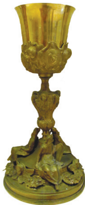
Slika 11. Kalež, Dominikanski samostan, Dubrovnik. Snimila M. Jerman, 2013.

onica koja ih je izrađivala ugledala se na radove iz zlatarske obitelji Arrighi, čiji su članovi vodili jednu od najaktivnijih radionica tijekom 18. stoljeća u Rimu. 47