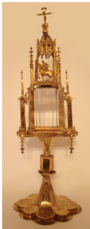
Slika 1. Pokaznica , Župa svetog Jurja, Lovran., 2013.

biti izveden u Veneciji, kamo se uobičajeno na popravak slala oštećena srebrnina s područja istočne obale Jadrana s obzirom na vrlo cijenjene i brojne tamošnje radionice. Pojedini elementi Jurjeva lica kao i stilizacije odjeće te konja upućuju upravo na zlatarsku tradiciju na području Veneta s početka 19. stoljeća. 31