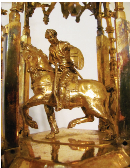
Slika 2. Sveti Juraj , detalj pokaznice, Župa svetog Jurja, Lovran. 2013.

svetog Jurja smještena pod šesterostrani baldahin na vrhu pokaznice. Hreljinska figura svetog Jurja s kraja 15. stoljeća prikazuje sveca kao viteza u kasnogotičkom oklopu s mačem kako ubija zmaja podno svojih nogu. Za razliku od hreljinske figurice, lovranski sveti Juraj ljepuškast je mladić u renesansnom oklopu s mačem i štitom, a prikazan je kako jaše konja. Detalji lovranske figure, napose kvalitetno oblikovano svečevo lice i majstorski izliven konj, svjedoče o vrlo spretnu majstoru dobro upućenu u problematiku oblikovanja konjaničke skulpture. Kako je pokaznica popravljena tijekom 19. stoljeća, postoji mogućnost da je prikaz svetog Jurja replika izvorne figure, odnosno otočentistički nadomjestak. Popravak pokaznice 1823. godine mogao je