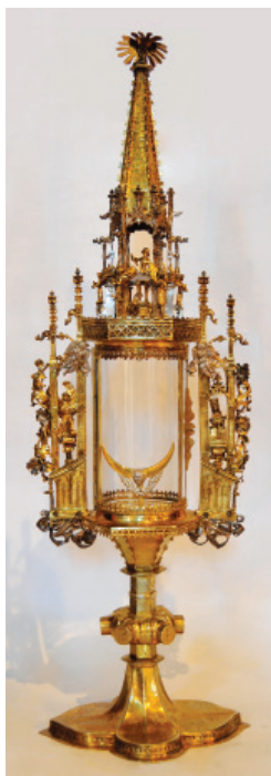
Slika 6. Pokaznica, Župa svetog Jurja, Hreljin.

kombiniranje i ponavljanje matrica te kalupa kao i eventualno postavljanje figuralnih ili dekorativnih aplika. U tom kontekstu bogatstvo i složenost oblika uvjetuje ikonografski koncept kojim se želi istaknuti simbolika predmeta povezana s njegovim figuralnim ukrasom. Tako se u Župi svetog Jurja čuva i kalež kružnog podnožja na koje su aplicirane izlivenne figure triju starozavjetnih likova: Mojsija, Melkisedeka i Arona 32 (Slika 7). Prorok Mojsije prikazan je kao starac koji sjedi odjeven u jednostavnu haljinu s pojasom. U lijevoj ruci drži ploče Božjih zapovijedi, dok se desnom rukom oslanja na podnožje. Prema srednjovjekovnoj pogrešnoj interpretaciji biblijskog teksta, iz Mojsijeve glave umjesto sunčevih zraka izviru rogov, što je postao njegov znak prepoznavanja. 33 Do njega sjedi Melkisedek, odjeven u svečanu odoru s okrunjenim pokrivalom za glavu. 34 U lijevoj ruci drži kruh, a u desnoj kalež. Treća figura predstavlja Arona, starijeg Mojsijeva brata. 35 On nosi odjeću velikog svećenika, a na glavi ima pokrivalo slično mitri. U lijevoj ruci ima kruh, a u desnici kadionicu (Slika 8). Između likova na podnožju ukrasne su „C“-vitice, a u donjem dijelu izmjenjuju se nizovi vegetabilnih dekorativnih traka. Podnožje se izdiže u držak