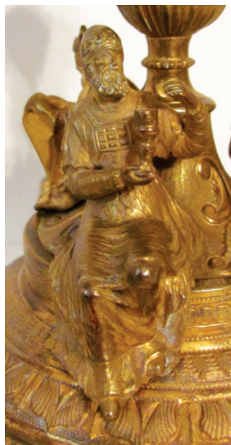
Slika 9. Melkisedek , detalj kaleža, Župa svetog Jurja, Lovran.

između Boga i ljudi ( Slika 9 ). Mojsije se u zapadnom kršćanstvu smatra prefiguracijom Krista i svetog Petra, odnosno prvog pape. 40 Mojsije je i predvodnik naroda, pastir i zakonodavac Starog Zavjeta. On tako nagovješćuje Krista, koji ispunjava starozavjetni zakon, ali ujedno i uspostavlja novi zakon Božje ljubavi prema čovjeku. Kalež simbolizira Kristovu prolivenu krv. Melkisedek je bio biblijski kralj i svećenik u Šalemu koji je pred Abrahama iznio kao žrtveni dar kruha i vina. Ti su njegovi darovi postali prefiguracija buduće euharistije, odnosno Krista kao svećenika i Kralja. 41 Napoljetku Aron, Mojsijev brat i prvi izraelski vrhovni svećenik, također je, prema Božjim uredbama, prefiguracija Krista kao velikog svećenika Novog Zavjeta, ali i samog pape kao vrhovnog svećenika Crkve. 42 Zlatarevo poznavanje biblijskih tekstova vidljivo je i u načinu obrade Aronove odjeće, gdje je majstor pazio da bude u skladu s opisom koji se nalazi u Bibliji ( Slika 10 ). Tako se Aronova odjeća sastoji od haljine s naprsnikom, oplećka, pojasa, ogrtača i košulje obrubljene resama, a na glavi nosi mitru. Prema Bibliji, sva odjeća bila je izrađena od ljubičastih, crvenih i tamnocrvenih tkanina te ukrašena zlatom i dragim kamenjem. 43 Na oplećku je tako majstor urezao 12 dragulja, koji