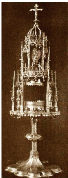
Slika 3. Pokaznica, Düren, reprodukcija iz: Braun, Joseph, Das Christliche Altargerat , München, 1932.