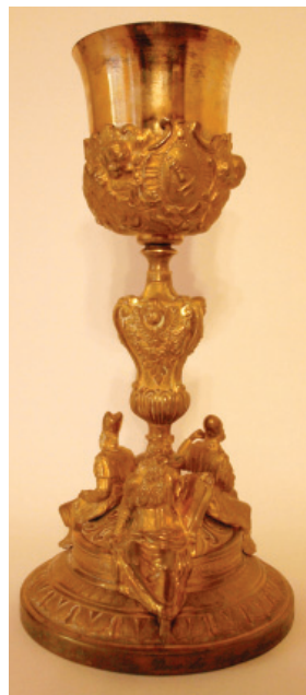
Slika 7. Kalež, Župa svetog Jurja, Lovran. Snimila M. Jerman, 2013.

kombiniranje i ponavljanje matrica te kalupa kao i eventualno postavljanje figuralnih ili dekorativnih aplika. U tom kontekstu bogatstvo i složenost oblika uvjetuje ikonografski koncept kojim se želi istaknuti simbolika predmeta povezana s njegovim figuralnim ukrasom. Tako se u Župi svetog Jurja čuva i kalež kružnog podnožja na koje su aplicirane izlivenne figure triju starozavjetnih likova: Mojsija, Melkisedeka i Arona 32 (Slika 7). Prorok Mojsije prikazan je kao starac koji sjedi odjeven u jednostavnu haljinu s pojasom. U lijevoj ruci drži ploče Božjih zapovijedi, dok se desnom rukom oslanja na podnožje. Prema srednjovjekovnoj pogrešnoj interpretaciji biblijskog teksta, iz Mojsijeve glave umjesto sunčevih zraka izviru rogov, što je postao njegov znak prepoznavanja. 33 Do njega sjedi Melkisedek, odjeven u svečanu odoru s okrunjenim pokrivalom za glavu. 34 U lijevoj ruci drži kruh, a u desnoj kalež. Treća figura predstavlja Arona, starijeg Mojsijeva brata. 35 On nosi odjeću velikog svećenika, a na glavi ima pokrivalo slično mitri. U lijevoj ruci ima kruh, a u desnici kadionicu (Slika 8). Između likova na podnožju ukrasne su „C“-vitice, a u donjem dijelu izmjenjuju se nizovi vegetabilnih dekorativnih traka. Podnožje se izdiže u držak