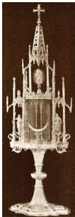
Slika 5. Pokaznica, Grosswenkheim, reprodukcija iz: Braun, Joseph, Das Christliche Altargerat , München, 1932.

Pokaznica je vrlo vjerojatno imala i figure s bočnih strana, koje nisu sačuvane, no nisu nadomještene novima. Iako prepravljena, lovranska pokaznica svojom tipologijom pridonosi brojnosti grupe sačuvanih kasnogotičkih pokaznica, koje su, prema dosad poznatim primjerima, bile naročito cijenjene na području Istre i sjevernog Jadrana.