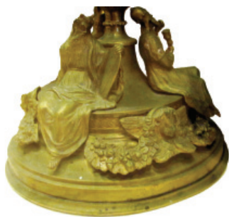
Slika 12. Detalj kaleža, Dominikanski samostan, Dubrovnik. Snimila M. Jerman, 2013.

girlandama s andeoskim glavama, dok su im držak i čaša bitno različiti. Tako je držak drveničkog kaleža napravljen u obliku tempietta sa šest stupova i kupolom koja natkriva figuricu simboličnog jaganjca, dok je na košarici prikaz Posljednje večere. 46 S druge strane dubrovački kalež ima neobarokni nodus u obliku kruške i košaricu ukrašenu andeoskim glavicama, „C“-vitica-ma i rocaille -motivima (Slika 12). Vrlo je vjerojatno da bi se kalež iz Drvenika zbog klasicistički oblikovana drška kao i prikaza Posljednje večere u vidu jedinstvena reljefa bez dodatne dekoracije mogao datirati u prvu polovicu 19. stoljeća. Dubrovački i lovranski kalež, koji su gotovo identični, mogli bi se datirati u drugu polovicu 19. stoljeća zbog neobaroknog oblikovanja. Tu tezu dodatno osnažuje činjenica da je lovranski kalež donacija crkvi iz posljednjeg desetljeća 19. stoljeća. Nepoznata, vjerojatno rimska radi-