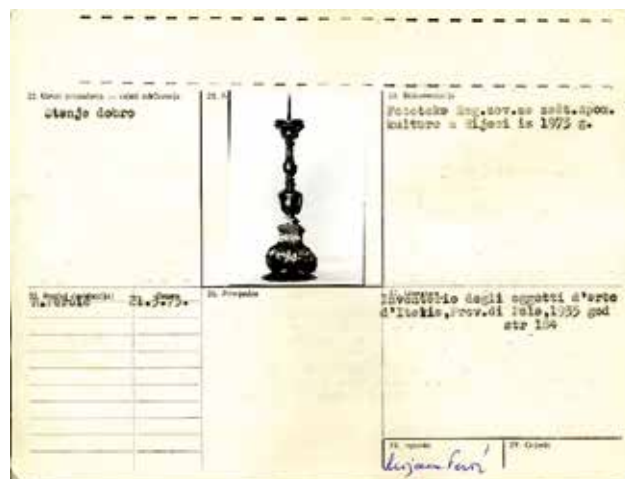
1 Karton kartoteke svijećnjaka iz župne crkve sv. Eufemije iz Rovinja Card of the card files of candlesticks of the parish church of St. Euphemia in Rovinj

Naime, u nekoliko navrata nadležna tijela zatražila su Zavod za zaštitu spomenika 2 popis kategoriziranih spomenika. Tako je Savjet za kulturu SR Hrvatske 1963. godine zatražio podatke od Zavoda za zaštitu spomenika kulture i drugih kulturnih ustanova (muzeja, knjižnica) o spomenicima kulture od izuzetnog značaja za opću ili nacionalnu kulturu 3 . Traženi podatci za nepokretne spomenike bili su: opis objekta, valorizacija s kratkim obrazloženjem, fotografija, te postojanje arhitektonskih nacrti, dok je za pokretne spomenike uz navedene podatke trebalo priložiti i dimenzije. Republički zavod za zaštitu spomenika, zajedno s regionalnim zavodima u Splitu, Rijeci, Osijeku i Zagrebu, proveo je stručne pripreme koje su uključivale izradu uputa za nužnu dokumentaciju za potrebe valorizacije i kategorizacije i kriterije za njenu provedbu te sadržaj prijedloga za kategorizaciju. Navedeni materijal uz popis spomenika dostavili su Savjetu za zaštitu spomenika kulture. Regionalni zavod za zaštitu spomenika kulture u Zagrebu dostavio je popis raspoređen po vrstama spomenika i po kategorijama: sakralni spomenici, dvorci i kurije i stari gradovi. Niti jedan spomenik nije bio svrstan u 0. kategoriju, nego u 1. i 2. 4