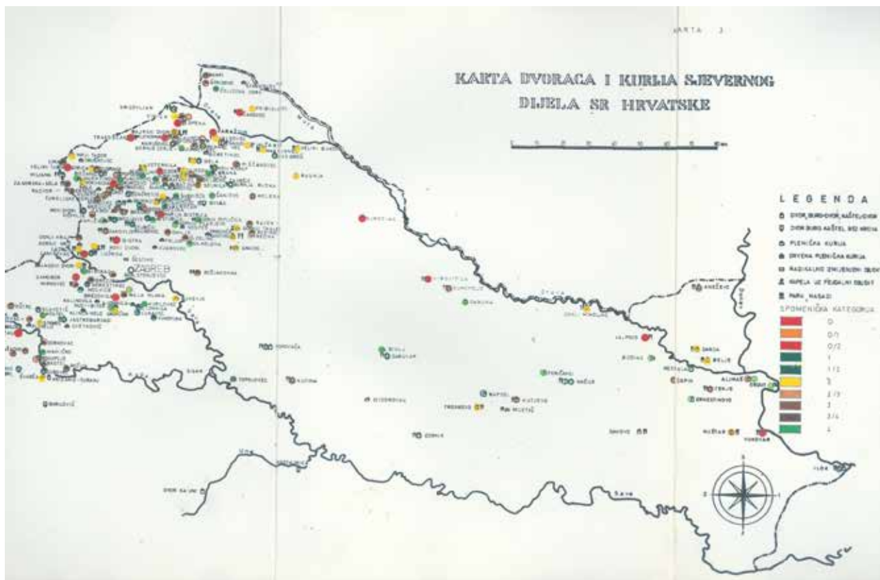
2 Kategorizacije za dvorce i kurije Anđele Horvat Categorisation for castles and manor houses of Anđela Horvat

vrijednosti, Horvat je navela i komponente koje bi se trebale uzeti u obzir za valorizaciju kao što su: svrha zbog koje je predmet nastao, vrijeme, geografski prostor, autentičnost, rijetkost, ambijent, autor, društveni sloj koji je uvjetovao nastanak predmeta, događaj koji je dao poticaj te kontakti povezani prometnim vezama. 8 Nadalje, prilikom vrjednovanja Horvat naglašava ambijentalnu vrijednost u smislu ostanka/ostavljanja umjetnine u njenom prvotnom prostoru, pritom naglašavajući stav konzervatorske službe o ostanku umjetnina in situ kadgod i gdje god je to moguće. 9