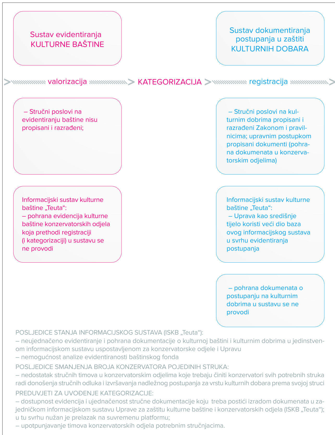
Shema 1 Položaj kategorizacije u odnosu na sustav zaštite kulturne baštine i zaštite kulturnih dobara, te sadašnje stanje koje se odražava na uvođenje kategorizacije

Position of categorisation with respect to the system of cultural heritage and cultural property protection and current situation reflecting on the introduction of categorisation Shema