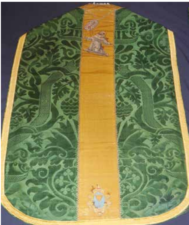
19 Misnica u samostanu franjevaca konventualaca sv. Frane u Šibeniku

Chasuble in the textile collection of the Parish of the Birth of the Blessed Virgin Mary in Skradin, details