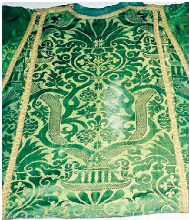
14 Dalmatika iz nekadašnje katedrale sv. Marije u Osoru, detalj Dalmatic from the former Cathedral of St. Mary in Osor, detail

Drugi su po brojnosti damasti zelene boje. U nekadašnjoj osorskoj katedrali Uznesenja Marijina sačuvao se misni ornat 49 (pluvijal, misnica, dalmatika, velum, štola i manipul) od zelenog damasta (sl. 14) čiji je dekor jednak onom s dalmatikâ u Pićnu (sl. 11), te se stoga u pogledu datacije i provenijencije osorskog primjerka mogu izvesti jednaki zaključci. 50 Liturgijski predmet nepoznate izvorne namjene (101 x 63,5 centimetra; prekrivač za ambon?) za čiju su izradu iskorištena četiri fragmenta zelenog damasta (sl. 15) zatečen je u župnoj crkvi Rođenja Blažene Djevice Marije na Silbi. Na njemu zastupljen uzorak identičan