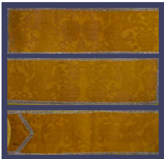
24abc Isječci damasta na misnici iz župne crkve Pohođenja Blažene Djevice Marije u Molatu. Zbirka tekstila Zadarske nadbiskupije, Zadar

Damask segments on the chasuble from the Parish Church of the Visitation of the Blessed Virgin Mary in Molat. Zadar Archbishopric Textile Collection, Zadar