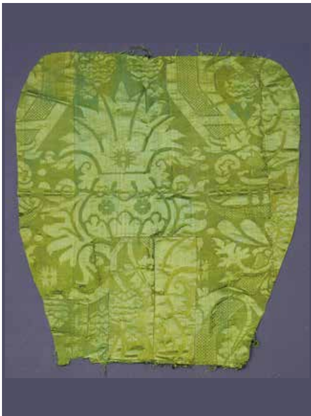
18 Ostatak nepoznatog predmeta (misnice?) u Novoj crkvi u Šibeniku

Remains of unknown item (chasuble?) in the New Church /Nova crkva/ in Šibenik