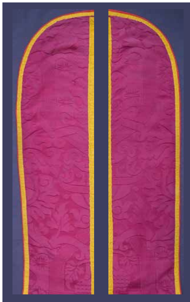
8ab Komadi damasta na bočnim površinama leđne strane misnice iz župne crkve Rođenja Blažene Djevice Marije (nekada sv. Jakova Apostola) na Premudi. Zbirka tekstila Zadarske nadbiskupije, Zadar

od pluvijala (sl. 7), dvije dalmatike i manipula, po predaji je pripadao jednom od franjevaca iz roda Divnića. Dijelovi ornata su publicirani u dva navrata, no prvenstveno zahvaljujući kompozicijama vrijednog figuralnog venecijanskog veza iz druge polovine 16. stoljeća koje ukrašavaju rubni