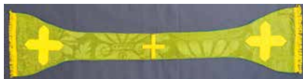
17 Manipul iz župne crkve Rođenja Blažene Djevice Marije (nekada sv. Jakova Apostola) na Premudi. Zbirka tekstila Zadarske nadbiskupije, Zadar

sekundarno upotrijebljen za popravak stupa prednje strane misnice zatečene u crkvi Gospe od Sedam Žalosti, a unatoč manjim dimenzijama, zbog karakterističnih detalja poput malog ploda mogranja i sitnih šiljastih izboja na grani možemo ga priključiti firentinskim damastima iz prve polovine 17. stoljeća. Iako su se na manipulu iz župne crkve na Premudi (sl. 17) sačuvala tek dva manja fragmenta zelenog damasta, zbog karakterističnog donjeg dijela kantarosa – s prstenastim obodom raščlanjenim nizom kružnica te bazom u obliku dviju masivnih voluta, i ovaj primjerak možemo svrstati u istu skupinu kojoj pripada i damast sa Silbe. U Novoj crkvi u Šibeniku sačuvao se ostatak nepoznatog predmeta (sl. 18) skrojen od šest fragmenata zelenog damasta, čiji se dekor podudara s onima na primjercima iz Čiova (sl. 6) i Pašmana (sl. 10), za koji je pretpostavljeno venecijansko podrijetlo te druga polovina 16. stoljeća kao razdoblje nastanka. Nekoliko fragmenata zelenog damasta ove tipologije upotrijebljeno je i za izradu štole sačuvane u Pustinji Blaca na otoku Braču. Na dostupnoj fotografiji vidljivi su svi već dobro poznati elementi: stilizirani plodovi mogranja, zvjezdasti cvjetovi karanfila, povijene grane i široka vrpca s uzorkom šahovnice. Nažalost, samo na temelju te jedne fotografije, koja nije dovoljno kvalitetna da ovdje bude priložena, nije