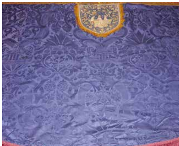
25 Pluvijal u samostanu franjevac konventualaca sv. Frane u Šibeniku, detalj

Damask segments on the chasuble from the Parish Church of the Visitation of the Blessed Virgin Mary in Molat. Zadar Archbishopric Textile Collection, Zadar