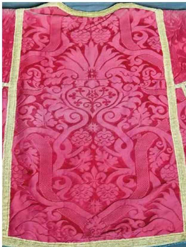
11 Dalmatika u župnoj crkvi Navještenja Marijinog u Pićnu, detalj