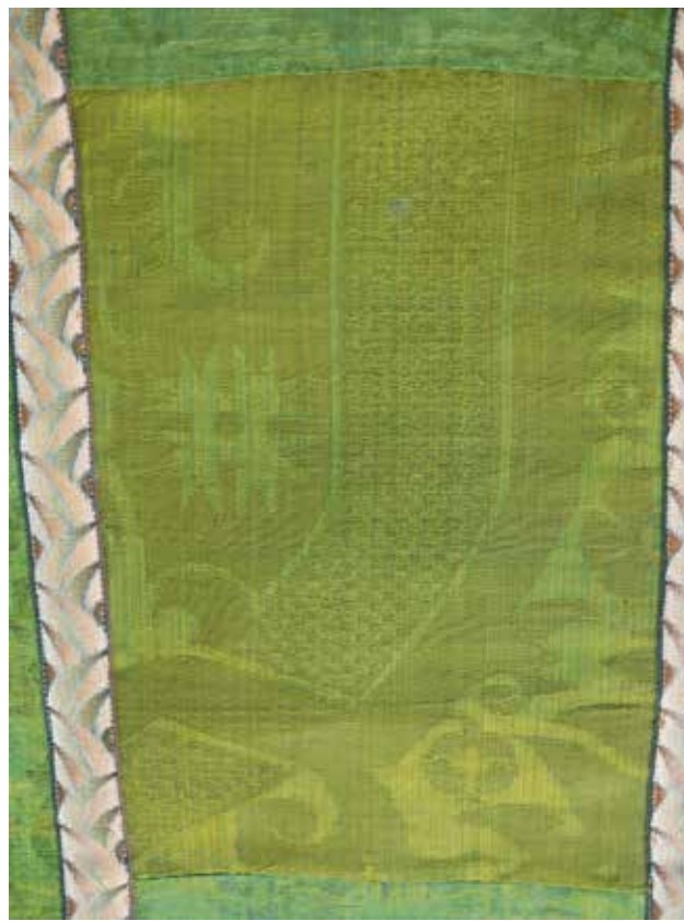
16 Fragment damasta na misnici u crkvi Gospe od Sedam Žalosti u Komiži

Lectern cover (?) from the Parish Church of the Birth of the Blessed Virgin Mary on the Island of Silba. Zadar Archbishopric Textile Collection, Zadar