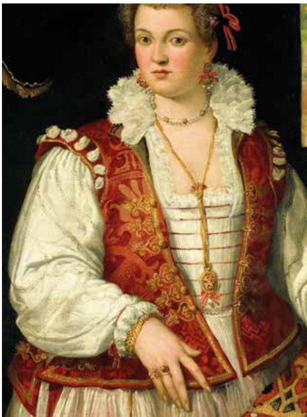
2 Francesco Montemezzano (atrib.), Dama s vjevericom , detalj. Ulje na dasci, 133.5 x 98 cm, između 1565. i 1575. Rijksmuseum, Amsterdam Francesco Montemezzano (atrib.), Portrait of a Woman with a Squirrel , detail. Oil on panel, 133.5 x 98 cm, between 1565 and 1575. Rijksmuseum, Amsterdam