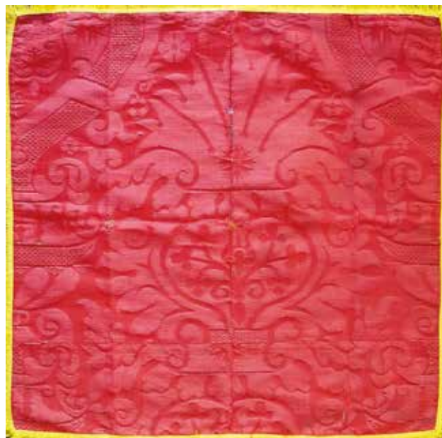
13 Velum za kalež u zbirci tekstila župe Porođenja Blažene Djevice Marije u Skradinu

Cope from the Parish Church of the Assumption of the Blessed Virgin Mary in Omišalj