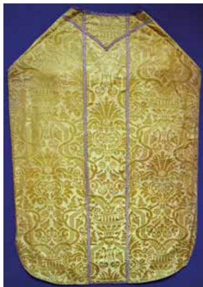
23ab Misnica u katedrali Uznesenja Blažene Djevice Marije u Krku, detalj i total leđne strane Chasuble in the Cathedral of the Assumption of the Blessed Virgin Mary in Krk, detail and total of the back