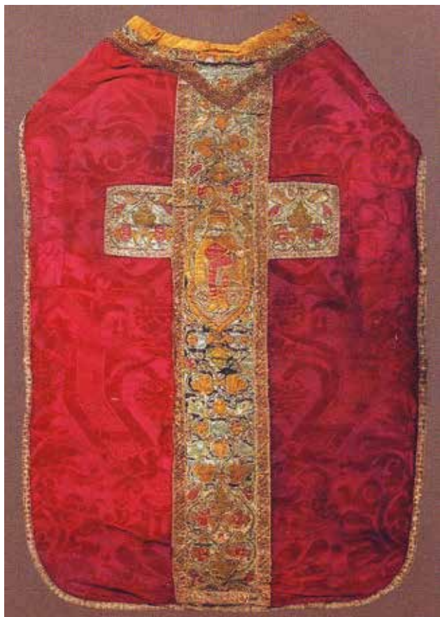
6 Misnica iz crkve sv. Josipa (sv. Lazara) na Čiovu

Chasuble from the Church of St. Joseph (St. Lazarus) on the Island of Čiovo