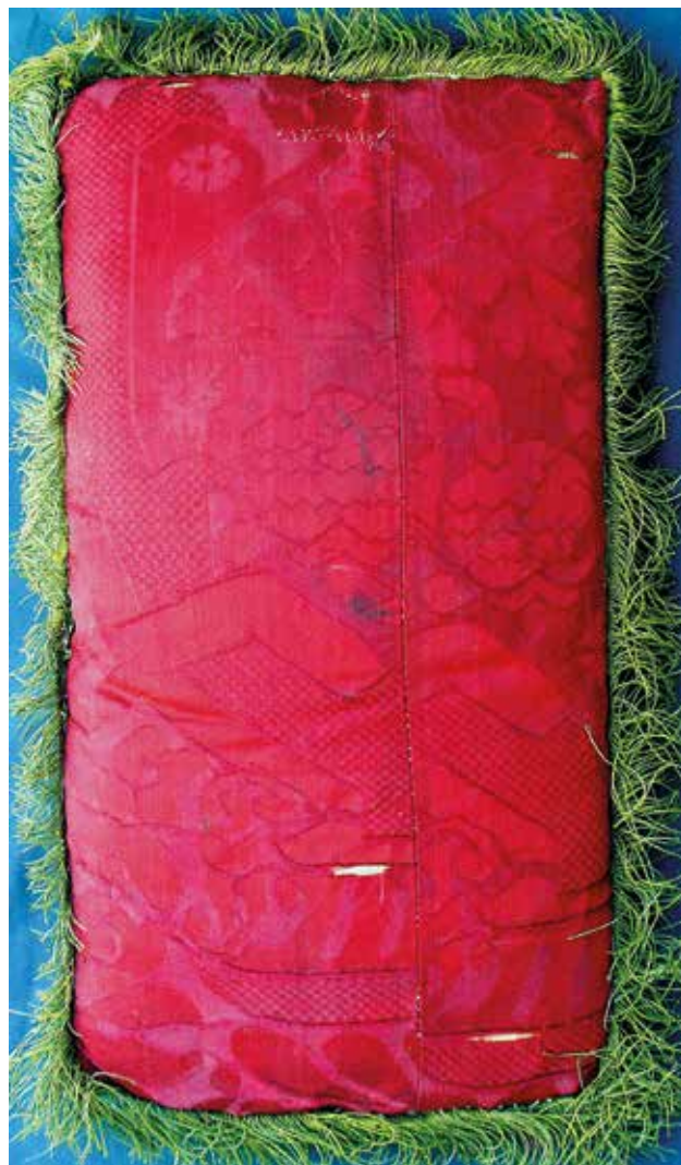
4 Revers jastuka za misal u samostanu franjevki sv. Antuna Opata u Rabu

Reverse of the Missal cushion in the Franciscan Convent of St. Anthony the Abbot in Rab