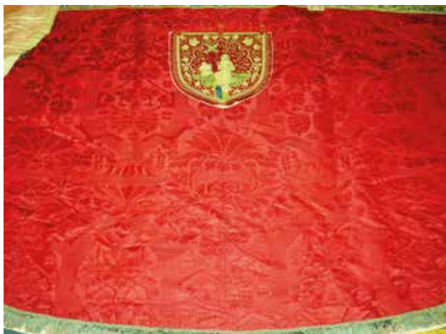
7 Pluvijal u samostanu franjevaca konventualaca sv. Frane u Šibeniku, detalj (foto: S. Banić)

Chasuble from the Church of St. Joseph (St. Lazarus) on the Island of Čiovo (source: Bezić Božanić, N. /note 44/)