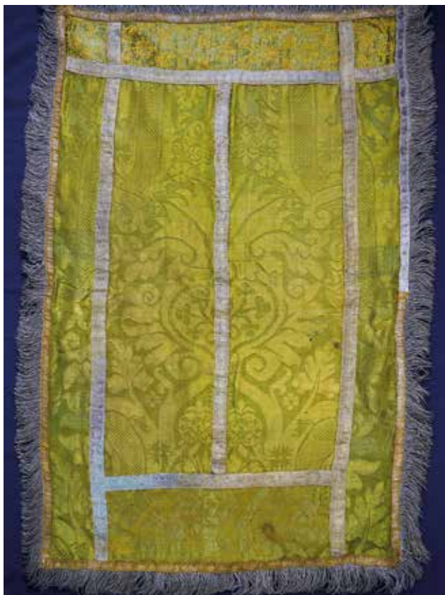
15 Prekrivač za ambon (?) iz župne crkve Rođenja Blažene Djevice Marije na Silbi. Zbirka tekstila Zadarske nadbiskupije, Zadar

Lectern cover (?) from the Parish Church of the Birth of the Blessed Virgin Mary on the Island of Silba. Zadar Archbishopric Textile Collection, Zadar