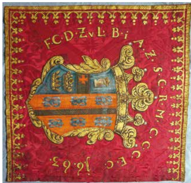
Sab Avers i revers zastave baruna Franje Čikulinija, prikazano u smjeru pružanja dekora damasta. Hrvatski povijesni muzej, Zagreb

Obverse and reverse of the banner of Baron Franjo Čikulini shown in the direction of the damask pattern layout. Croatian History Museum /Hrvatski povijesni muzej/, Zagreb