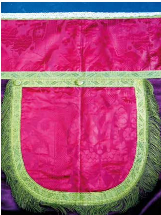
9 Rubni pojas (detalj) i kapuljača pluvijala u zbirci tekstila župe Porođenja Blažene Djevice Marije u Skradinu