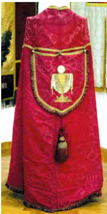
12 Pluvijal iz župne crkve Uznesenja Blažene Djevice Marije u Omišlju

Cope from the Parish Church of the Assumption of the Blessed Virgin Mary in Omišalj