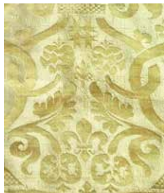
22 Prednji križ misnice iz nekadašnje katedrale sv. Marije u Osoru (foto: HRZ) Front cross of the chasuble from the former Cathedral of St. Mary in Osor (photo: HRZ)