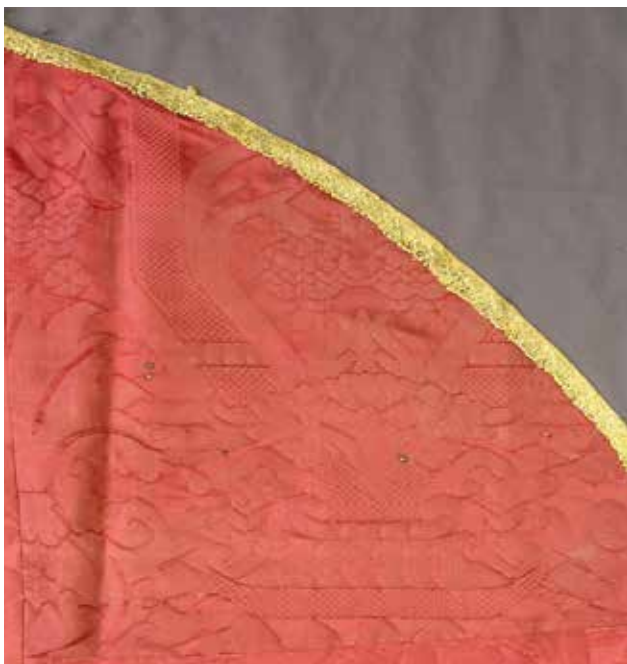
10 Jedan od četiri fragmenta damasta na pluvijalu iz župne crkve Rođenja Blažene Djevice Marije u Pašmanu. Zbirka tekstila Zadarske nadbiskupije, Zadar