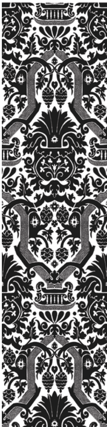
1 Dekor damasta s lokaliteta Gnalić (crtež: Ana Filep, Hrvatski povijesni muzej, Zagreb)

Pattern of the damask from the Gnalić shipwreck site (drawing: Ana Filep, Croatian History Museum /Hrvatski povijesni muzej/, Zagreb)