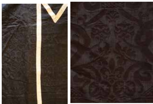
21ab Misnica u zbirci tekstila župe Porodenja Blažene Djevice Marije u Skradinu, detalji

Cope in the convent of Conventual Franciscans of St. Francis in Šibenik, detail