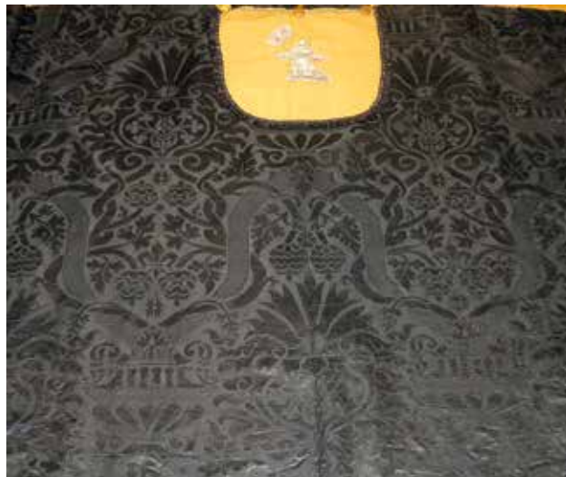
20 Pluvijal u samostanu franjevaca konventualaca sv. Frane u Šibeniku, detalj

Remains of unknown item (chasuble?) in the New Church /Nova crkva/ in Šibenik