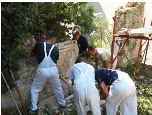
6 Vađenje lijeve bočne strane sanduka sarkofaga iz ogradnog zida kuće Formenti

Dismantling of perimeter wall of the House of Formenti and extraction of right lateral side of the sarcophagus crate