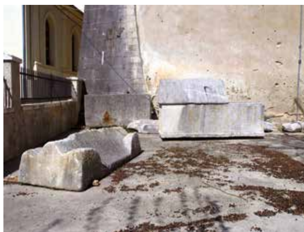
3 Sarkofazi nađeni u Rokovači, sada iza župne crkve u Skradinu

Maraguša site – view of the excavated gravesite architecture of part of the necropolis