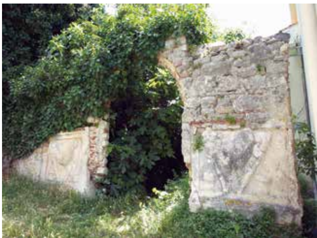
5 Dijelovi sarkofaga uzidani u ogradni zid kuće Formenti u Skradinu

Parts of sarcophagus built in the perimeter wall of the House of Formenti in Skradin