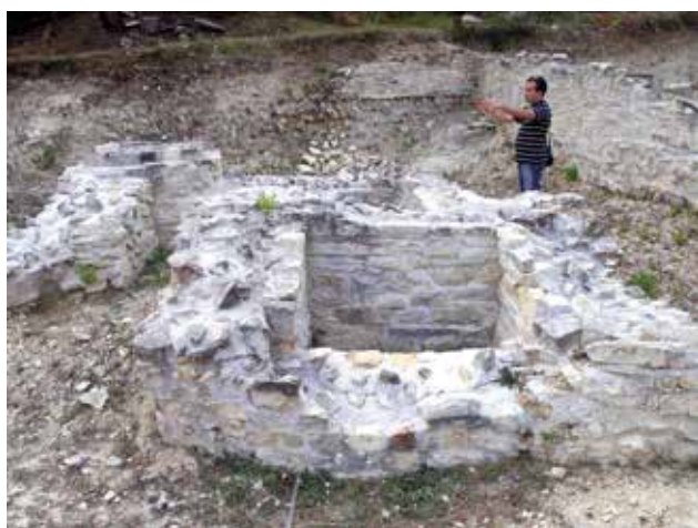
2 Lokalitet Maraguša – pogled na otkopanu grobnu arhitekturu dijela nekropole

Maraguša site – view of the excavated gravesite architecture of part of the necropolis