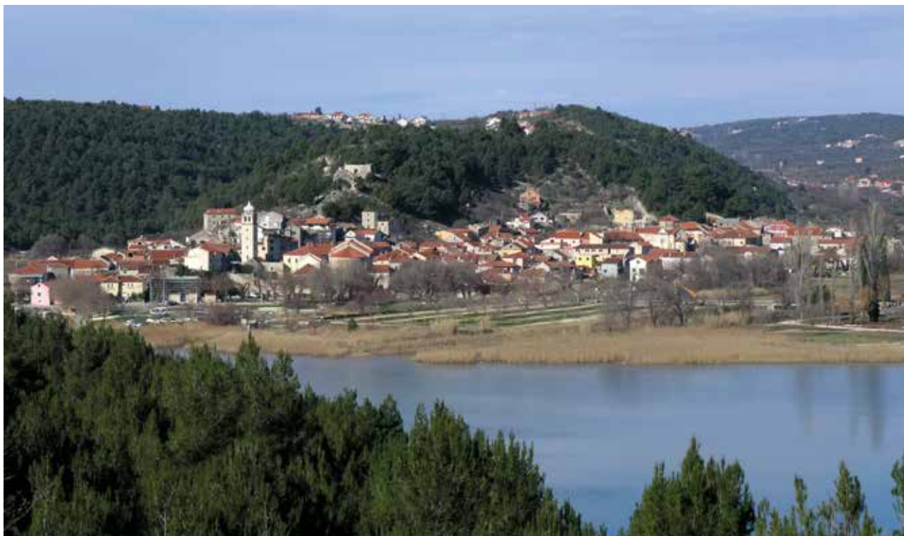
1 Pogled na Skradin