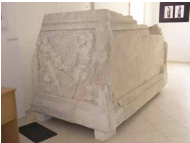
8 Pogled na restaurirani sanduk sarkofaga, sada u stalnom postavu Muzeja grada Skradina

View of restored sarcophagus crate, now part of the permanent exhibition of the Skradin City Museum