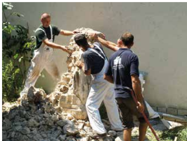
7 Demontaža ogradnog zida kuće Formenti i vađenje desne bočne strane sanduka sarkofaga

Parts of sarcophagus built in the perimeter wall of the House of Formenti in Skradin