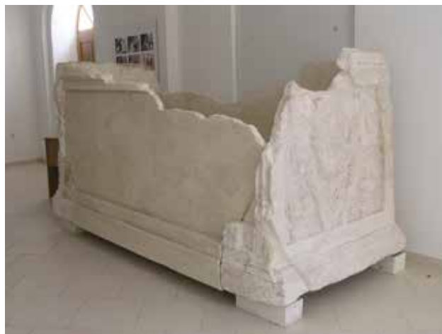
9 Pogled na restaurirani sanduk sarkofaga, sada u stalnom postavu Muzeja grada Skradina

Radovi na obnovi i prezentaciji sarkofaga, prikazani u ovom radu, predstavljaju nažalost jednu od rijetkih svijetlih točaka u sudbini rimske Skardone posljednjih godina. Izgradnjom kanalizacijskog sustava grada Skradina duž uvale Rokovača 2005. godine bez odgovarajućeg arheološkog nadzora, devastiran je po svoj prilici važni urbanizirani