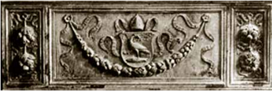
11 Detalj kustodije stare župne crkve u Pešti iz 1507. godine (Preuzeto iz: Pelc, Milan: Ugarske kiparske radionice i renesansa u sjevernoj Hrvatskoj, Radovi IPU 30, Zagreb, 2006.)

Detail of custody of old parish church in Pest dated 1507 (taken over from: Milan Pelc: „Hungarian sculpture workshops and the Renaissance in northern Croatia“, RIPU 30, Zagreb, 2006)