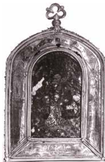
2 Riznica katedrale – pacifikal biskupa Luke. Na donjem dijelu okvira stražnje strane s prikazom smrti Bogorodice okružene apostolima nalaze se dva anđela s Lukinim grbom. Fototetka Ministarstva kulture, UZKB. (foto: V. Tkalčić, 1913. god.; inv. br. 672; neg. VI-39.)

Coat of arms of Bishop Luke (taken from: B. Zmajčić: „Coats of arms of Zagreb bishops and archbishops“, Grbovi zagrebačkih biskupa i nadbiskupa ), Anthology of the Zagreb diocese / Zbornik zagrebačke biskupije / 1904-1944 , Zagreb, 1945)