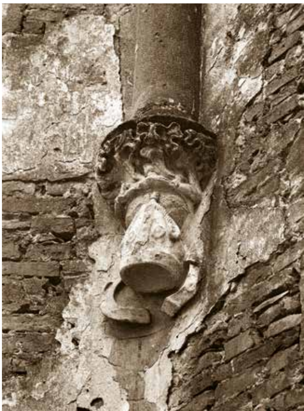
7 Detalj konzole polustupa gotičkog svoda u svetištu crkve sv. Ivana Krstitelja u Kloštar Ivaniću, stanje 1982. godine

Detail of console of pilaster of Gothic arch in the sanctuary of the church of St. John the Baptist in Kloštar Ivanić, condition in 1982