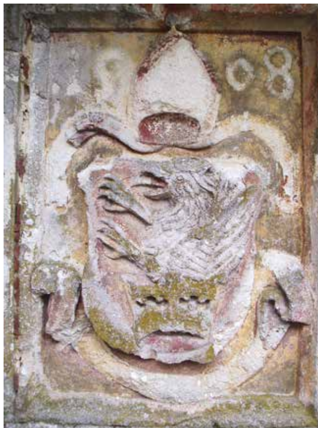
9 Grb biskupa Baratina, stanje 2005. godine

Grb biskupa Luke iz Kloštar Ivanića demontiran je 2005. godine početkom radova na obnovi glavnog pročelja