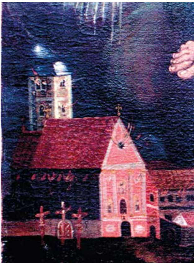
8 Detalj oltarne pale sv. Florijana iz crkve sv. Ivana Krstitelja u Kloštar Ivaniću (Izaija Gasser i pomoćnik, oko 1750. godine), s prikazom oslikanog glavnog pročelja. Nad ulaznim portalom nazire se i biskupski grb s zlatnožutim okvirom. Detail of the altarpiece of St. Florian from the church of St. John the Baptist in Kloštar Ivanić (Isaias Gasser and assistant, around 1750), showing the painted main facade. The Bishop's coat of arms with golden frame can be discerned above the entrance portal.

se za Boga u Kraljevini Slavoniji i u dijelovima Ugarske, Hrvatske i Štajerske, ovaj samostan u Ivaniću broji kao peti u Kraljevini Slavoniji i Zagrebačkoj biskupiji. Osnovan je i smješten dijelom među kršćanima katolicima, a dijelom, i to najvećim, među Vlasima, odnosno grčkim raskolnicima, s time da je nekoć bio u području turske vlasti. Zajedno s crkvom posvećen je i predan sv. Ivanu Krstitelju. Ovaj je samostan, prema tvrdnjama nekih, nekoć podignut, posjedovan i naseljen od redovnica iz Premonstratskog reda, a prema tvrdnjama drugih, radi se o ocima pustinjacima iz Reda sv. Augustina. Što je od toga bliže istini – ne zna se; jedino se iz znamenita urezanoga u kamen nad vratima crkve vidi kako je vjerojatnije da je pripadao muškarcima; ondje se, naime, nazire infula, odnosno mitra, iznad grifona, s oznakom godine 1508.“