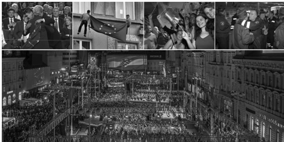
Foto 2: Politička ceremonija prigodom ulaska Hrvatske u Europsku uniju, Zagreb, Trg bana Josipa Jelačića, 1. srpnja 2013.