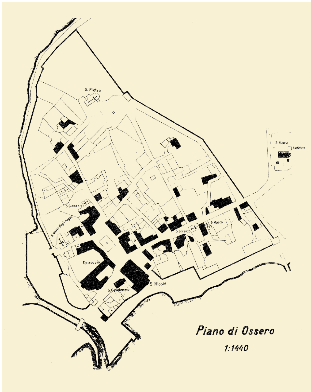
9. Plan Osora Map of Osor