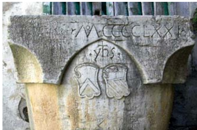
10. Kruna vodospreme na poziciji crkve Sv. Klementa, detalj Well-head at the site of the church of St Clement, detail

U blizini trga bile su smještene i druge sakralne građevine. Položaj crkava Sv. Lovre i Sv. Marka, s južne strane decumanusa , zabilježen je na katastru iz 1821. godine. Crkva Sv. Marka gradi se 1466. godine, o čemu svjedoči natpis na mramornoj ploči koji prepisuje Farlati. 46