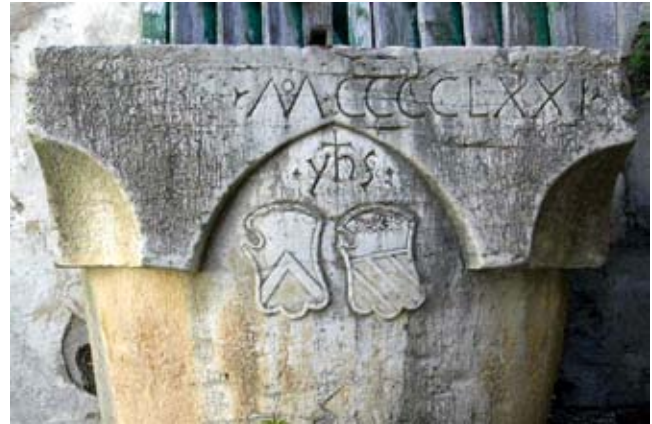
10. Kruna vodospreme na poziciji crkve Sv. Klementa, detalj Well-head at the site of the church of St Clement, detail

U blizini trga bile su smještene i druge sakralne građevine. Položaj crkava Sv. Lovre i Sv. Marka, s južne strane decumanusa , zabilježen je na katastru iz 1821. godine. Crkva Sv. Marka gradi se 1466. godine, o čemu svjedoči natpis na mramornoj ploči koji prepisuje Farlati. 46