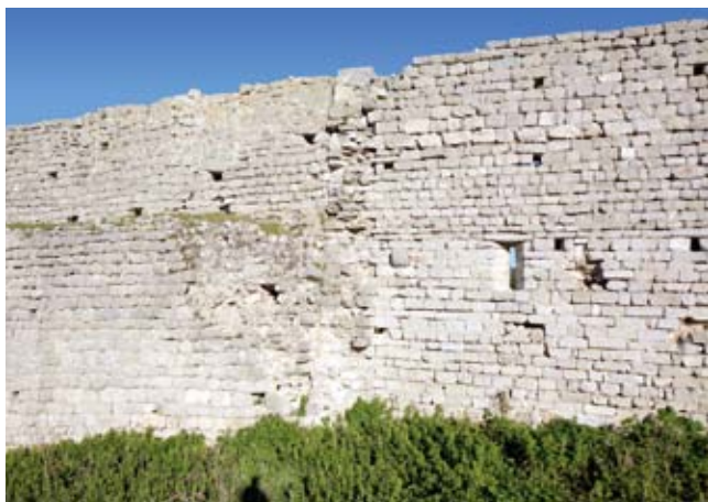
3. Poprečni zid iz 16. stoljeća, detalj

dokazano je da taj zid nije podignut kao nova struktura u cjelokupnosti svog pružanja, već je u sjevernoj četvrtini iskorišten dio postojećeg obrambenog zida samostana. Interpretacijom nalaza predložene su faze izgradnje i razlučene starije strukture samostanskih građevina te antički obrambeni elementi. Sukladno tomu, stariji su elementi inkorporirani u gradski bedem, a spojevi zidova sekundarno su ojačani kosim potpornjima uz vanjsko lice zida. 30 Sredinom 15. stoljeća samostan Sv. Petra bio je u lošem građevinskom stanju, o čemu svjedoče dopisi između Osorske biskupije i venecijanskog dužda iz 1458. godine koje objavljuje Farlati. 31 U tim se dokumentima spominje i potreba za popravkom samostana pa je kompleks koji su namjeravali koristiti i održavati očito poslužio kao sjeverna polazišna točka za podizanje novog zida. Krajnja je