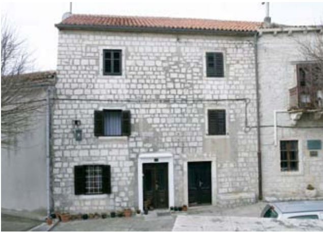
7. Biskupski dvor, istočno krilo s tragovima pregradnji gotičkih otvora Episcopal Palace, east wing with the traces of remodellings of Gothic openings

le u obliku lavljih glava koje nose balkon na istočnom pročelju i presloženi fragmenti okvira otvora ukrašena gotičkim motivom opletenog užeta, svjedoče o raskošnom izvornom dekorativnom repertoaru. Komplex je bio