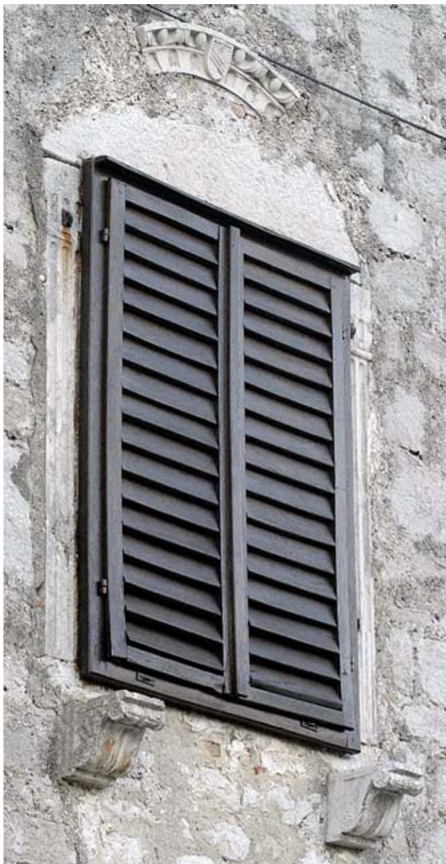
15. Kuća Schia ili Sbara u Osoru, detalj