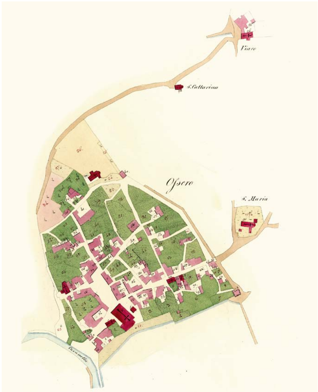
11. Prvi katastarski plan Osora iz 1821. godine (izvor: Archivio di Stato di Trieste, Fondo Catasto Franceschino, Serie Mappe, b 323b05, foglio V, sezione V, uz dopuštenje arhiva MBAC-AS-TS RESP_PROT 0002073 03/06/2013 Cl. 28.28.00/1.8)

The first land registry map of Osoro, 1821