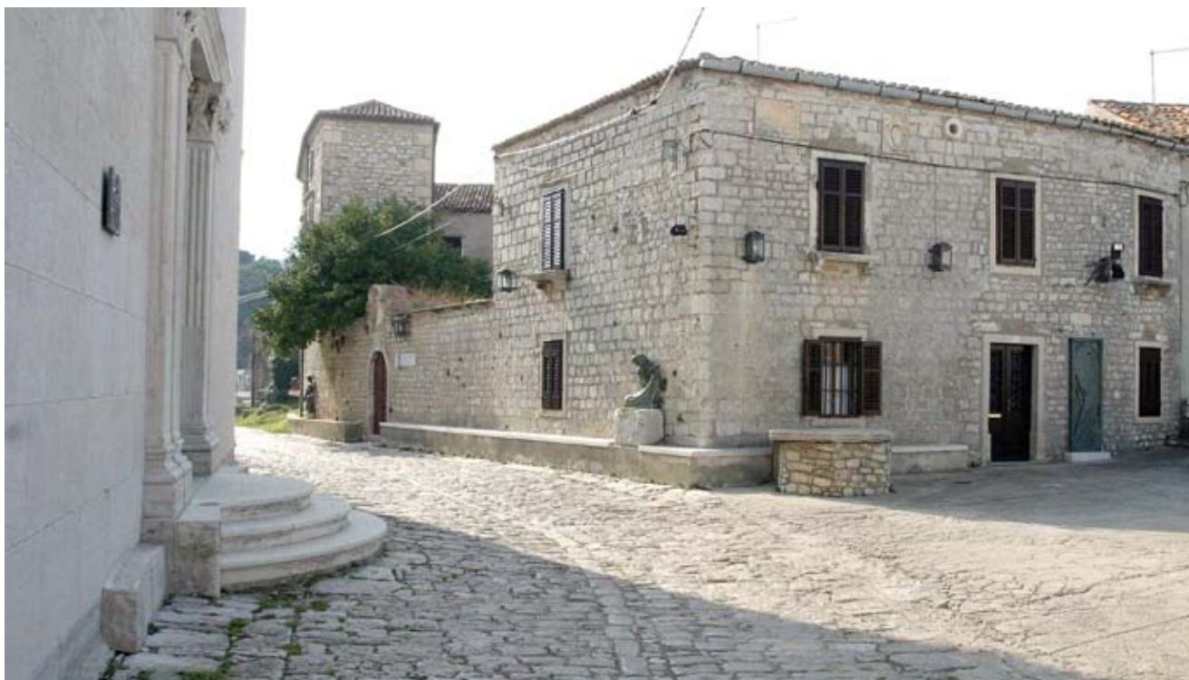
6. Biskupski dvor, južno krilo Episcopal Palace, south wing

građevinu za smještaj svih sadržaja potrebnih osorskom kaptolu, kanonicima i vikarima koji su upravljali biskupijom u vrijeme odsustva biskupa. O raskoši toga zdanja svjedoči i inventar biskupske palače iz 1742. godine, pohranjen u Državnom arhivu u Veneciji, a koji je objavila Lovorka Čoralčić. 37 U popisu su navedene prostorije kompleksa: soba za primanje ( camera d'audienza ), kapela ( chiesola ), sakristija ( sacrestia ), veliki trijem ( portico grande ), dvorana ( sala ), pet prostorija knjižnice ( cinque librerie ), kuhinja ( anticusina, cusina ), predsoblje orijentirano prema trgu ( anticamera verso la piazza ), sobe, žitnica ( granaro ), više podrumskih prostorija i spremišta ( caneva, magazzino ), vrt ( orto ). O namjeni dijelova kompleksa svjedoče i natpisi na nadvratnicima u unutarnjem dvorištu ( ERGASTVLUM, CANCELLERIA EPISCOPALIS ).