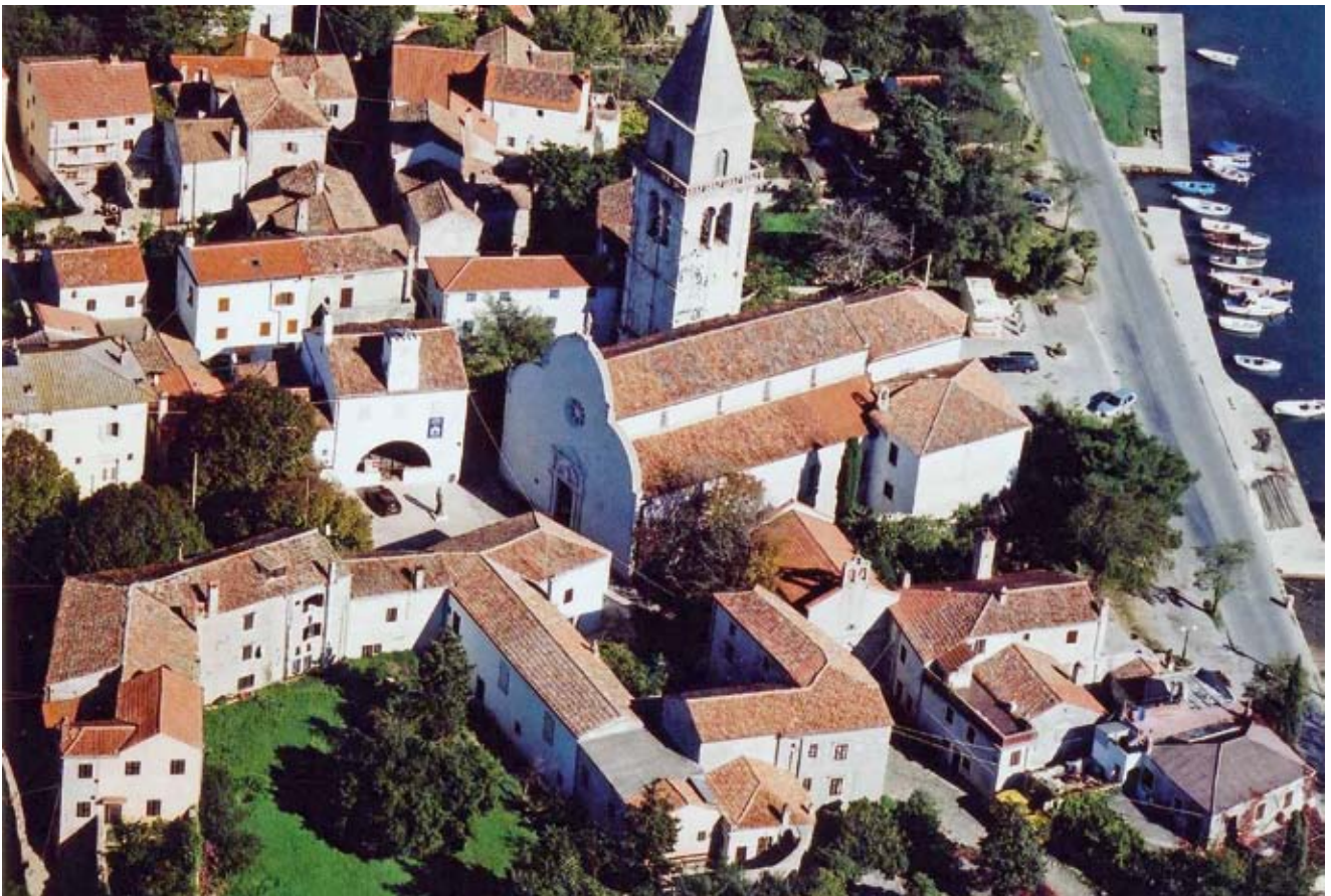
5. Zračna fotografija jugozapadnog dijela Osora s kompleksom biskupskog dvora, katedralom i gradskom vijećnicom

Osorski biskupi bili su venecijanski crkveni dostojanstvenici i rijetko su boravili u Osoru, pa je u vrijeme biskupa Marka Nigrisa osnovan i kolegijalni kaptol u Cresu. Ipak, u Osoru je bilo potrebno osigurati dovoljno veliku