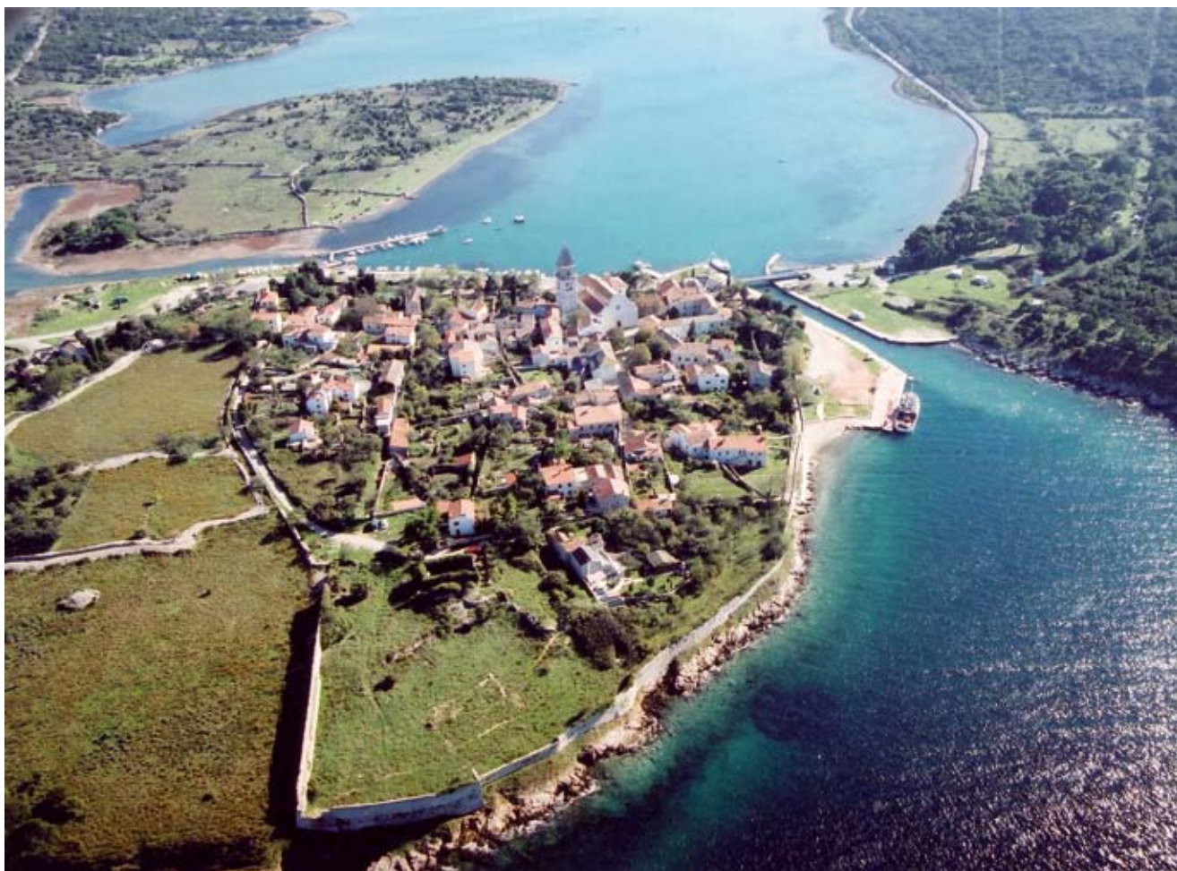
1. Zračna fotografija Osora, pogled sa sjevera Aerial photo of Osor, view from the north

Osor. 6 Ipak, izuzev najpoznatijeg poduhvata izgradnje nove katedrale, druga se kasnogotička i renesansna graditeljska ostvarenja u Osoru do sada nisu podrobnije razmatrala, što zbog skromne očuvanosti, što zbog duboko ukorijenjena stava da je razdoblje od 15. stoljeća nadalje samo epilog vebne osorske povijesti. Tako je izostala i osnovna analiza gradogradnje pa je Osor i dalje slabo poznat kao povijesna urbana cjelina.