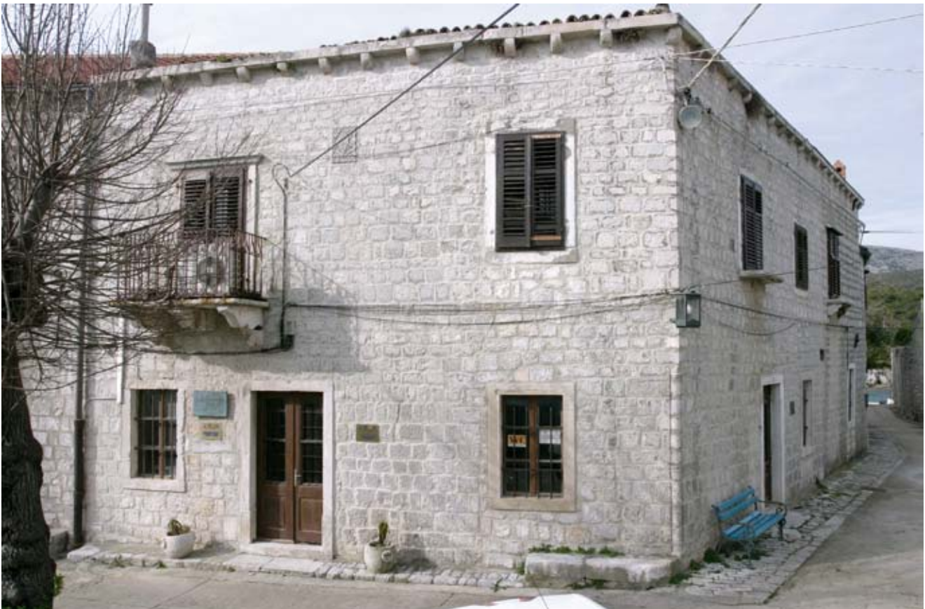
8. Biskupski dvor, sjeveroistočni ugao Episcopal Palace, north-east corner

Sudeći prema gabaritima i pravilnom tlocrtu, spomenuta građevina (k. č. 1 prve katastarske izmjere) s tro-