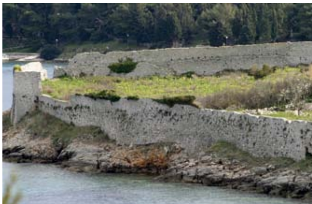
2. Osorski bedem, spoj sjeverozapadnog s poprečnim zidom iz 16. stoljeća

Fortifications at Osor, the junction between the north-west wall and the transversal sixteenth-century wall