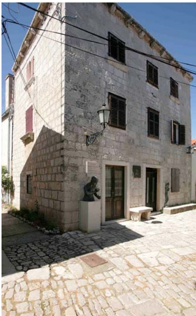
12. Kuća Draža u Osoru Draž House at Osor

Uz sjeverni rub osorske glavne ulice smješten je gradski palazzetto stare osorske plemićke obitelji Draža (sl. 12), 58 građen od pravilno klesanih kamenih kvada-