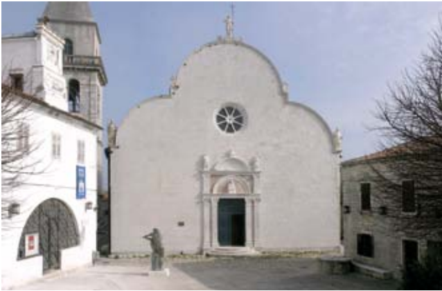
4. Osorski trg, pogled na gradsku vijećnicu, katedralu i biskupski dvor Osor town square, view towards the town hall, cathedral and Episcopal Palace

Izuzev katedrale i vijećnice, trg najvećim dijelom definiira veliki kompleks biskupske palače koji zauzima jedan gradski blok zatvarajući trg sa zapadne strane cijelom dužinom. Smještajem sjeverno od katedrale, uz bedem, te