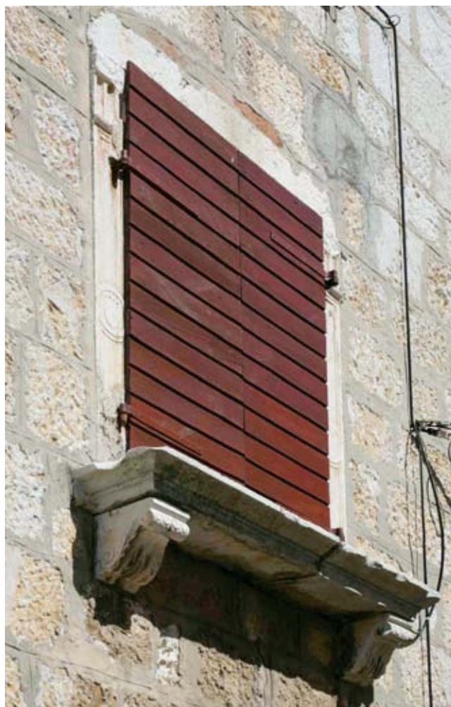
13. Kuća Draža, detalj Draž House, detail

ra (k. č. 79 prve katastarske izmjere). Tragovi izvorne gotičke građevine čitljivi su u karakterističnu kamenom rasteretnom luku iznad južnoga uličnog portala. 59 U osi prizemnog portala, na katu, vidljivi su tragovi prezidavanja centralnog velika prozorskog otvora koji je vjerojatno osvijetljavao središnji salon. Iz renesansne faze očuvani su doprozornici prozora zapadnog pročelja ukrašeni ukkladama sa središnjim kružnim medaljonom u koji je upisan grb obitelji Draža. Kapiteli su ukrašeni u donjem dijelu ispunjenim niskim kanelirama. Profiliranu prozorsku klupčicu nose konzole u obliku voluta, s prednje strane ukrašene palmetom i motivom krljušti (sl. 13). Opisani elementi ponavljaju se na mnogim građevinama u Osoru, no kao sekundarno uzidani fragmenti. Na nižim stambenim građevinama koje okružuju palazzetto Draža ugrađeni su fragmenti lučnih završetaka otvora ukrašeni nizom niskih kanelira i