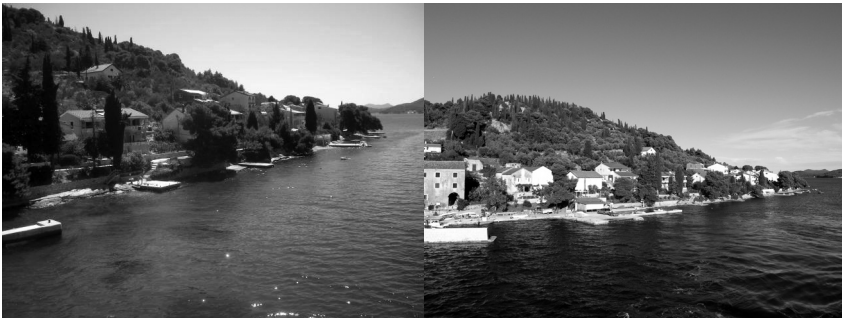
Slike 4. i 5. plaža „Ošljak-zapad“ u općini Preko