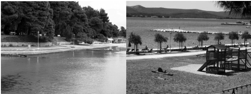
Slike 2. i 3. plaža „Iza Banja“ u općini Sveti Filip i Jakov