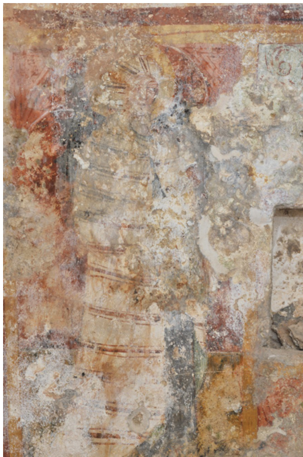
14. Prikaz oživjelog Lazara na jugozapadnom zidu svetišnjog traveja (fototeka HRZ-a, snimili J. Kliska i N. Vasić, 2012.) Depiction of Lazarus resurrected on the southwest wall of the sanctuary bay (Croatian Conservation Institute Photo Archive, photo by J. Kliska and N. Vasić, 2012)

Specifičan problem u restauraciji zidnih slika crkve sv. Mateja u Prodolu bila je prisutnost iznimno tvrdih kalcitnih skrama uzrokovanih curenjem s krova koje smanjuju čitljivost prikazanih scena. Na istočnom zidu skrame su u tankom, gotovo prozirnom sloju, dok su one na oltarnom zidu debljine od 5 do 7 milimetara. Probe čišćenja pokazale su da se kombinacijom ručnog i električnih alata samo pojedini, tanji slojevi naslaga mogu potpuno ili djelomično ukloniti. Sličan su primjer dijelovi zapadnog zida, na kojem je oslik pod tankim kalcitnim slojem, što daje dojam bijele maglice koja nestaje vlaženjem zida. Najveći je problem ipak bilo čišćenje debljih slojeva skrame pod