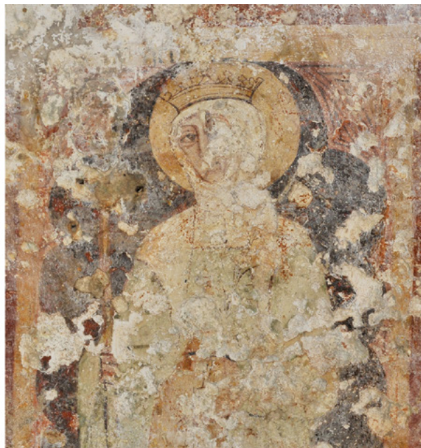
12. Detalj zidnog oslika s prikazom sv. Jelene, prije i tijekom čišćenja Detail with the depiction of St. Helen, before and during the cleaning

Jurja Starog u Plominu, sv. Katarine u Savičenti, sv. Martina u Svetom Lovreču, sv. Marije na Lokvi u Gologorici, sv. Martina u Bermu i sv. Katarine u Lindaru. Iduća će istraživanja jasnije definirati uloge pojedinih radionica te provenijenciju njihova stila i predložaka, čime će se razjasniti i upotpuniti saznanja o istarskom zidnom slikarstvu i tako bolje objasniti specifična likovna i ikonografska rješenja. Tek će se tada moći kritički valorizirati Fučićeva teza o venecijanskim obilježjima slika u crkvi sv. Mateja. 42