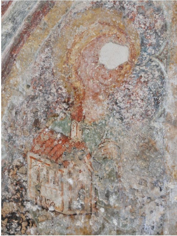
7. Detalj prikaza sveteice s modelom crkve u ruci, nakon čišćenja oslika Detail depicting a female saint carrying a model of the church, after cleaning the wall painting