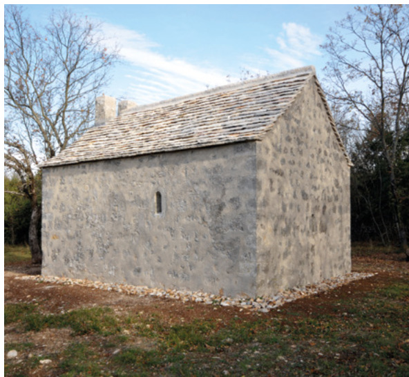
3. Prodol, pogled na crkvu sv. Mateja s jugozapada, stanje 2012. Prodol, view of St. Matthew's church from the southwest, situation in 2012

na periferiji Labina (sl. 4, 5 i 6) kojoj je u 17. stoljeću na pročelju dograđena lopica. 19 Tradicija dugog zadržavanja pojedinih arhitektonskih elemenata tipična je za periferne sredine u kojima se nova rješenja sporije usvajaju i stoga ne iznenađuju romanički oblici na građevini podignutoj početkom 15. stoljeća. Uz zidove podijeljene pilastrima i pojasnice, kod prodolske crkve sv. Mateja treba istaknuti i malene uske prozore čiji su polukružni nadvoj prozora južnog zida i tek blago zašiljeni nadvoj prozora istočnog zida izvedeni od jednog kamenog bloka, poput onih na crkvi sv. Nikole.