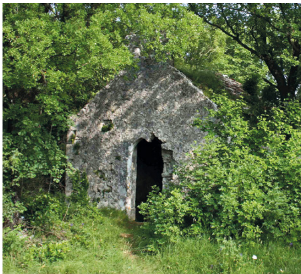
2. Prodol, Crkva sv. Mateja obrasla vegetacijom, stanje 2005. Prodol, church of St. Matthew overgrown in vegetation, situation in 2005