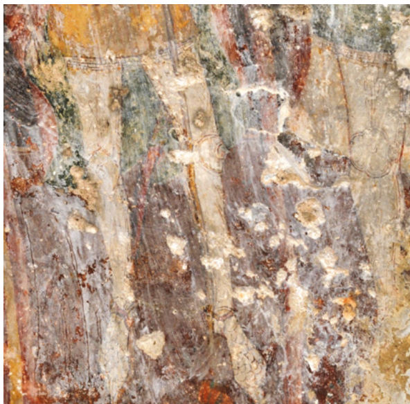
15. Detalj viteškog oklopa na likovima u gornjem registru jugozapadnog zida svetišnjog traveja (fototeka HRZ-a, snimili J. Kliska i N. Vasić, 2012.) Detail of knights' armours on figures in the upper section of the southwest wall of the sanctuary bay (Croatian Conservation Institute Photo Archive, photo by J. Kliska and N. Vasić, 2012)