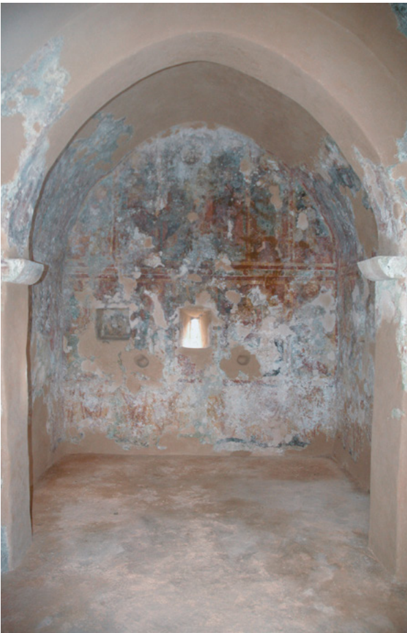
5. Prodol, crkva sv. Mateja, pogled prema svetištu Prodol, church of St. Matthew, view of the sanctuary