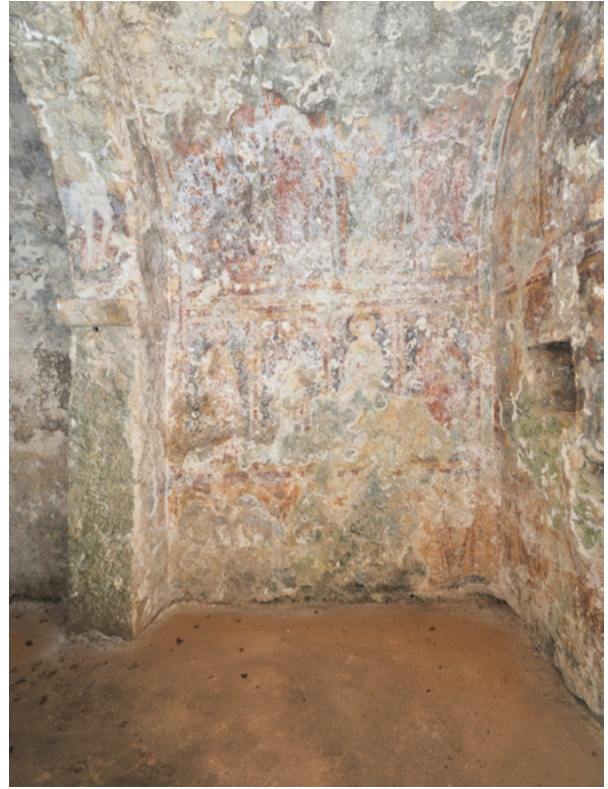
8. Oslik istočnog zida svetišnjog traveja nakon čišćenja Wall painting on the east wall of the sanctuary bay, after cleaning the wall painting