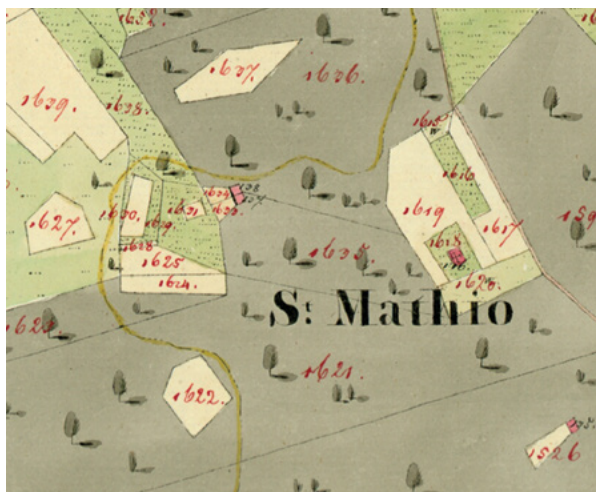
1. Prodol, detalj franciskanskog katastarskog plana s ucrtanom crkvom sv. Mateja, 1820. (Archivio di Stato di Trieste, Catasto franceschino, Mappa catastale del Comune di S. Lucia di Albona foglio VIII, sezione VIII, 453 B o8) Prodol, detail of the Franciscan cadastral plan with the church of St. Matthew marked, 1820. (Trieste State Archives, Franciscan cadaster, Mappa catastale del Comune di S. Lucia di Albona, folio VIII, section VIII, 453 B o8)