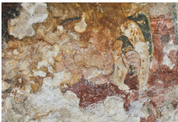
13. Detalj prikaza Djeteta s pticom u rukama Detail depicting the Child holding a bird, after cleaning the wall painting

Premda pojedina pitanja ostaju otvorena, sa sigurnošću možemo odbaciti atribuciju toga ciklusa Albertu iz Konstanza, koja je navedena u obrazloženju rješenja o