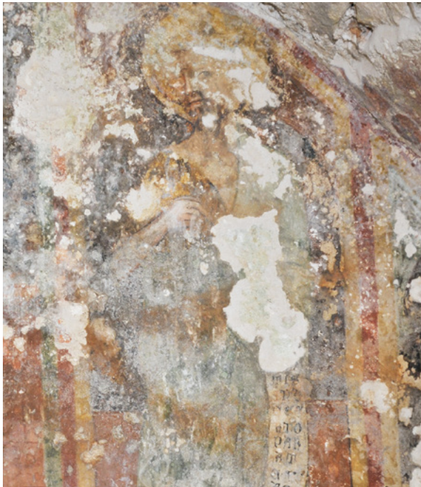
9. Prikaz sv. Ivana Krstitelja u gornjem registru svetišnjog zida, nakon čišćenja oslika Depiction of St. John the Baptist in the upper section of the sanctuary wall, after the cleaning