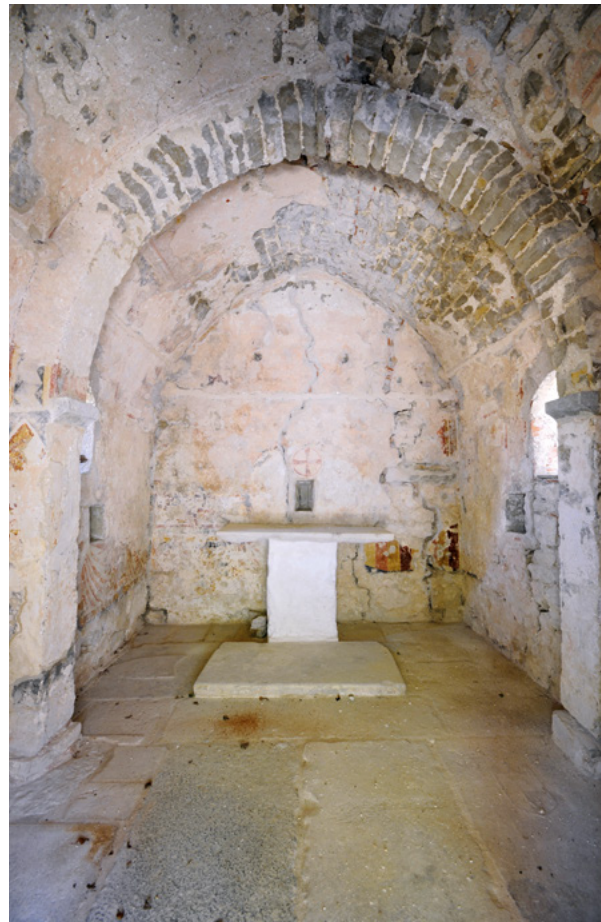
6. Labin, crkva sv. Marije Magdalene, pogled prema svetištu (fototeka HRZ-a, snimio T. Šaina, 2012.) Labin, church of St. Mary Magdalene, view of the sanctuary (Croatian Conservation Institute Photo Archive, photo by T. Šaina, 2012)

Jelena (sl. 12) te bradati svetac, možda sv. Andrija, sudeći prema vidljivim slovima na borduri iznad niše. U gornjem, teže oštećenom registru prikazani su sveci s knjigama u rukama. Trećeg slijeva prepoznajemo kao sv. Petra jer mu se u ruci nazire ključ dok bi ostali mogli biti evanđelisti ili crkveni oci. Iznad imposta toga zida nalazi se lik sv. Jurja u oklopu, koji kopljem probada zmaja.