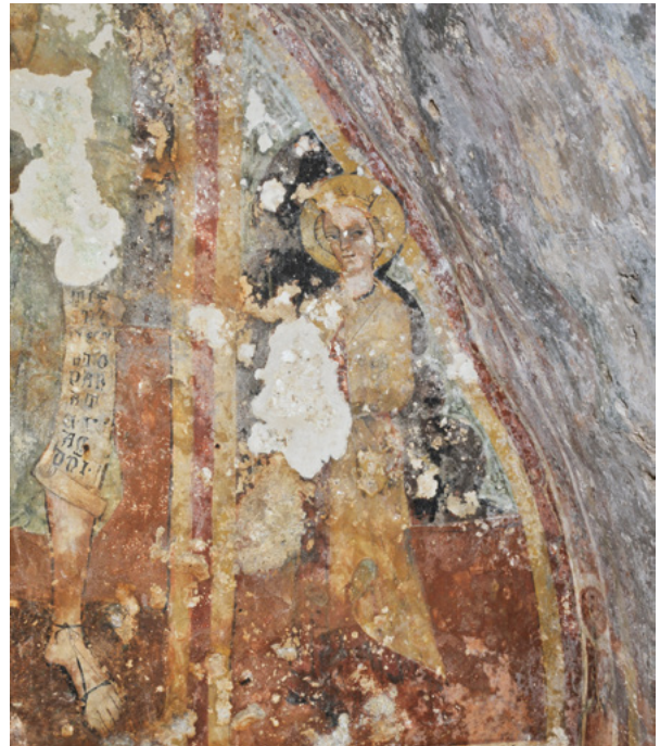
10. Prikaz sv. Apolonije u gornjem registru svetišnjog zida, nakon čišćenja oslika (fototeka HRZ-a, snimili J. Kliska i N. Vasić, 2012.) Depiction of St. Apolonia, condition after the cleaning (Croatian Conservation Institute Photo Archive, photo by J. Kliska and N. Vasić, 2012)