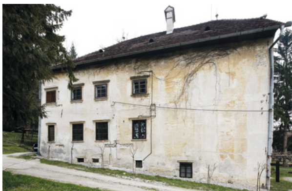
8. Bočno zapadno pročelje, današnje stanje Side west façade, present condition