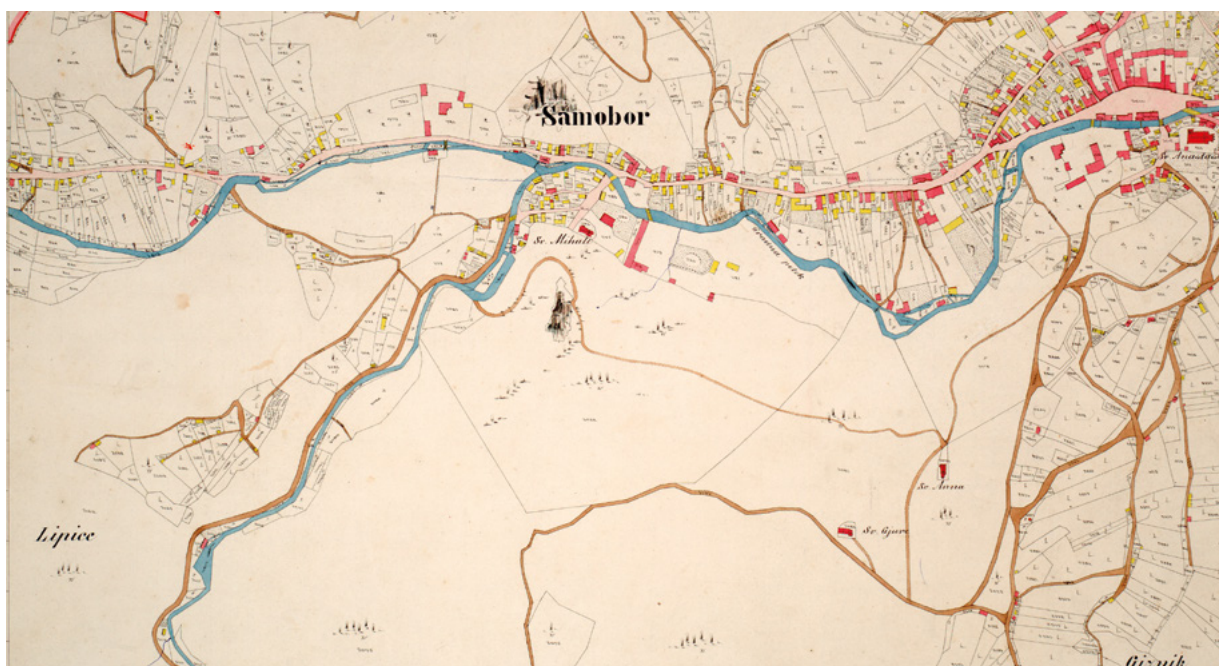
3. Isječak iz katastarskog lista Samobora, br. 8, 1861. (HDA, DGU, inv. br. 1421) Excerpt from the cadastral plan of Samobor, no. 8, 1861 (Croatian State Archives, State Geodetic Administration, inv. no. 1421)