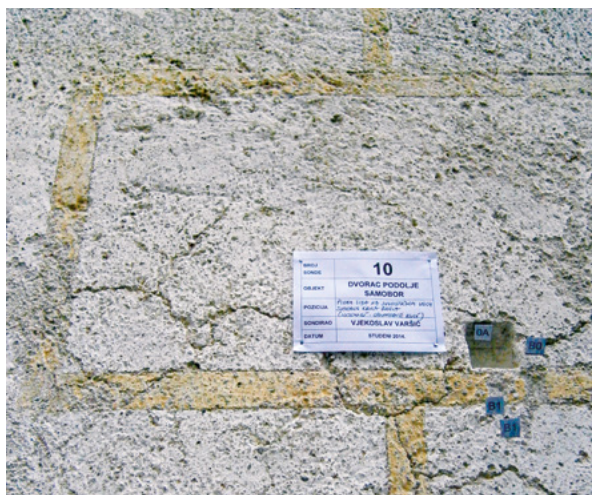
16. Sonda s oslikom s kraja 17. stoljeća Probe with a late-17th-century mural