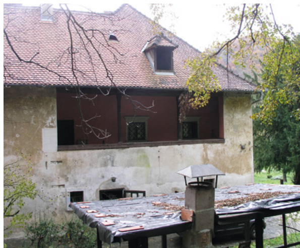
7. Loda, današnje stanje (snimio Z. Bogdanović, 2014.) Rear north façade, present condition (photo by Z. Bogdanović, 2014)

Prestankom turske opasnosti, obrambena funkcija Podolja ustupa mjesto stambenoj namjeni, dok je prijelazno razdoblje čini se obilježeno korištenjem Podolja i za ubiranje tridesetnice. Prema citiranom rukopisu Milana Praunspergera, obitelj Szaich de Pernicza postaje vlasnikom Podolja godine 1633. kad joj ga dodjeljuju vlasnici Staroga grada – obitelj Erdödy. 9 Prema istom izvoru, najraniji spomen te obitelji u Samoboru potječe iz 1568. kad se u jednoj samoborskoj listini navodi Martin Szaich. 10 Riječ je o najstarijem pripadniku roda Szaich od kojeg potječu svi kasniji plemeniti Szaichi, a njegov sin Martin (1600. – 1649/51.) postaje službenik i družbenik – „familiaris“ grofova Erdödy. 11 Milan Praunsperger piše da su Erdödyjevi bogato nagrađivali Szaiche, a isto dokazuju izvori koje navodi Pavao Maček. 12 Rudolf Strohal donosi niz isprava iz razdoblja od 1590. do 1648. koje se odnose na Martina Szaicha (otac i sin) kojima se kupuju razne zemlje u Samoboru. 13 Važna je isprava iz 1641., kojom Eli-