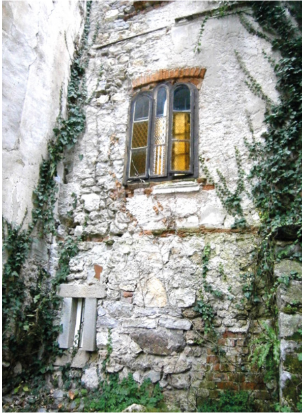
19. Pročelje stubišnog volumena dograđenog sredinom 19. stoljeća, današnje stanje Front of the staircase block built in the mid-19th century, present condition