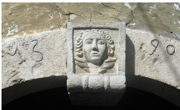
13. Zaglavni kamen glavnog portala s godinom 1590.

Keystone from the main portal with the year 1590