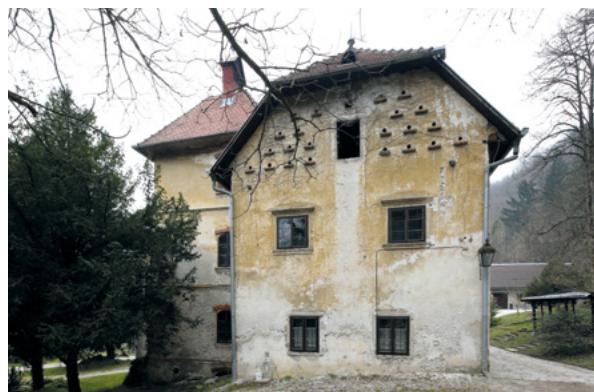
9. Bočno istočno pročelje, današnje stanje Side east façade, present condition