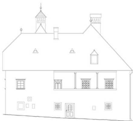
6. Stražnje sjeverno pročelje (arhitektonska snimka Z. Horvat, 1988., dorada i digitalizacija, R. Cottiero, 2014.) Rear north façade (architectural drawing by Z. Horvat, 1988, digitalization R. Cottiero, 2014)