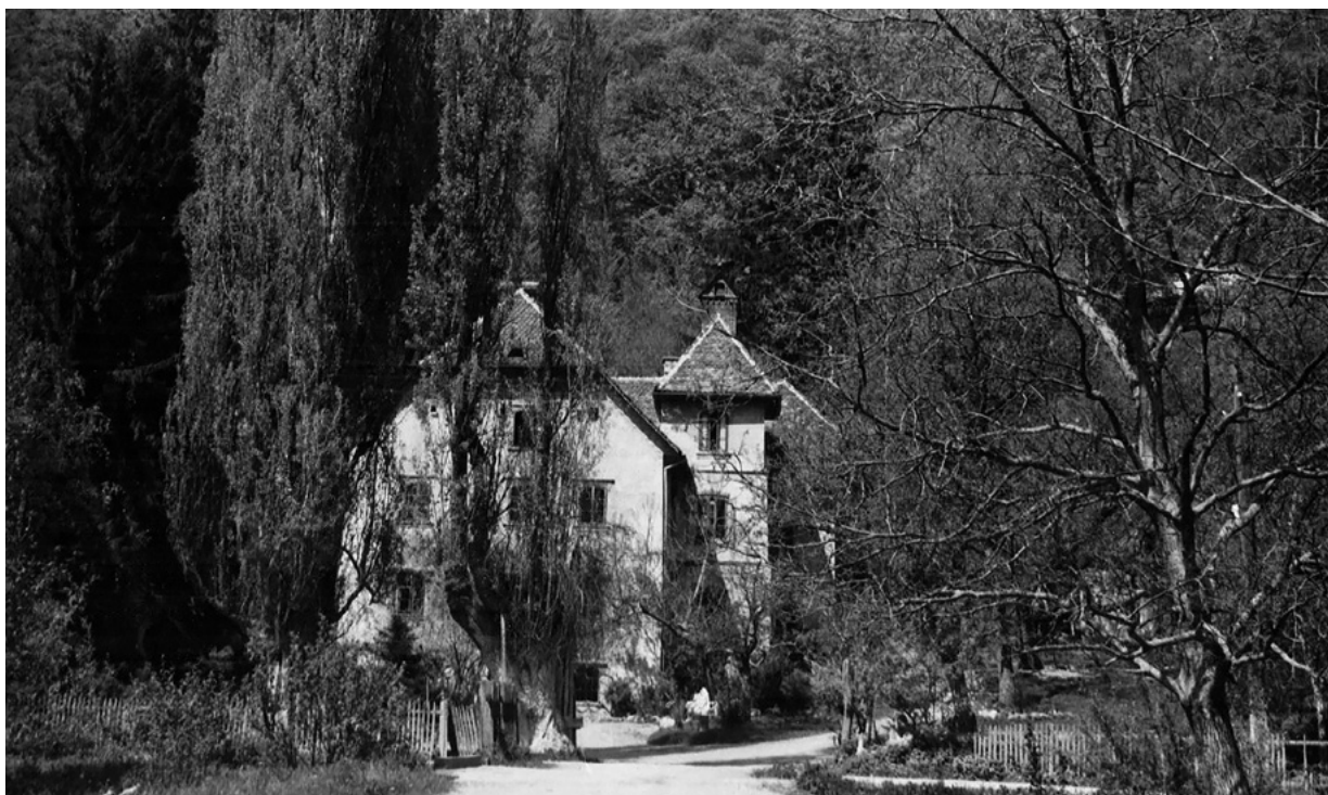
1. Pogled na dvorac Podolje (Praunsperger Bošnjak), šezdesete godine 20. stoljeća The Podolje (Praunsperger Bošnjak) Mansion in Samobor, 1960s

Stoga su tijekom studenoga 2014. godine restauratorska istraživanja provedena na svim vanjskim zidovima dvorca, kako na pretpostavljenim mjestima određenih građevinskih promjena tako i na karakterističnim pozicijama pročelnog oblikovanja (Vjekoslav Varšić, Izvješće o konzervatorsko restauratorskim istraživačkim radovima provedenima na pročeljima dvorca Podolje/Bošnjak Praunsperger, studeni 2014.), a s ciljem utvrđivanja geneze dvorca kao i pročelnog oblikovanja svake faze. Nalazi navedenih restauratorskih istraživanja dovedeni su u vezu s dostupnim povijesnim podacima o dvorcu kao i njegovim arhitektonsko-oblikovnim osobinama, iz čega je proizašla konzervatorska interpretacija građevnog rasta i razvoja. Treba napomenuti da su neka pitanja i dalje otvorena te da bi daljnja sondiranja interijera mogla dati konačne odgovore. Ovom prilikom istražen je dio dostupne arhivske građe, prije svega obiteljski fondovi Szaich de Pernicza i Praunsperger (Hrvatski državni arhiv), kao i rukopisna ostavština obitelji Praunsperger koja je u vlasništvu obitelji, analizirani su kartografski izvori te dakako relevantna stručna i znanstvena literatura. Razlog provedenoga istraživanja i izrade konzervatorske studije zapravo je stručna priprema za izradu prijedloga prezentacije pročelja, odnosno projekta obnove dvorca.