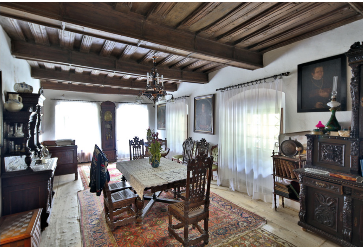
12. Katna prostorija „palača“, druga polovica 17. stoljeća The first-floor “main-room”, second half of the 17th century