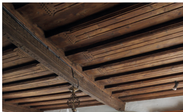
14. Grednik s urezanim 1696. godinom u katnoj prostoriji nekadašnje kule

Keystone from the main portal with the year 1590