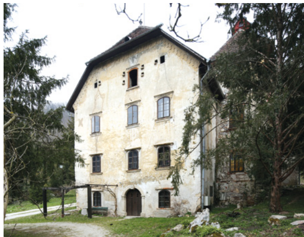
5. Glavno južno pročelje, današnje stanje Main south front, present condition