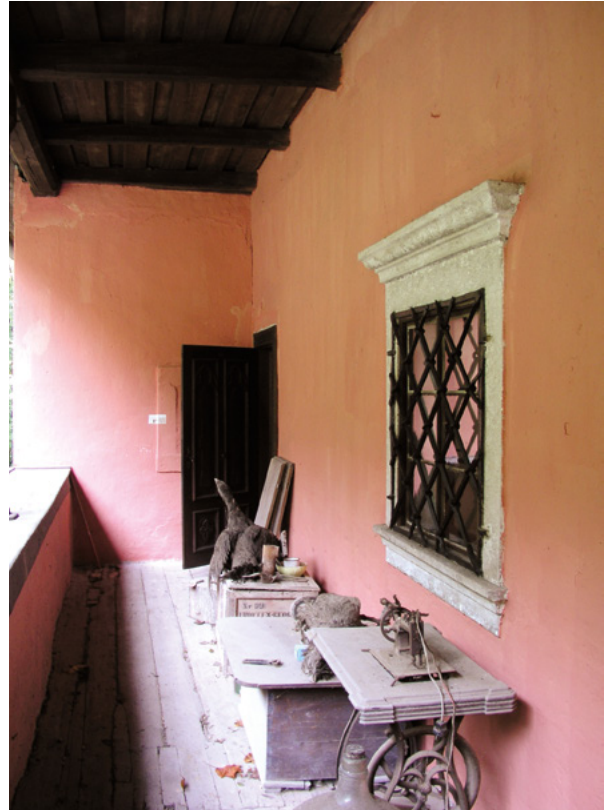
20. Kasnorenesansni prozor sjevernog pročelja (snimila V. Jakaša Borić, 2014.) Late Renaissance window in the north façade (photo by V. Jakaša Borić, 2014)

arhitekture, kao i intervencije koje se tada poduzimaju na starijim građevinama. 46 Iz istog vremena potječe kompletna vratna stolarija interijera oblikovana u duhu neogotike, uključujući vratnice tada rastvorenog vratnog otvora prema balkonskoj lođi.