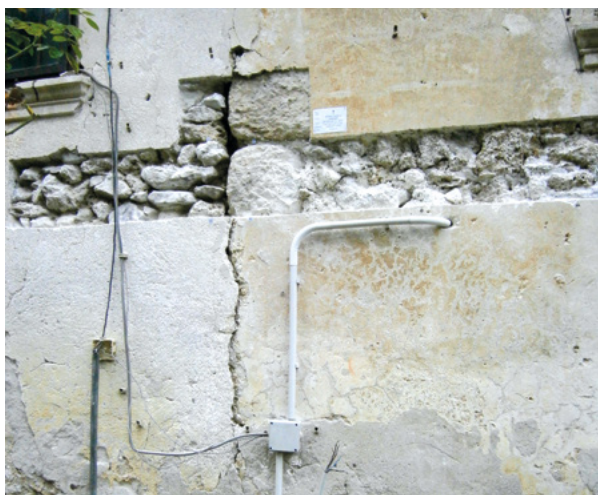
15. Sonda br. 7 na zapadnom pročelju Probe no. 7 on the west façade