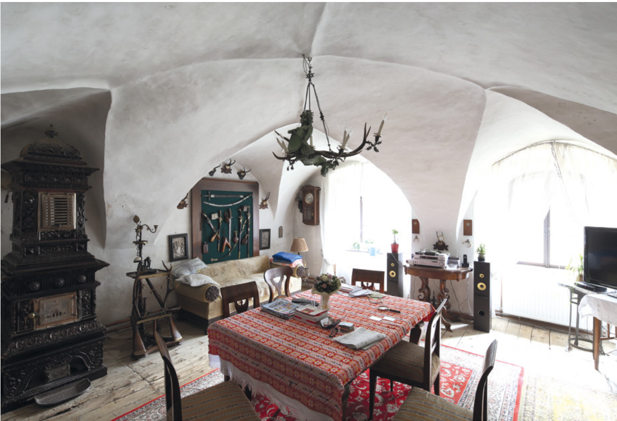
11. Prostorija prvoga kata s rijetkim tipom grebenastog svoda iz 16. stoljeća First-floor room with a rare type of vault from the 16th century