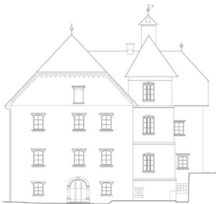
4. Glavno južno pročelje (arhitektonska snimka Z. Horvat, 1988., dorada i digitalizacija, R. Cottiero, 2014.) Main south front (architectural drawing by Z. Horvat, 1988, digitalization R. Cottiero, 2014)