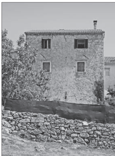
SL. 4. GRAČIŠĆE, POGLED NA ZAPADNE ZIDINE, K.Č. 105/2 I 1* FIG. 4. GRAČIŠĆE, VIEW OF THE WEST WALLS, CADASTRAL PLOT 105/2 AND 1*

Gračišće u 14. i 15. stoljeću (Sl. 6.) – Gračišće ulazi u sastav Pazinske knežije 1342. godine, a 1374. zajedno s ostatkom Knežije dolazi pod vlast Habsburgovaca. Naselje se u povijesnim izvorima spominje kao jači komun obzidan bedemima. 21 Na sjevernome rubu naselja, na gradskim zidinama, u 14. stoljeću sagrađena je crkva sv. Pankracija. Ispred crkve uspostavlja se manji trg okružen stambenim kućama. S obzirom na to da je crkva izgrađena na bedemima, zaključak je da su bedemi sagrađeni prije crkve, još početkom 14. stoljeća. 22 Na kući na k.č. 1* i 105/2 u prizemlju je s vanjske strane gradskih zidina vidljiva puškarnica, koja obilježjima odgovara puškarnicama na zidinama nastalim od 12. do 14. stoljeća 23 (Sl. 4.). U isto razdoblje u Gračišću je moguće smjestiti sklop gradskih vrata sa po dvije bočne kule i propugnakulom. Postojanje propugnakula potvrđuje model Gračišća iz prve polovice 17. stoljeća, na kojem je on jasno prikazan (Sl. 3.). Na prostoru ispred glavnoga ulaza u naselje gradi se 1381. godine crkva sv. Antuna, koja je već u sljedećem stoljeću adaptirana i uklopljena u biskupsku rezidenciju. Na jugoistočnom rubu naselja 1383. godine dovršava se gradnja crkve sv. Eufemije. 24