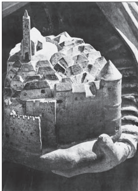
SL. 3. MODEL GRAČIŠĆA S OLTARA IZ 1633. GODINE FIG. 3. SCALE MODEL OF GRAČIŠĆE, ALTAR, 1633

tolcrt s najvišom točkom na kojoj se nalazi župna crkva sv. Vida, Modesta i Kresencije te najnižom točkom na kojoj su glavna gradska vrata. U srednjem vijeku bilo je okruženo zidinama s kulama (Sl. 5.). Od glavnog ulaza u naselje jedna se ulica odvaja prema crkvi sv. Vida, Modesta i Kresencije, sjevernome dijelu grada i manjemu trgu na sjeverozapadnom rubu naselja s crkvom sv. Pankracija. Druga ulica od gradskih vrata vodi južno prema ljevakostomu velikom gradskom trgu. Na ulazu u trg smještena je crkva sv. Marije na Placi. Crkva sv. Antuna, biskupska kapela, nalazi se nasuprot crkvi sv. Marije, na zapadnome rubu trga. S trga je moguća komunikacija do crkve sv. Eufemije na jugoistočnom rubu naselja i prolazom ispod biskupske kapele prema sjeveroistočnom dijelu naselja i crkvi sv. Vida, Modesta i Kresencije.