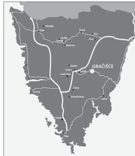
SL. 2. SMJEŠTAJ GRAČIŠĆA U ISTRI FIG. 2. LOCATION OF GRAČIŠĆE IN ISTRIA

Urbanistički ustroj Gračišća – Današnja povijesna jezgra Gračišća ima izdužen ovalni