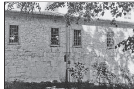
SL. 18. GRAČIŠĆE, CRKVA SV. VIDA, IZVADAK IZ FOTOGRAMETRIJSKE SNIMKE JUŽNOG ZIDA CRKVE SV. VIDA I POGLED NA NJEGA U VRIJEME GRAĐEVINSKIH RADOVA FIG. 18. GRAČIŠĆE, CHURCH OF ST VID, SEGMENT OF THE PHOTOGRAMMETRIC IMAGE OF THE SOUTH-FACING WALL AND VIEW OF THE SOUTH-FACING WALL DURING CONSTRUCTION WORKS

čime se definira jedno od glavnih urbanističkih obilježja Gracišća. U naselju se ruši biskupska palača i započinje proces premještanja glavnog gradskog trga.