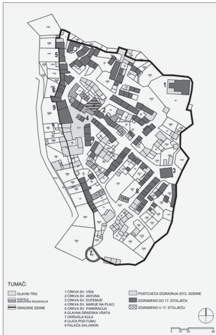
SL. 8. GRAČIŠĆE, NASELJE U 17. ST. FIG. 8. GRAČIŠĆE, SETTLEMENT IN 17 TH C.

sklop palače uključena je već postojeća kapela sv. Antuna, koja je tom prilikom i znatnije preuređena. 27 Ulaz je u kapelu iz natkrivenoga prolaza koji omogućava prolaz s glavnog trga prema crkvi sv. Vida. Kapela se danas nalazi unutar bloka kuća, no na sjevernom uglu vidljivi su vežnjaci na koje se nastavljao zid biskupske palače pa je moguće pretpostaviti i položaj palače unutar naselja. O položaju palače uz kapelu govori veća prazna parcela na k.č. 1341/5 koja bi odgovarala markici palače. Na istočnom uglu sačuvan je ulaz u zvonik koji je također bio dio sklopa palače (Sl. 12.).