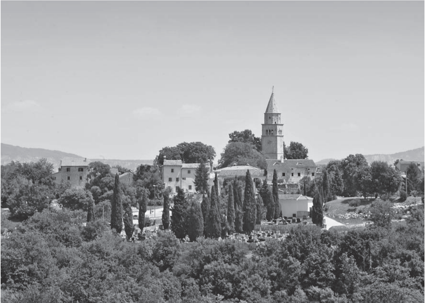
Sl. 1. GRAČIŠĆE, PANORAMA Fig. 1. GRAČIŠĆE, PANORAMA