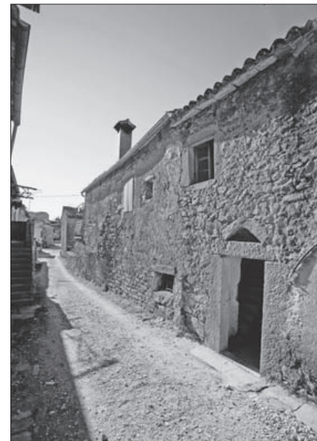
SL. 15. GRAČIŠĆE, PALACA SALAMON, ISTOČNO PROČELJE FIG. 15. GRAČIŠĆE, SALAMON PALACE, EAST ELEVATION