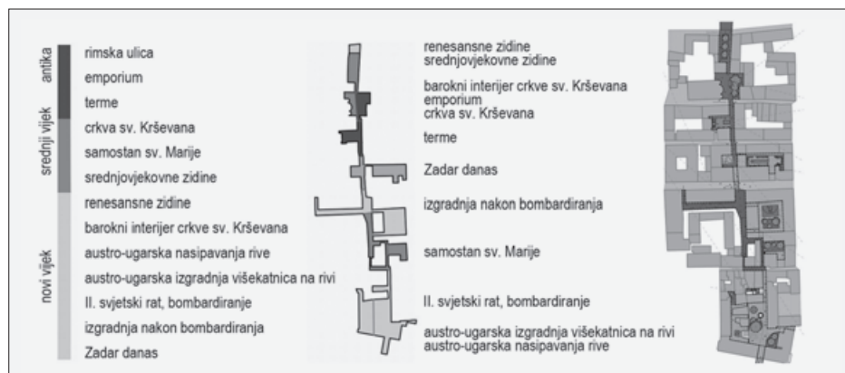
SL. 3. REKONSTRUKCIJA PUVIJSNE ULICE KAO NOVE TURISTIČKE ATRAKCIJE ZADARSKOGA POLUOTOKA: PRIKAZ VREMENSKE LENTE I PROJEKTA

FIG. 3. RECONSTRUCTION OF A HISTORIC STREET AS A NEW TOURIST ATTRACTION OF ZADAR: CHRONOLOGICAL CHART AND PROJECTS