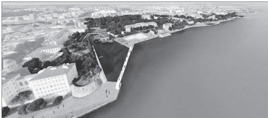
SL. 4. DEFORTIFIKACIJA ZADRA I POVEZIVANJE POLUOTOKA S OSTALIM DIJELOVIMA GRADA: LUKA FOŠA