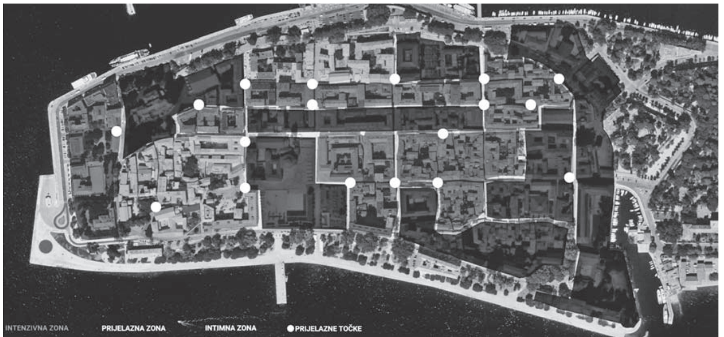
SL. 1. PRIKAZ INTERESA RAZLIČITIH KORISNIKA ZADARSKOGA POLUOTOKA: NAJČEŠĆI CILJEVI KRETANJA STANOVNIKA ŽADRA, TURISTA, KAO I STANOVNIKA OKOLNIH OTOKA KOJI DOLAZE CILJANO U ŽADAR, NA POLUOTOK, OBAVITI NEKU OD SVOJIH POTREBA (OZNAČENE INTENZIVNA, PRIJELAZNA I INTIMNA ZONA TE PRIJELAZNE TOČKE)