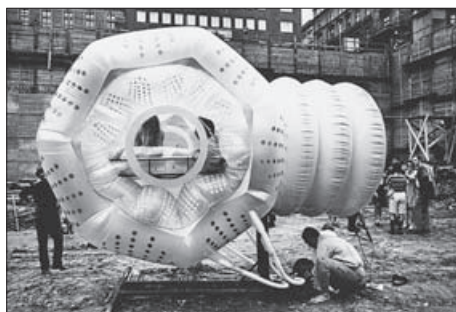
FIG. 3. MOBILE ARCHITECTURAL OBJECT OF POP CULTURE AESTHETICS: THE GROUP HAUS-RUCKER-CO, GELBES HERZ INSTALLATION, VIENNA, 1968

Ideja o novom pristupu istraživanju tijekom 60-ih godina 20. stoljeća ulazi i u umjetnički diskurs. Koncept 'istraživanja u umjetnosti' ( pratica artistica come la ricerca ) postavio je Giulio Carlo Argan. 12 Prema Arganu pojam se odnosi na mogućnost umjetnosti da postavlja i rješava određene probleme, pri čemu se istraživanje vidi kao 'otvoreni proces' u sklopu kojeg umjetnički koraci nisu predvidivi. Arganov 'otvoreni proces' rada analogan je tumačenju ideje 'otvorenog djela' ( opera aperta ) Umberta Eca, kojim je Eco pokušao riješiti problem statusa netipičnoga i eksperimentalnoga umjetničkoga djela neoavangardi.