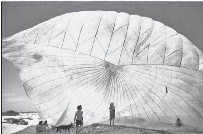
Sl. 5. DO IT YOURSELF ARHITEKTONSKI OBJEKT: GRUPA ANT FARM, INSTALACIJA DREAM CLOUD ON THE BEACH, TEKSAS, 1969.

FIG. 5. DO IT YOURSELF ARCHITECTURAL OBJECT: THE GROUP ANT FARM, INSTALLATION DREAM CLOUD ON THE BEACH, TEXAS, 1969