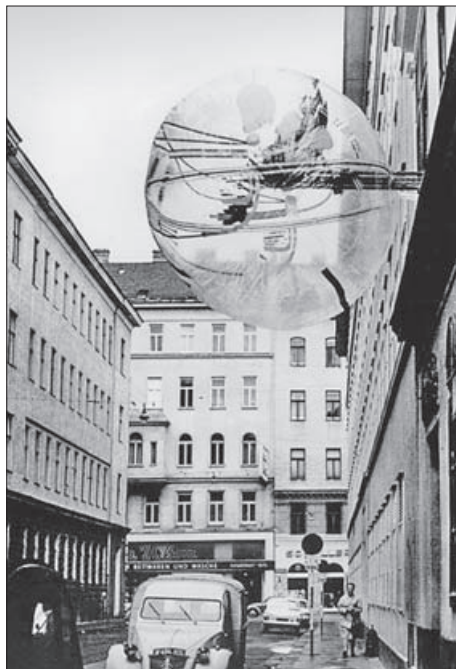
SL. 2. SPECIFIČNI SINTETIČKI REZERVAT: GRUPA HAUS-RUCKER-CO, INSTALACIJA BALLON FÜR ZWEI , BEC, 1967.

FIG. 2. SPECIFIC SYNTHETIC PRESERVE: THE GROUP HAUS-RUCKER-CO, BALLON FÜR ZWEI INSTALLATION, VIENNA, 1967