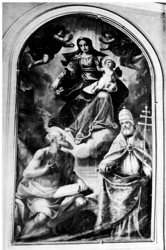
5. Baldassare d'Anna, Bogorodica sa svecima , župna crkva, Hum

specifičnu krunu na glavi Caterine Cornaro susrećemo na rapskoj, već spomenutoj paškoj slici, te na pali iz Izole, ali ovaj put na liku sv. Katarine.