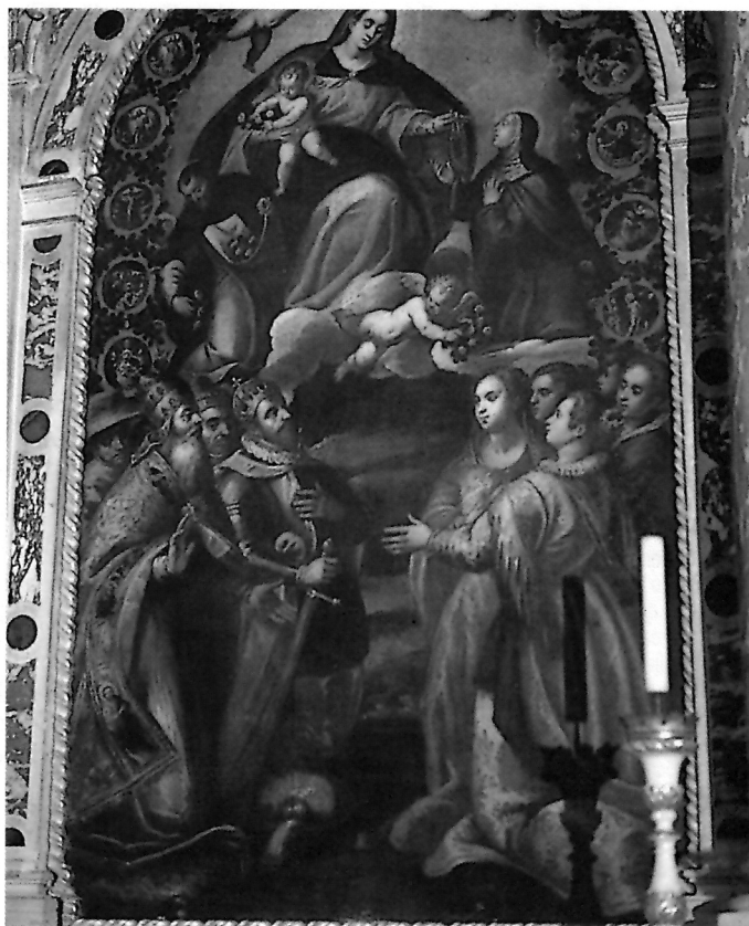
4. Nepoznati mletački slikar, Bogorodica od sv. Ružarija, dominikanska crkva, Stari Grad Hvar

jedne strane odriče prvoj d'Annino autorstvo, a, s druge, jasno ocrtava slikarske domete našeg autora: krutost, statičnost, plošnost, nedostatak osjećaja za proporcije i prostor, te izostanak svake dramaturgije radnje.