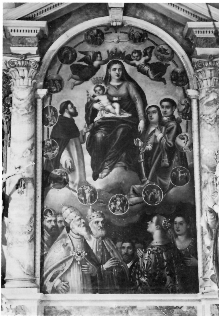
1. Baldassare d'Anna, Bogorodica od sv. Ružarija, župna crkva sv. Bartula, Roč

potpunosti preslikano, te ga atribuiru Veroneseovoj školi, 4 čini mi se upravo suprotno - izvorna faktura i kolorit vrlo su lijepo očuvani, napose u donjem dijelu pale kao i na Bogorodičinu liku i glavama svetaca, pa ću poslije pokušati obrazložiti da i oni podupiru atribuciju ovog djela Baldassaru d'Anniju, naročito ako ga se uspoređi s nekim drugim djelima istog slikara.