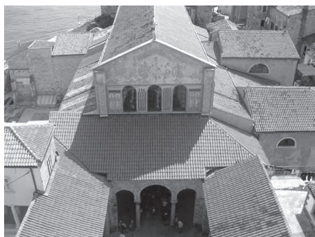
Slika 9. Eufrazijeva bazilika