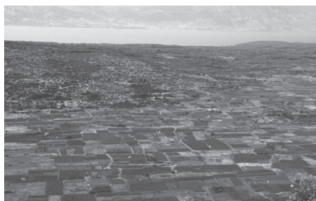
Slika 14. Starogradsko polje

Starogradsko polje na Hvaru upisano je u srpnju 2008. godine na Listu svjetske baštine kao sedmo hrvatsko dobro. Zauzima površinu od 1 376 53 ha.