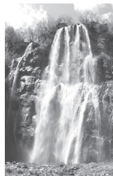
Slika 8. Veliki slap

Zadatak. Sedmi razred iz Karlovca posjetio je Nacionalni park Plitvička jezera. Saznali su da se na Plitvičkim jezerima nalazi najveći slap u Hrvatskoj, Veliki slap, visok 78 m. Ivana je visoka 156 cm i zanima je koliko je puta slap viši od nje. Pomozi Ivani!