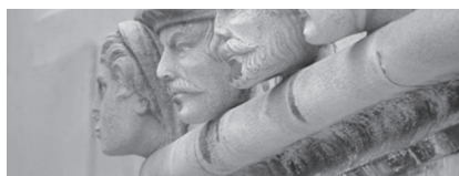
Slika 13. Skulpture glava na katedrali sv. Jakova

Katedrala ima oblik latinskoga križa. Duga je 38 metara, a široka 14 metara. Srednja lađa visoka je 19 metara, a kupola 31 metar. Jedina je katedrala u cijeloj Europi izgrađena isključivo od kamena, bez uporabe vezivne žbuke i drvenih konstruktivnih elemenata.