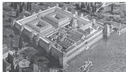
Slika 3. Rekonstrukcija Dioklecijanove palače po Hebrardu

Najveći dalmatinski grad, Split, smješten je između rijeka Žrnovnice na istoku i Jadra na zapadu. Split je ujedno drugi hrvatski grad po veličini. Godine 1979. Split je zajedno s Dioklecijanovom palačom upisan u UNESCO-ov registar svjetske baštine. Grad je nastao za vrijeme cara Dioklecijana koji je 295. godine započeo s gradnjom velebne palače.