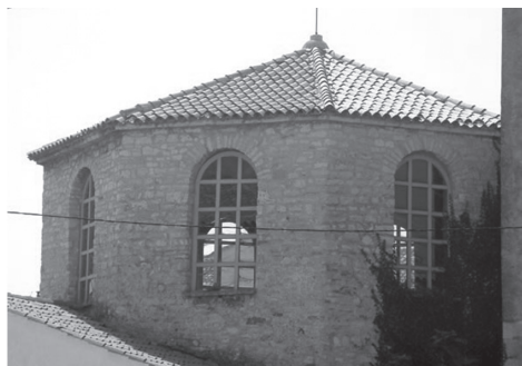
Slika 10. Krstionica Eufrazijeve bazilike

Zadatak. Krstionica Eufrazijeve bazilike ima tlocrt oblika pravilnog osmerokuta. Duljina jedne stranice osmerokuta iznosi 6 anđeoskih lakata, a radijus kružnice opisane tom osmerokutu iznosi 5 anđeoskih lakata. Kolika je površina tlocrta krstionice? Anđeoski lakat, mjerna jedinica za duljinu, 7 je puta dulji od dlana, a jedan dlan iznosi 7.5 cm.