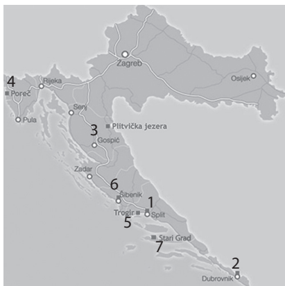
Slika 2. Kulturna baština Hrvatske

Zadatak. Koliki udio od ukupnog broja svjetske baštine koja je pod zaštitom UNESCO-a čini hrvatska kulturna baština?