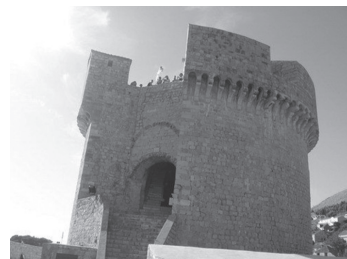
Slika 5. Kula Minčeta

Dobro očuvano povijesno središte grada Dubrovnika štite gradski bedemi koji su na popisu UNESCO-ove svjetske kulturne baštine od 1979. godine. Građeni su od 13. do 17. stoljeća za potrebe obrane. Bedemi su dugi 1940 m, visoki do 25 m, prema kopnu debljine 4 – 6 m, a prema moru 1.5 – 3 m. Na sve četiri strane svijeta zidine su zaštićene kulama: kula Minčeta, kula Bokar, utvrda Sv. Ivan, tvrđava Revelin. Na glavnom zidu postoji ukupno 16 kula, 3 utvrde 1 i 6 bastiona 2 . Sa zidina se pruža neopisiv pogled na Jadransko more. Šećući zidinama mogu se otkriti neka mjesta skrivena u mreži ulica na koja nikada ne biste naletjeli šećući gradom.