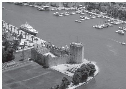
Slika 11. Kula Kamerlengo

Trogir su osnovali grčki kolonisti s otoka Visa u 3. st. pr. Krista. Trogir oduševljava posjetitelje kulturno-povijesnim spomenicima i uskim ulicama te umjetničkim zbirka s brojnim remek-djelima. Među znamenitostima grada Trogira su: Katedrala sv. Lovre s Radovanovim portalom, kula Kamerlengo, Gradska vrata, palača Čipiko, Gradska vijećnica, crkva sv. Nikole sa zbirkom umjetnina „Kairos”, Muzej grada, Pinakoteka, te mnoge druge znamenitosti.