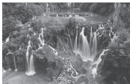
Slika 7. Nacionalni park Plitvička jezera

Najveći, najstariji i najposjećeniji hrvatski nacionalni park, Plitvička jezera, proglašen je nacionalnim parkom 8. travnja 1949. godine.