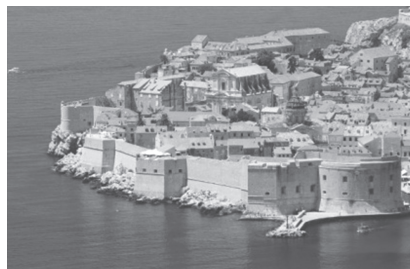
Slika 6. Stari grad Dubrovnik

Zadatak. Dubrovačko-neretvanska županija poznata je po uzgoju mandarina. Zbog kiša i bolesti ove godine urod mandarina slabiji je nego inače. Ovogodišnji očekivani urod na oko 2 milijuna i 200 tisuća stabala je 40 tisuća tona mandarina. Koliki je prosječni urod po stablu mandarina?