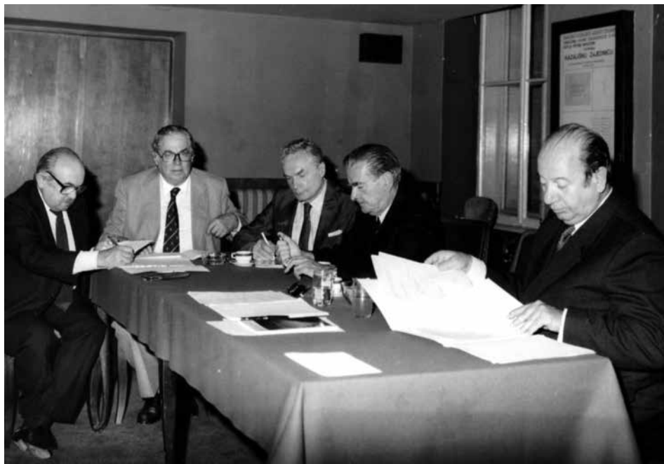
Slika 5. Žiri 2. međunarodnog natjecanja "Bach-Händel-Scarlatti" 1987. godine