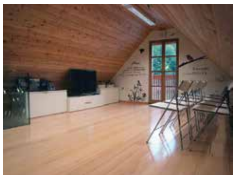
Slika 4. Unutrašnjost informativne točke