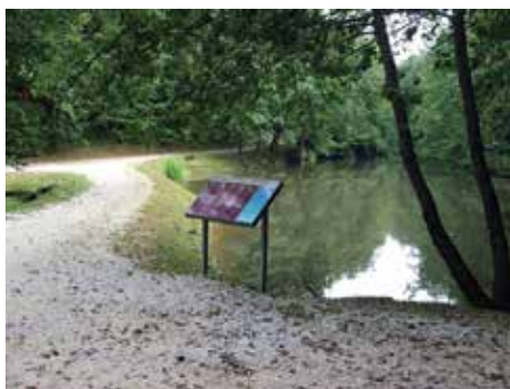
Slika 5. Informativno-edukativna ploča na poučnoj stazi

ciljeva razvoja prostornog uređenja županije i općine odgovarajuća zaštita, obnova, održavanje i promicanje prirodnih vrijednosti prostora. Trakošćan se nalazi u vrhu ponude kulturnog turizma sjeverozapadnog dijela Hrvatske i privlačno je odredište raznih kategorija posjetitelja. Obogaćen dodatnim sadržajima kao što su poučna staza sa informativnom točkom značajnije će se unaprijediti zaštita prirode i potaknuti turistički razvoj. Realiziranim projektom potaknut će se pozitivan odnos prema prirodi, podići će se razina svijesti i educirati će se posjetitelji i lokalno stanovništvo o potrebi i razlozima zaštite vrsta i staništa oko jezera Trakošćan i pripadajuće park-šume.