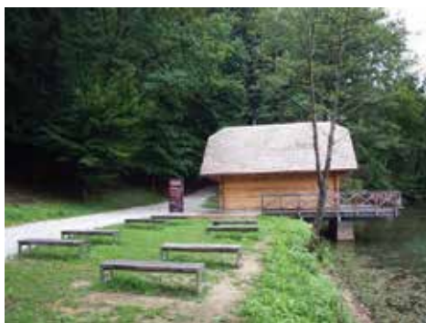
Slika 3. Kućica na jezeru - informativna točka

za vrijeme šetnje. Informacije su prezentirane kroz više razina: plan park-šume pruža nam prikaz s ucrtanim sadržajima i punktovima poučne staze, šumskim čistinama, pravilima ponašanja i drugo, dok informativno-edukativne ploče daju općenite podatke o prirodnim vrijednostima i zanimljivostima područja (šumske zajednice, livadne zajednice, močvarno i vodeno bilje, životinje livada i šuma, ptičji svijet, Trakošćansko jezero, obilježja perivoja i slično). 8 Dijeli se i besplatna dvojezična brošura s osnovnim informacijama. 9 Također su još u planu i informativne ploče s ilustracijama flore i faune te legende koje bi označavale pojedine primjerke biljnih vrsta (drveće, grmlje). Poučna staza pruža informacije svim posjetiteljima o prirodnim (biološkim i krajobraznim) vrijednostima i zanimljivostima park-šume i okolnog područja, te istovremeno educira djecu i odrasle kako bi prepoznavali pojedine vrsta drveća, grmlja zeljastih biljaka i životinja.