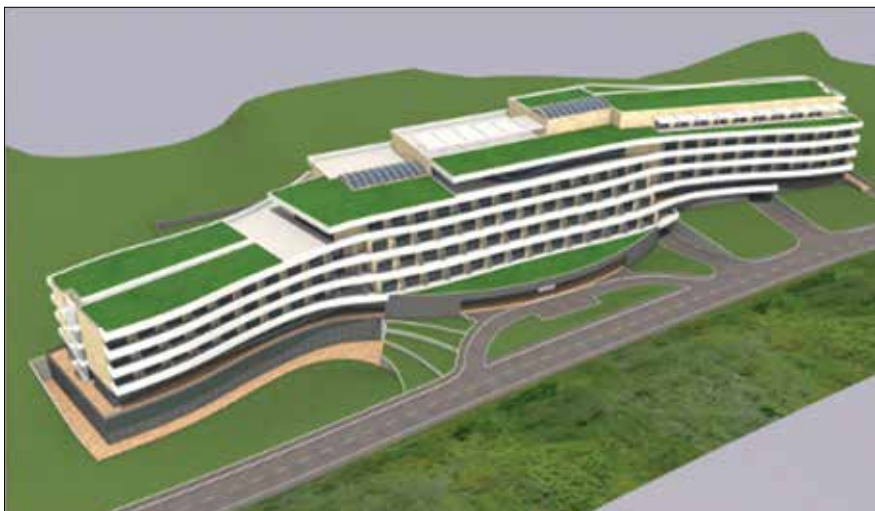
Slika 3. Vizualizacija projekta lječilišnog hotela “Jupiter” i spojne prometnice