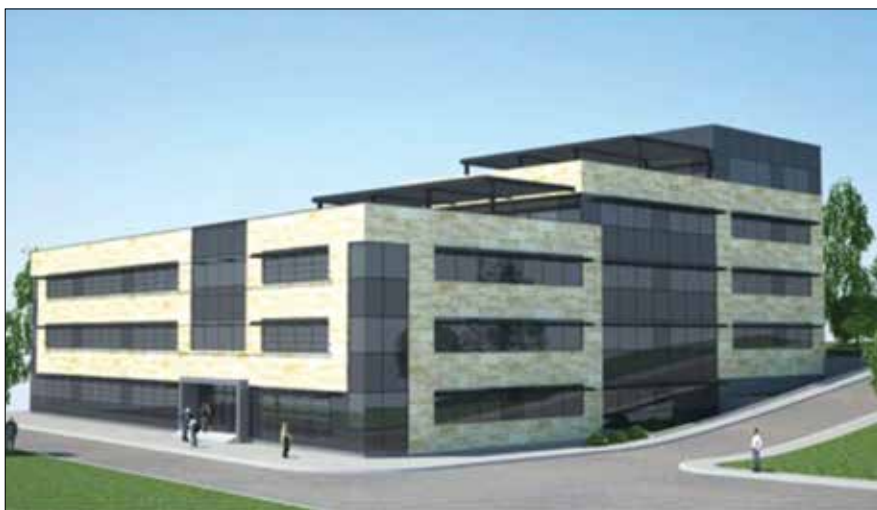
Slika 4. Vizualizacija projekta novog bolničkoga krila sa spinalnim centrom “Junona”