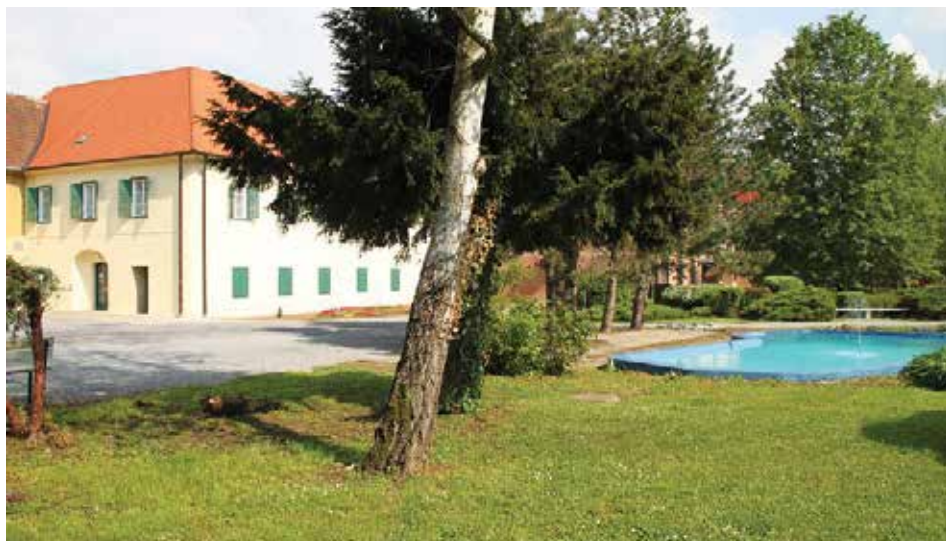
Slika 2. Specijalna bolnica za medicinsku rehabilitaciju Stubičke Toplice

U Specijalnoj bolnici za medicinsku rehabilitaciju Stubičke Toplice na raspolaganju je 235 kreveta od čega je 85 slobodnih, odnosno neugovorenih s Hrvatskim zavodom za zdravstveno osiguranje. Radnika medicinske struke je 119, a ostalih 63. U 2013. ostvareno je 62.679 noćenja od strane 15.723 isključivo domaćih klijenata. Poslovna 2013. završena je s prihodom od 39.519.898,00 kuna. 11