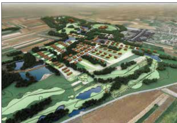
Slika 5. Konceptualno rješenje urbanizma (master plan) razvoja resorta "Thermae Hortus Croatiae" izrađeno od strane Hosting grupe koje je bilo temelj za promjene i dopune Plana Grada Preloga i izradu DPU-a

Vrijednost ukupne imovine, koja se nalazi u vlasništvu AAT-a d.o.o. (zemljišta, dokumentacija i infrastruktura bušotina) bez svih tereta, procijenjena od strane sudskog vještaka u siječnju 2010. iznosila je 18.572.000,00 eura s time da ta procjena ne predstavlja cijenu za ulazak partnera u projekt koja se postiže individualnim dogovorom.