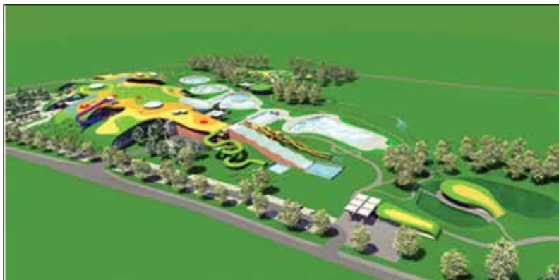
Slika 6. Vizualizacija glavnog projekta za izgradnju 1.a. faze projekta velikoga "Vodenog, Wellness i Lječilišnog Parka"

Grupa Hosting je putem AAT-a d.o.o. Draškovec razvila i izradila projektnu dokumentaciju u fazi glavnog projekta za izgradnju 1.a. faze (projektant: URBIA d.o.o. Čakovec), koja se odnosi na izgradnju velikoga "Vodenog, Wellness i Lječilišnog Parka" na 120 tisuća četvornih metara programsko-funkcionalne ponude: unutarnjih bazenskih površina s atraktivno hortikulturno i ambijentalno uređenim izvanbazenskim prostorom za uživanje i rekreaciju, wellness i beauty centrom s bazenom, saunama te vrhunskim beauty uslugama i masažama, specijalističke "medico spa" ponude diagnostičko-terapeutskog centra, opuštajućeg wellnessa, sauna svijeta s 14 unutarnjih i vanjskih sauna te pripadajućim bazenima, vanjskih bazenskih površina s najatraktivnije uređenim hortikulturnim parkom te rekreacijskom i opuštajućom ponudom, centralnom i sezonskom ugostiteljskom ponudom uz brojne mogućnosti za sport i rekreaciju (odbojka na pijesku, tenis, igre s loptom i slično). Ukupna vrijednost ulaganja za planiranu 1.a. fazu razvoja projekta iznosi oko 24,4 milijuna eura bez vrijednosti zemljišta i infrastrukture bušotina te dosad izvedenih ulaganja dokumentacije. Projekt u 1.a. fazi predviđa vrijeme izgradnje od šesnaest do osamnaest mjeseci, a godišnja bruto dobit prije oporezivanja, plaćanja kamata i amortizacije planira se u iznosu od 3,7 do 4,5 milijuna eura. 39