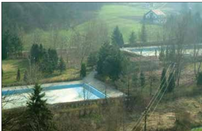
Slika 5. Bazeni u Sutinskim Toplicama

Danas u Sutinskim Toplicama postoje tri otvorena bazena, a voda je pogodna za liječenje ženskih bolesti, reumatizma, mokraćnih organa, duševnih bolesti, išijasa itd. Po okolici su moguće šetnje i raznovrsne sportsko-rekreacijske aktivnosti na otvorenom. 40 S obzirom na nepostojanje funkcionalnih građevinskih objekata i zapuštenost bazena, Sutinske Toplice predstavljaju idealan lokalitet za brownfield investicije koje strategijom razvoja trebaju precizirati Krapinsko-zagorska županija i Općina Mače u svojoj Strategiji razvoja za razdoblje do 2020. 41