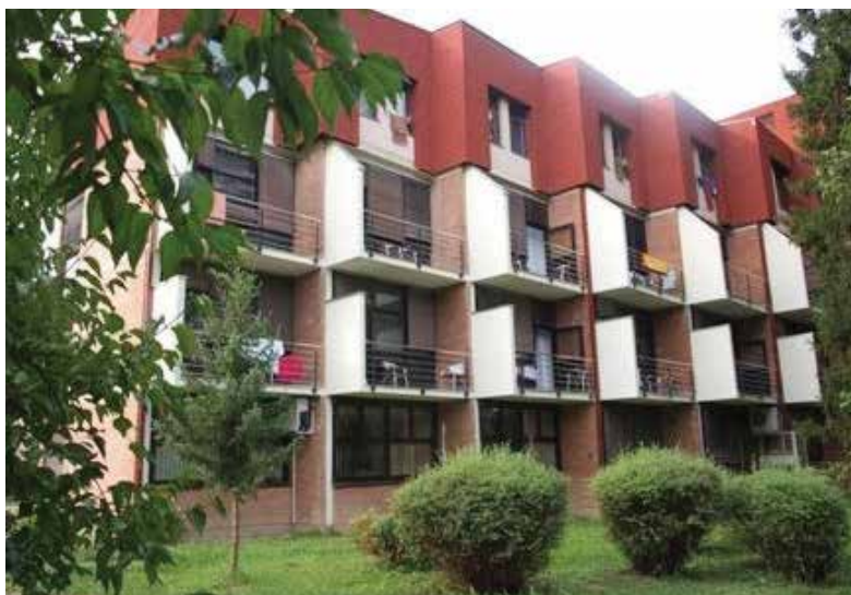
Slika 3. Specijalna bolnica za medicinsku rehabilitaciju Stubičke Toplice

U Specijalnoj bolnici za medicinsku rehabilitaciju Stubičke Toplice na raspolaganju je 235 kreveta od čega je 85 slobodnih. Radnika medicinske struke je 119, a ostalih 63. U 2013. ostvareno je 62.679 noćenja od strane 15.723 isključivo domaćih klijenata. Poslovna 2013. završena je s prihodom od 39.519.898,00 kuna. 15