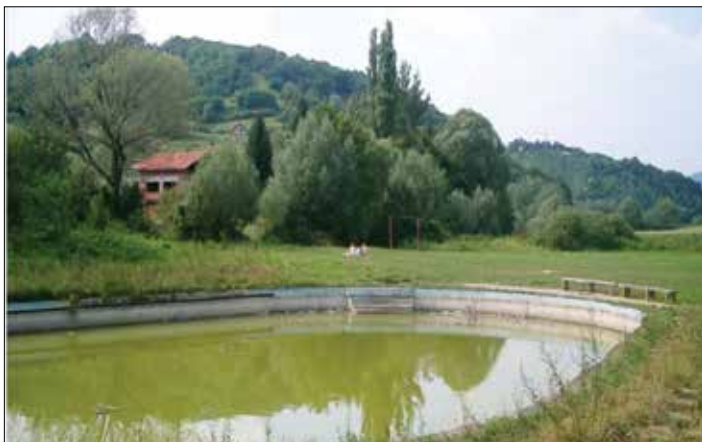
Slika 6. Bazen u Šemničkim toplicama

investitor. Posljednjih godina mještani Donje Šemnice samoinicijativno održavaju ovo kupalište uređujući okoliš, čisteći i krpajući bazen. 43