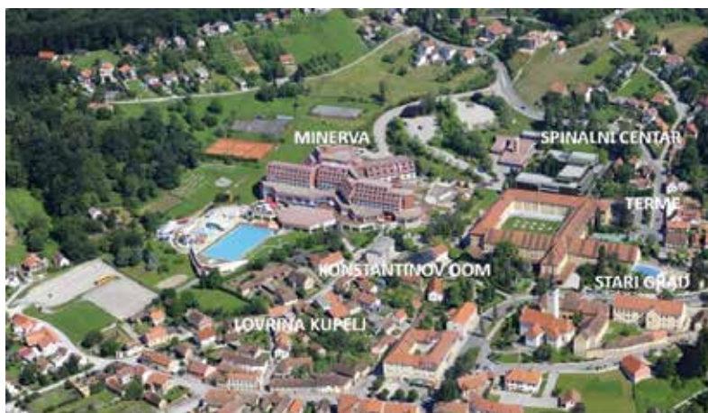
Slika 4. Specijalna bolnica za medicinsku rehabilitaciju Varaždinske Toplice

Kapacitet Specijalne bolnice za medicinsku rehabilitaciju Varaždinske Toplice broji 923 kreveta od kojih je slobodno 435. Medicinskih radnika je 335, a ostalih 341. U 2013. ostvareno je 199.940 noćenja. Strukturu klijenata čini 3.799 (87 posto) domaćih i 556 (13 posto) inozemnih, a ukupan prihod u 2013. iznosio je 108.927.987,00 kuna. 17