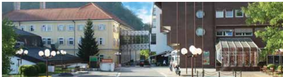
Slika 2. Specijalna bolnica za medicinsku rehabilitaciju Krapinske Toplice