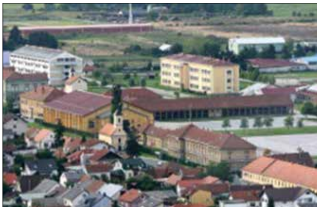
Slika 7. Lokacija Optujska (Izvor: Strateški plan razvoja turizma Grada Varaždina do 2020, Institut za turizam, 2013, 85.)

O zdravstveno-turističkim potencijalima Varaždina već je navedeno u poglavlju 3. 1. ovog rada, tako da će se u ovom potpoglavlju samo podrobnije opisati iskoristivost bivše vojarne u Optujskoj ulici kao jedne od najprikladnijih lokacija za brownfield investiciju u Hrvatskom zagorju i šire.