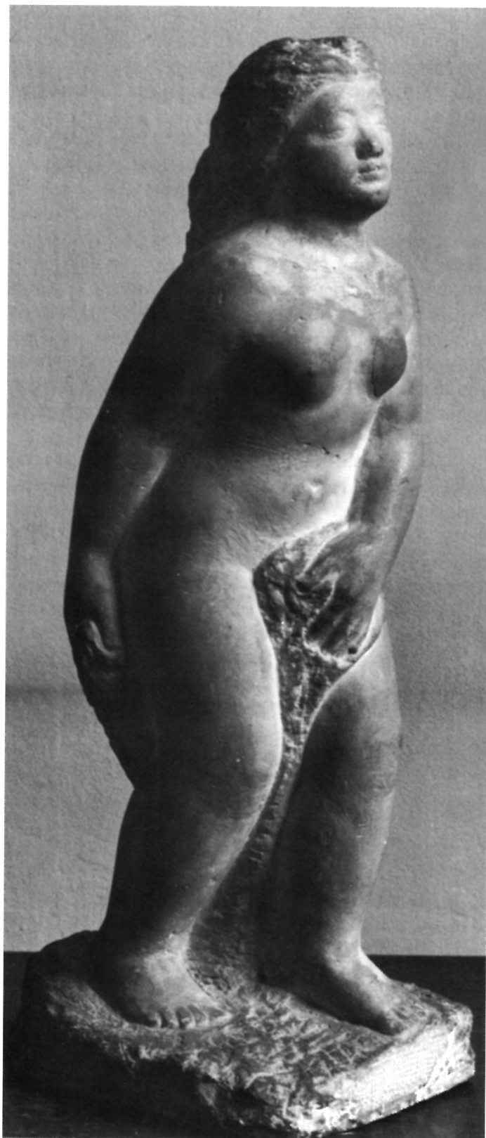
4. Vojin Bakić: Kupačica , vl.. Šojat-Bošnjak, vizura s obje ruke, foto: M. Drmić, IPU