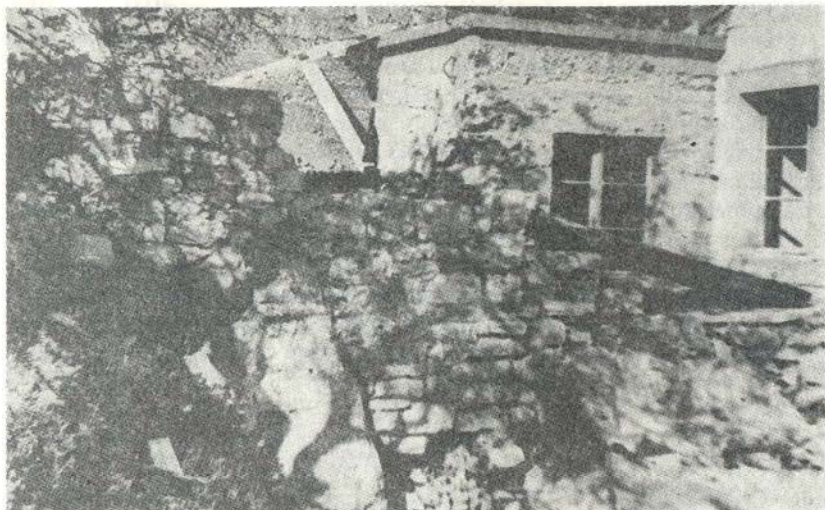
3. Ostatak zida crkvice sv. Ciprijana u Hvaru

Osim samog grada Hvara, a za dobiti potpuniju i zorniju sliku antičkog naselja Hvara, potrebno je dati pregled arheoloških nalaza njegova šireg područja, koji je historijski i prirodno konvergentan njemu, osobito u gospodarskom pogledu. Šire područje grada Hvara stere se od rta Pelegrin na zapadu do sela Velo Grablje na istoku i s Paklenim otocima ispred.