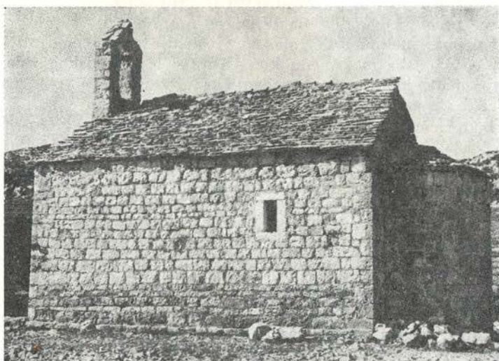
4. Južna strana crkvice sv. Marije Magdalene na Hvaru

Držeći da je Pharia bila na mjestu današnjeg Hvara G. Machiedo je nastojao i konkretizirati neke momente u vezi solinskog mučenika sv. Anastazija. 115) Tako on navodi da je na mjestu današnje crkve sv. Roka bila od starine crkva sv. Anastazija na čijem je mjestu onda u 15. stoljeću izgrađena današnja. Kao prilog tomu