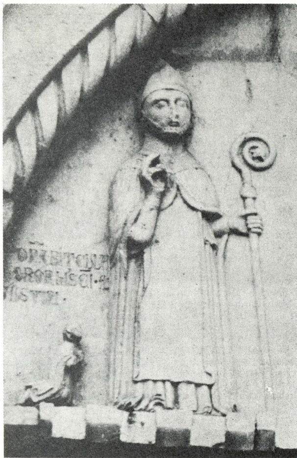
15. N. Dente, Vrata dominikanske crkve u Trogiru

Djelovanje Nikole Denta bilo bi datirano u Splitu 1355, a u Trogiru oko 1372. godine. Time bi taj mletački kipar ispunjao