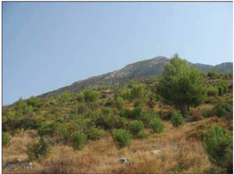
Slika 5. - Pokusna ploha 4.

Ovdje je 1994.-1995. podignuta kultura alepskog bora sjetvom sjemena. Ista se prilično dobro razvijala do ponovnog požara koji ju je napao 2001. Taj požar je u većini uništio kulturu, ali su mjestimično preostale skupine ili pojedina stabla koja nisu nastradala. Opožarene površine su pošumljene sadnjom kontejnerskih sadnica pinije (1+0) u jame. Pošumljavanje je vršeno u jesen 2001., s oko 2000 sadnica po ha, a na proljeće 2002. je slijedilo popunjavanje. Nakon pet godina primitak je oko sedamdeset posto, što je za ovakav teren vrlo uspješno i stabilca se polako ali sigurno razvijaju. Primijećena su i pojedina stabalca pomladka alepskog bora, čija je obnova bila prirodna, od naleta sjemena sa strane i od ostataka prethodne kulture. Za očekivati je da će se zbog svojih skromnih ekoloških zahtjeva njegov udio s vremenom povećavati. Od autohtone vegetacije, nakon požara se iz panja najbolje oporavlja zelenika, a značajni su još i crni jasen i tršlja. U budućnosti će se ova sastojina razviti u lijepu mješovitu borovu (pinija i alepski) sastojinu s elementima listača u donjoj etaži, naravno ako će biti pošteđena od požara.