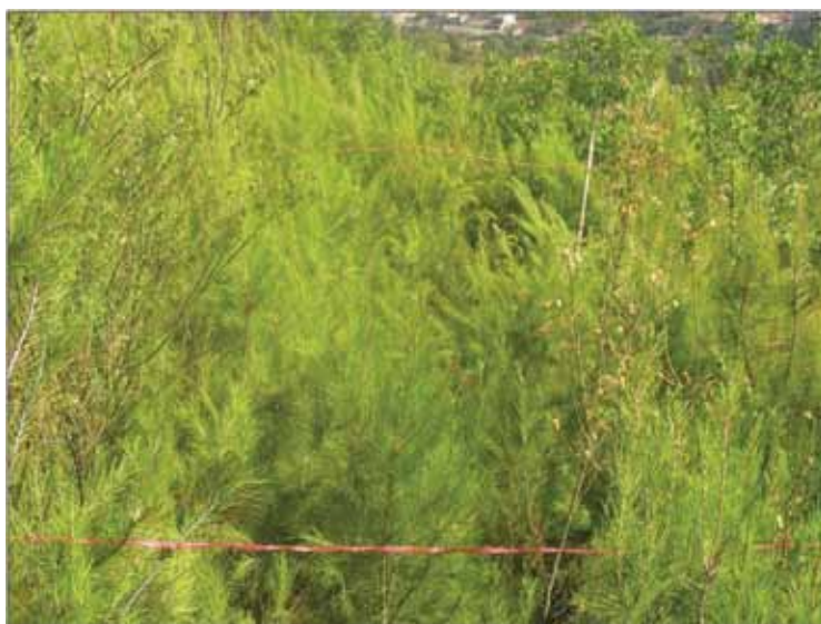
Slika 3. – Pokusna ploha 2.