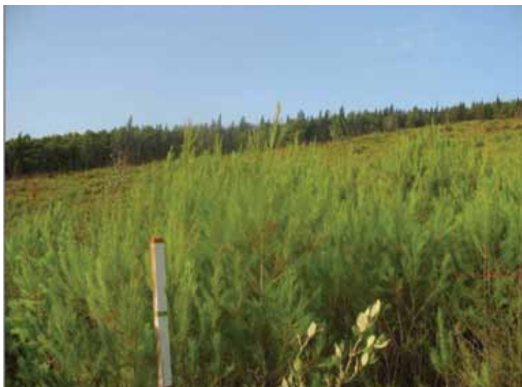
Slika 2. Pokusna ploha 1.