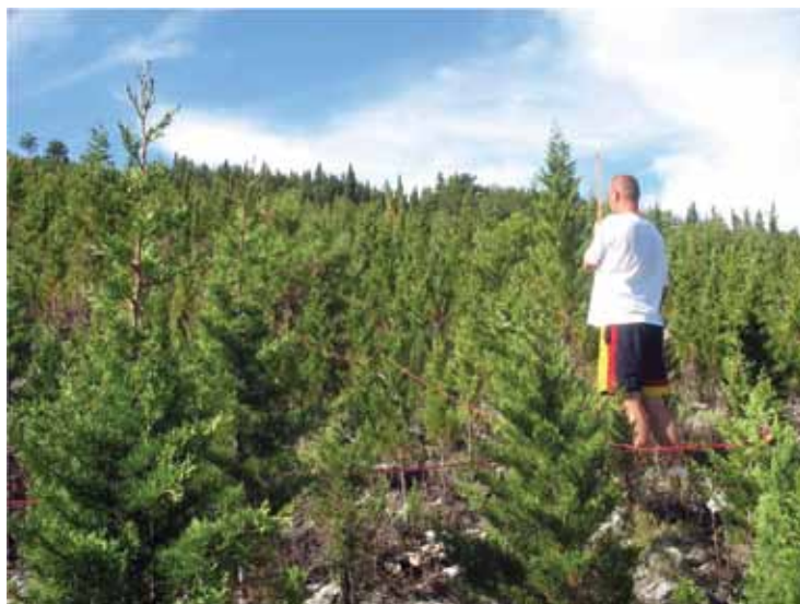
Slika 7. – Pokusna ploha 6.

Mješovita sastojina dalmatinskog crnog bora s običnim čempresom stara oko 45 godina nastradala je u požaru u ljeto 1996. godine, a u jesen je izvršena sanacija požarišta. Nakon toga se sastojina relativno uspješno obnovila prirodnim putem, s time da se čempres obični, zbog izraženijih pirofitskih sposobnosti, bolje obnovio nego crni bor. Godine 2006. je obavljena njega sastojine proredom, s naglaskom na oslobađanju borova. Trenutno je omjer smjese uvjerljivo u korist običnog čempresa. U sljedećim gospodarskim razdobljima trebalo bi kroz zahvate njege i dalje, što je moguće više, radi mješovitosti podržavati crni bor. Isto je poželjno pomagati autohtonu vegetaciju kada se pojavi (dub, crni jasen, maklen, smrič...)