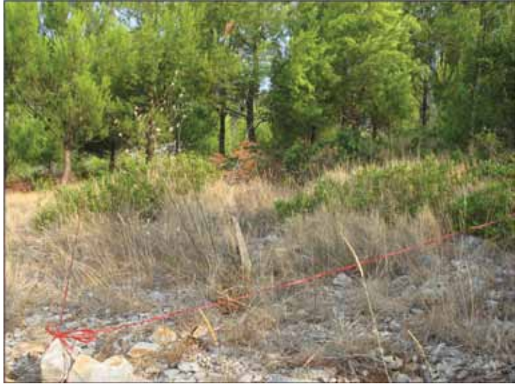
Slika 4. - Pokusna ploha 3.