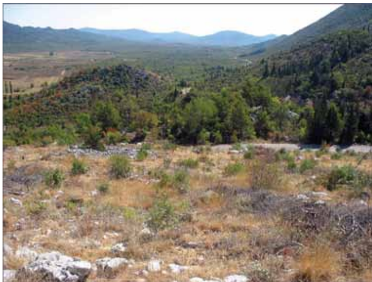
Slika 6. – Pokusna ploha 5.