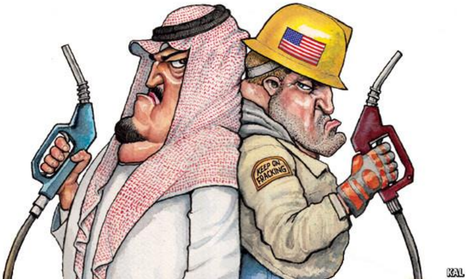
The Economist , London: "Sheikhs vs. shale" / cartoon by Kal Kallaugher

Izvor: Oil and Gas Eurasia , 12.11.2015.