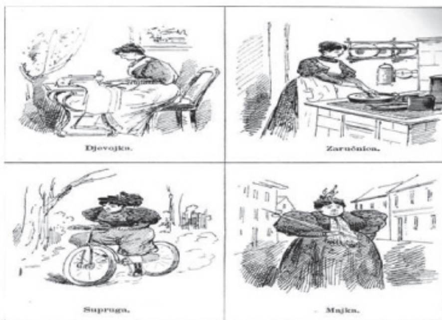
Slika 12: Trn (Zagreb), god. IX., br. 8., 20. IV 1899., 5.