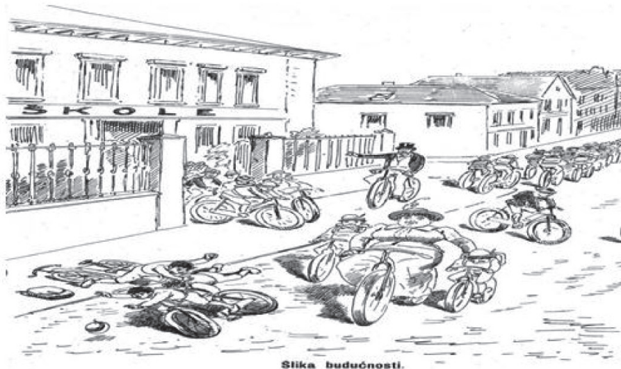
Slika 11: "Slika budućnosti, Trn (Zagreb), god. IX., br. 10., 20. V 1899., 8.

Budući da je tadašnje društvo emancipaciju žena sagledavalo kao negativnu pojavu koja ruši sve tradicionalne i moralne vrednote, cilj je bio da se nova žena javnosti predstavi kao raskalašena, tašta, nemoralna i rasipna. Glavnina pravaške kritike odnosi se, prema tome, na bogate građanske žene. Prikazane su kao osobe koje ne poštuju instituciju braka, koje varaju i vode glavnu riječ u kući te pritom nerijetko i fizički zlostavljaju muževe. Služavke i igračice (plesачice) pritom su prikazane kao žene s najmanje morala. Zvekan je svaku stranicu posvetio prikazu nove žene , koristeći se pritom naslovima: "Moderni nazori braka", "Odviše dekoltirana", "Chic", "Moderno", "Pogled u budućnost", "Grozna budućnost", "Trokut u modi", "Današnja mladež". Bicikl je postao simbol feminističkoga pokreta u XIX. stoljeću. 126 Taj novootkriveni prijevoz generirao je osjećaj snage i slobode među ženama, koje su počele nositi hlače i tako promijenile ideju o ženskoj ljepoti. Da je spomenuti trend pristigao i u hrvatske krajeve pokazuje karikatura "Slika budućnosti". 127