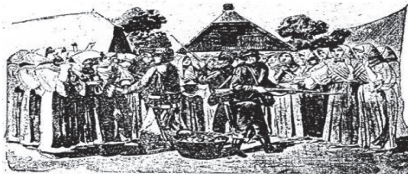
Obćinski organi među ženama lokote na usta.