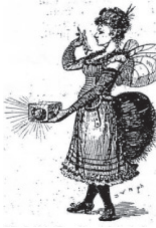
Slika 5: Muha (Zagreb), god. I., br. 1., 5. XI 1897., 3.

Jedini satirični list koji se izravno dotaknuo pitanja prava glasa bila je Muha . Iako je izišao samo jedan broj, nadasve je značajan jer je pisao afirmativno o ženskom pitanju. Muha je u listu prikazana sa ženskim fizičkim osobinama: u jednoj ruci, poput prave novinarkе, drži pero, a drugoj fotografski aparat.