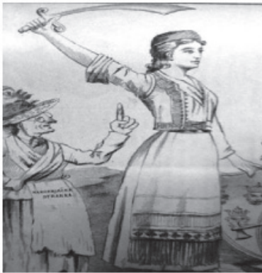
Slika 1: "Dalmatinsko pitanje", Stršen (Zagreb), god. II., br. 8., 20. IV 1900., 8.

vrijednosti. Dalmacija je u karikaturi "Dalmatinsko pitanje" prikazana kao mlada žena u narodnoj nošnji koja kaže: Nije blago ni srebro ni zlato, već je blago što je srcu drago! 44 U karikaturi "Zagorska bieda" lik majke koristi se kao alegorija napaćene domovine koja se nalazi pod tuđinskom vlasti: Uz kamenje prikovana, roni suze tužnih dana: žrtva biednog udesa, vaj njen vapi do nebesa! 45