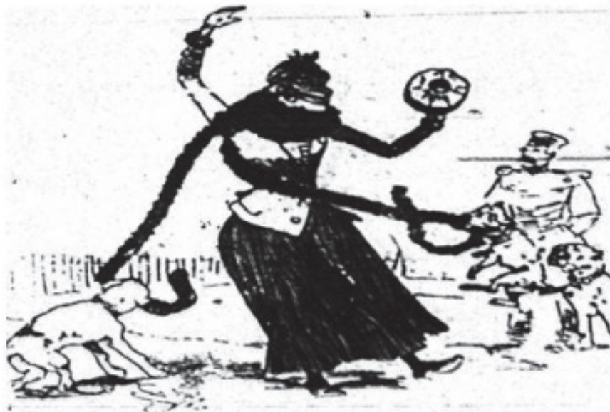
Slika 9: "Talent za sve", Trn (Zagreb), god. IX., br. 18., 20. IX 1899., 7.