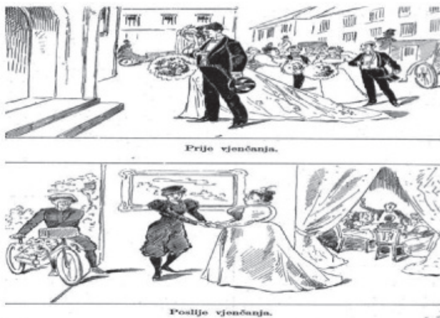
Slika 14: Trn (Zagreb), god. IX., br. 11., 5. VI 1899., 12.