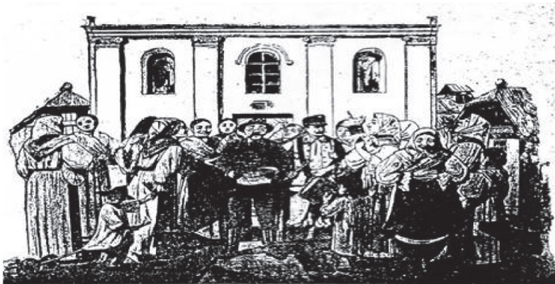
Proglašenje naredbe, da žene moraju za izbora šutiti.

Odjekuje bubanj na sve strane, sviat oko njeg radoznalo staje: "Čujte žene, to baš vas se tiče, što načelnik na znanje vam daje. Izbori su opet nam na vratih, a vi žene s jezikom za zube, kad se bira poslanik za Sabor onda žene zborit pravo gube. A da nebi čije liepe oči premamile izbornika koga, sve maramom zavežite oči, da ni muža ne vidite svoga. I da ne bi smetale vam uši, treba da ih začepite čime, kako ne bi izbornoga dana čule kojeg kandidata ime. Nije druge, pokorit se valja, nek se svaka na ćutanje spremi, svaka lokot dobit će na usta: izbori će od sada biti niemi." 72