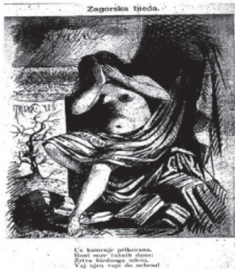
Slika 2: "Zagorska bieda, Čuk (Zagreb), god. I., br. 1., 1. IX 1888., 5.

učenja prema kojem je jezik glavni izraz duha naroda. 47 Iako su Starčević i pravaši isticali da su rijetki pojedinci koji se nisu priklonili sredini u kojoj svi "njemčare" i žive od danas do sutra bez ikakva ljudskoga i narodnoga cilja, u humorističko-satiričkim listovima uglavnom se žene kritiziraju zbog odnarođenosti. Na pitanje Koje i kakove gospodje i gospodjice u nas švabčare , Stršen odgovara: polunaobražne, dosadne, cendrave, bez "smarta", jezičave, zavidne,