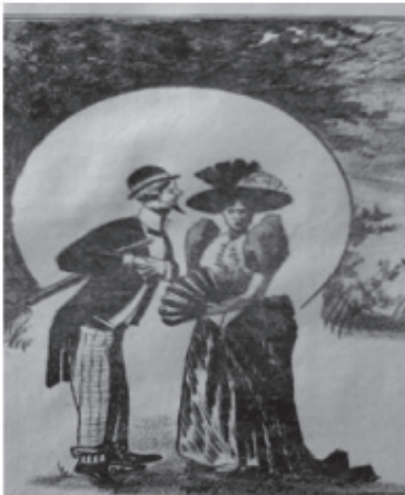
Slika 4: Trn (Zagreb), god. II., br. 2., 15. I 1892., 2.

klase upućivane su radi suzbijanja raznih "pomodnosti". U skladu sa svojom nacionalnom ideologijom, pravaši su smatrali da žene svojim "doličnim" ponašanjem, "doličnim" odijevanjem, utjelovljuju granicu koja označuje granice kolektiviteta. 56 No blisko povezano sa zadaćom koja je dodijeljena ženi jest pitanje nedovoljne obrazovanosti žene kao i nemogućnost njezina sudjelovanja u političkom životu. Upravo se niska razina obrazovanja žena, ali i općenito širokih društvenih slojeva, pokazala kao velika kočnica u razvoju hrvatske kulture. 57 Djevojke iz građanskih obitelji učile su njemački, francuski, glasovir, ples, pjevanje, ali nisu imale pristup gimnazijama.