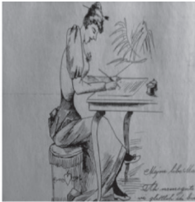
Slika 3: Prikaz moderne Hrvatice koja piše pismo na njemačko-hrvatskom jeziku, stalna rubrika u, Trnu ; Trn (Zagreb), god. II., br. 14., 15. VII 1892., 5.

učenja prema kojem je jezik glavni izraz duha naroda. 47 Iako su Starčević i pravaši isticali da su rijetki pojedinci koji se nisu priklonili sredini u kojoj svi "njemčare" i žive od danas do sutra bez ikakva ljudskoga i narodnoga cilja, u humorističko-satiričkim listovima uglavnom se žene kritiziraju zbog odnarođenosti. Na pitanje Koje i kakove gospodje i gospodjice u nas švabčare , Stršen odgovara: polunaobražne, dosadne, cendrave, bez "smarta", jezičave, zavidne,