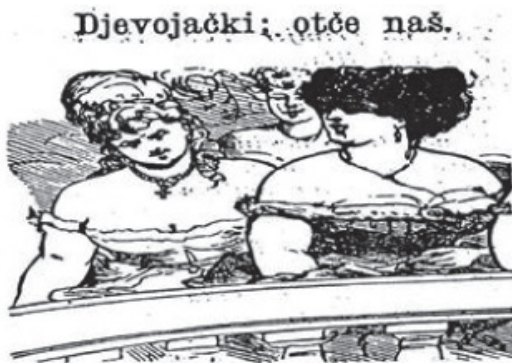
Slika 10: "Djevojački otče naš", Vragoljan (Zagreb), god. VI., br. 4., 20. II 1886

sobe pospremale i mužu oružje snažile. 123 Secesija, samosvjestan i reformistički stil koji se javio na samom kraju XIX. stoljeća, pravašima je služio kao pogrdni naziv za sve moderne tekovine. "Moderni" ili secesionisti imaju u Zagrebu vrlo jaku stranku – zagrebačke kokete. 124 Poseban je glasak stavljen na žensku modu, koja je izgubila