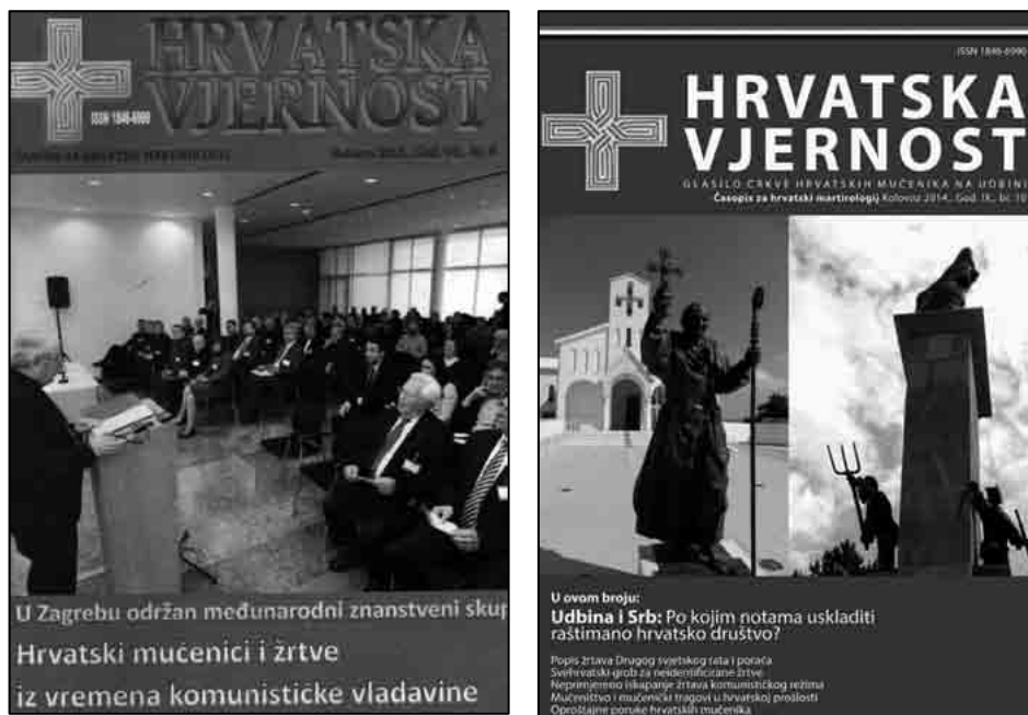
Sl. 1. Naslovnice časopisa Hrvatska vjernost , brojevi: 1/2006, 4/2008, 5/2009, 7/2011, 8/2012 i 10/2014. godine