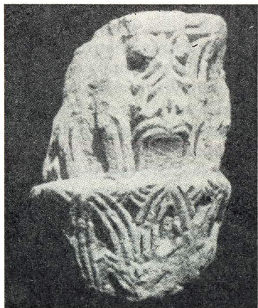
Glavica s Lužina

Gornja površina s abakusom najviše je oštećena tako da je ostala jedna polovica s originalnom obradom. Abakus je bio profiliran vodoravnim žlijebom ispod okvirne letvice. Na ovoj se površini sačuvala originalna visina rupe, a bila je izvrćena svrdlom i preko nje je fraktura. Ova je površina oktogonalnog oblika, jer to zahtijeva gornji dio košare koji je imao na sebi 8 listova. Abakus je vrlo plitak.